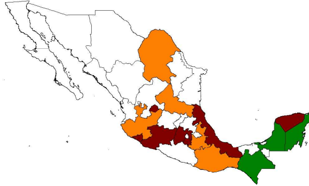
Figura 2. Estados de la República Mexicana que ha iniciado trabajos de las Estrategias Estatales sobre biodiversidad (rojo), que se encuentra en la fase de establecer convenios de colaboración para dar inicio a los trabajos (verde) y Estados que han expresado interés por iniciar los procesos (naranja) .

Jalisco, Coahuila, San Luis Potosí, Puebla y Oaxaca están en fase de acercamiento y se espera que en breve puedan firmarse convenios de colaboración.