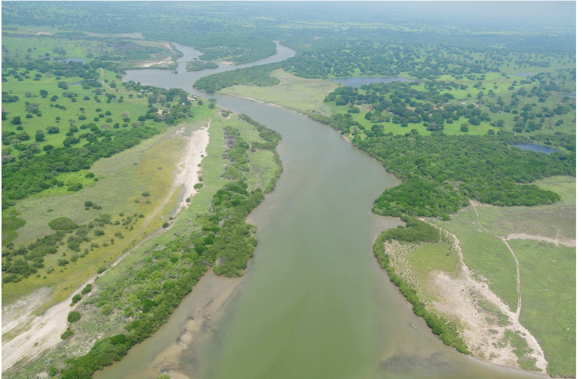
Fig. 3. Manglares de Barra de Ostones, Tamaulipas. Fotografía aérea panorámica.