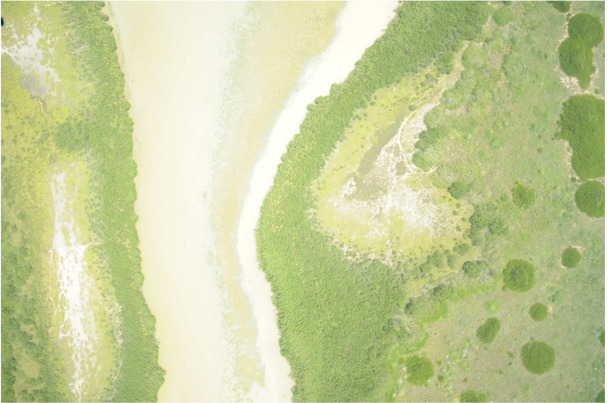
Fig. 8. Manglares de Barra de Ostones, Tamaulipas. Fotografía aérea vertical.