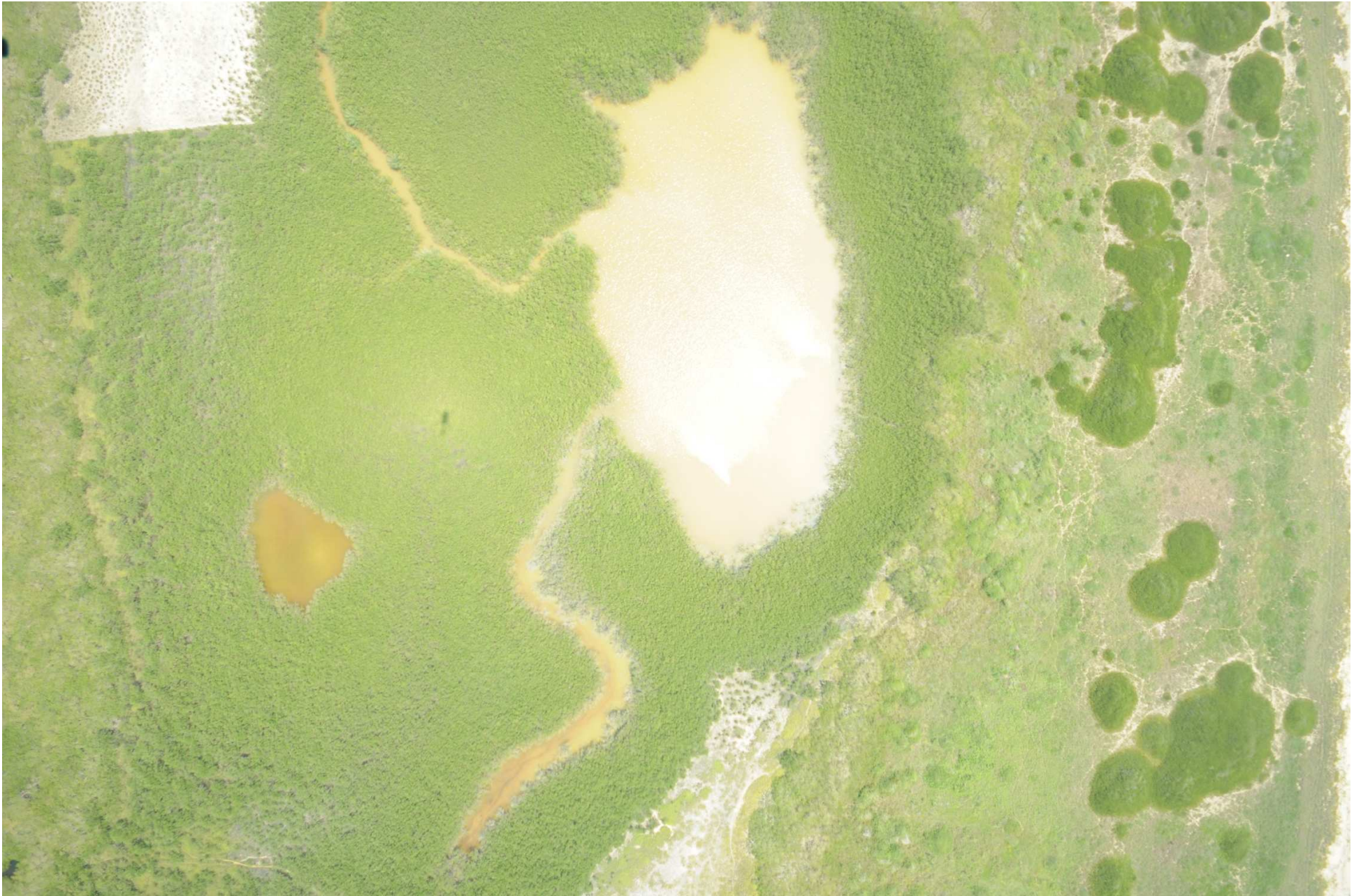
Fig. 6. Manglares de Barra de Ostones, Tamaulipas. CONABIO – SEMAR / J. Díaz (2008). Fotografía aérea vertical.