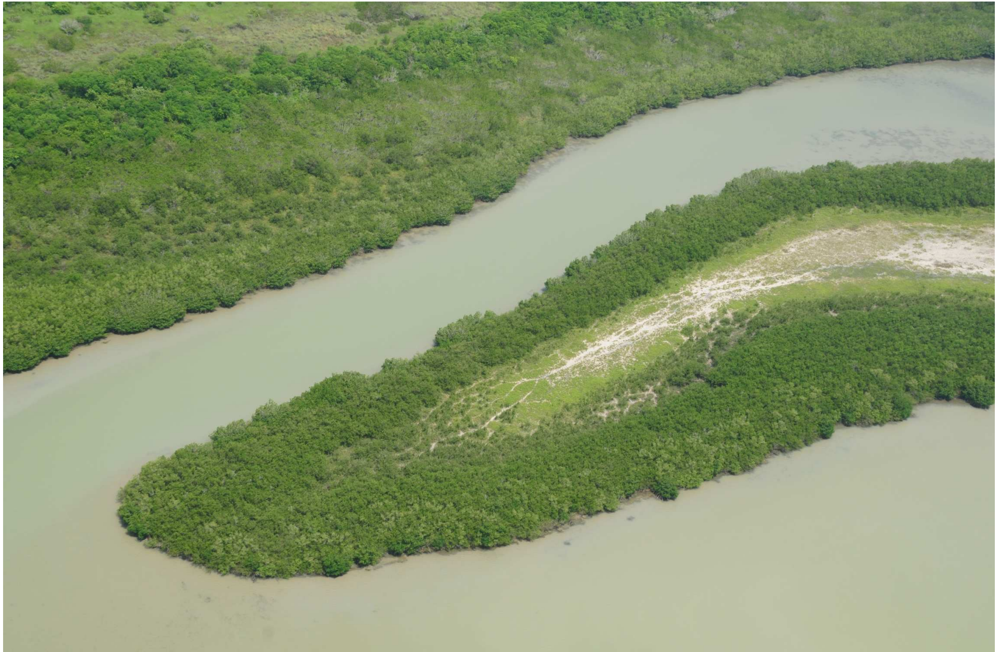
Fig. 1. Manglares de Barra de Ostiones, Tamaulipas. Fotografía aérea panorámica.