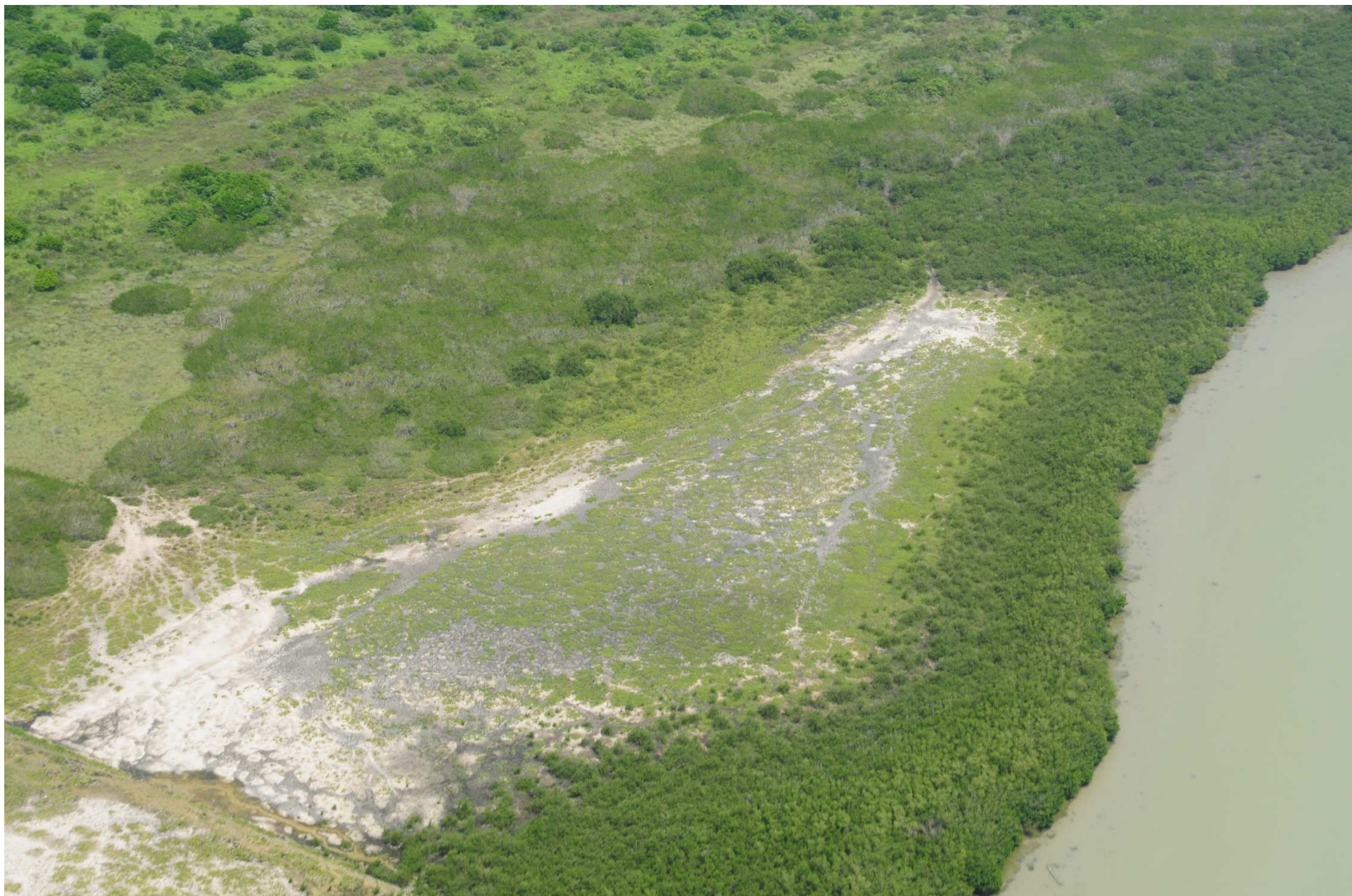
Fig. 2. Manglares de Barra de Ostiones, Tamaulipas. Fotografía aérea panorámica.