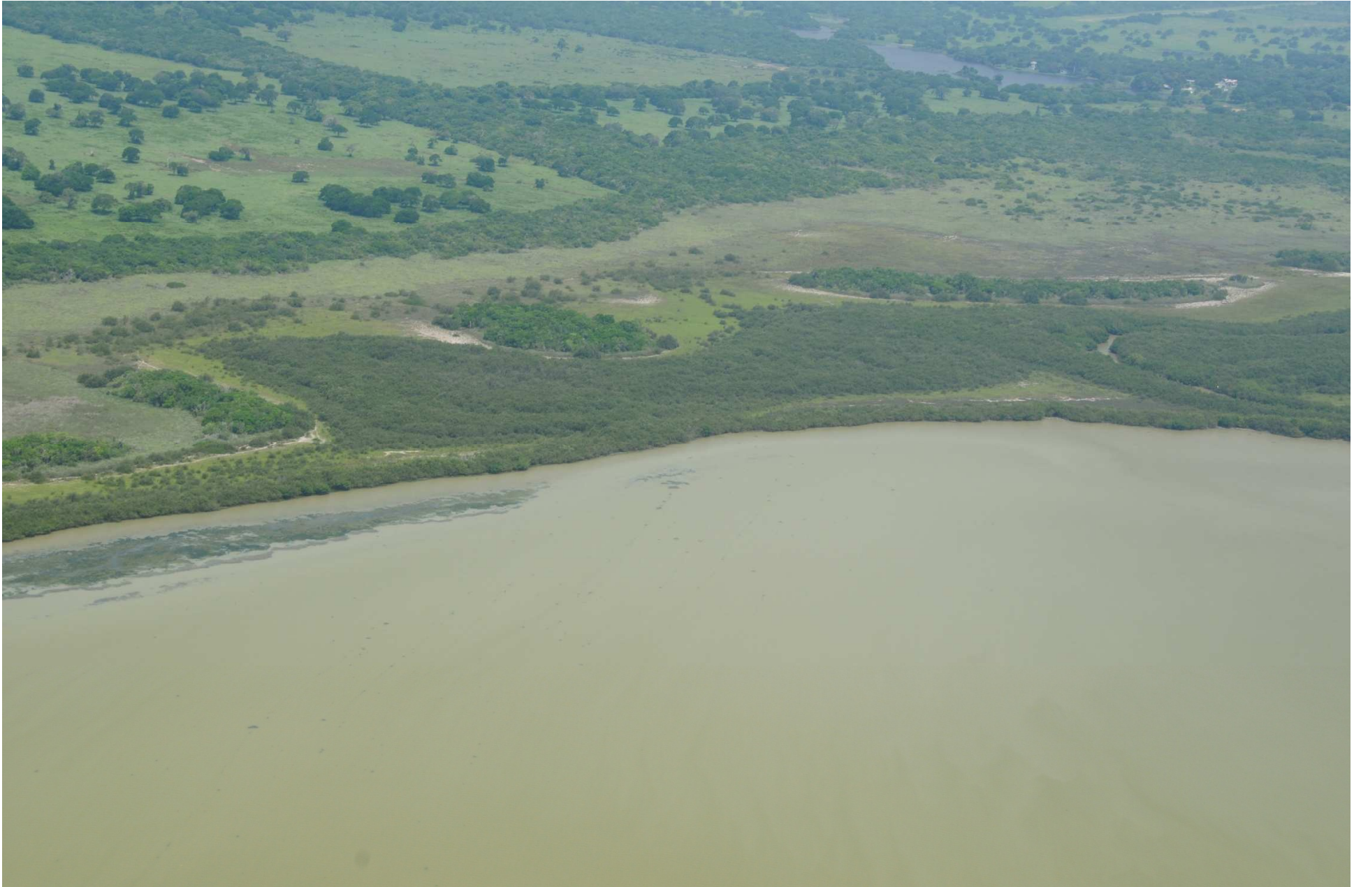
Fig. 4. Manglares de Barra de Ostones, Tamaulipas. CONABIO – SEMAR / J. Acosta-Velázquez (2008). Fotografía aérea panorámica.