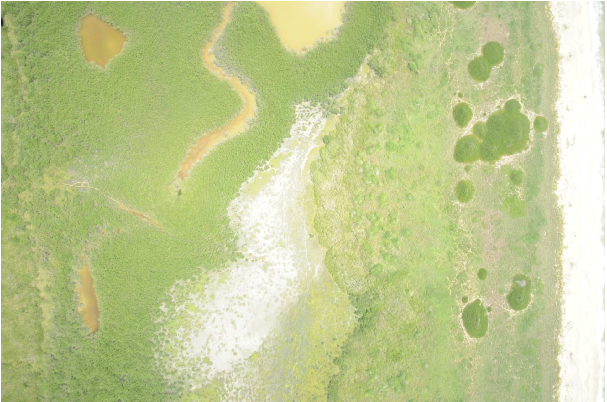
Fig. 5. Manglares de Barra de Ostones, Tamaulipas. Fotografía aérea vertical.