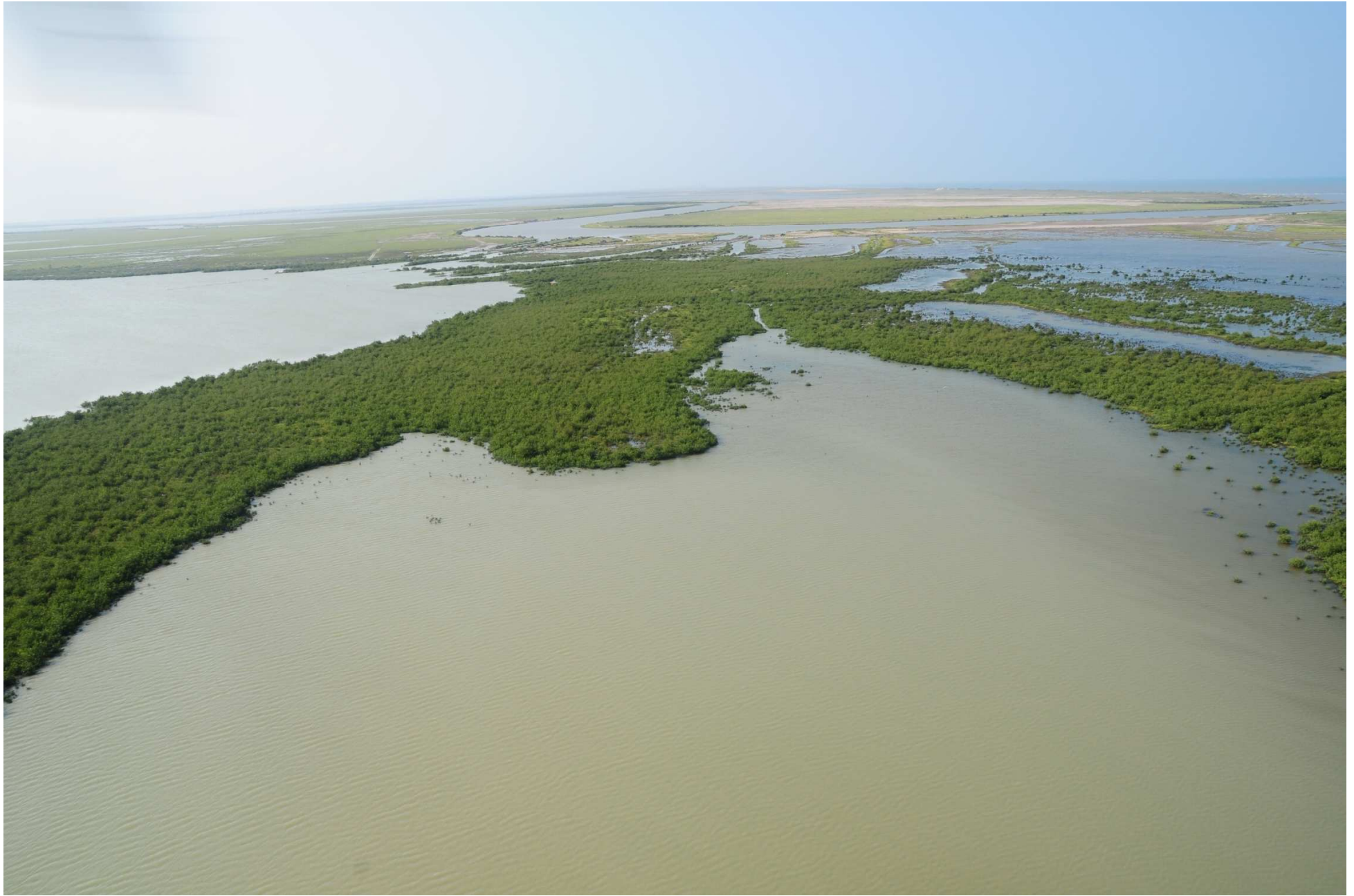
Fig. 3. Manglares del Delta de Río Bravo, Tamaulipas. Fotografía aérea panorámica.