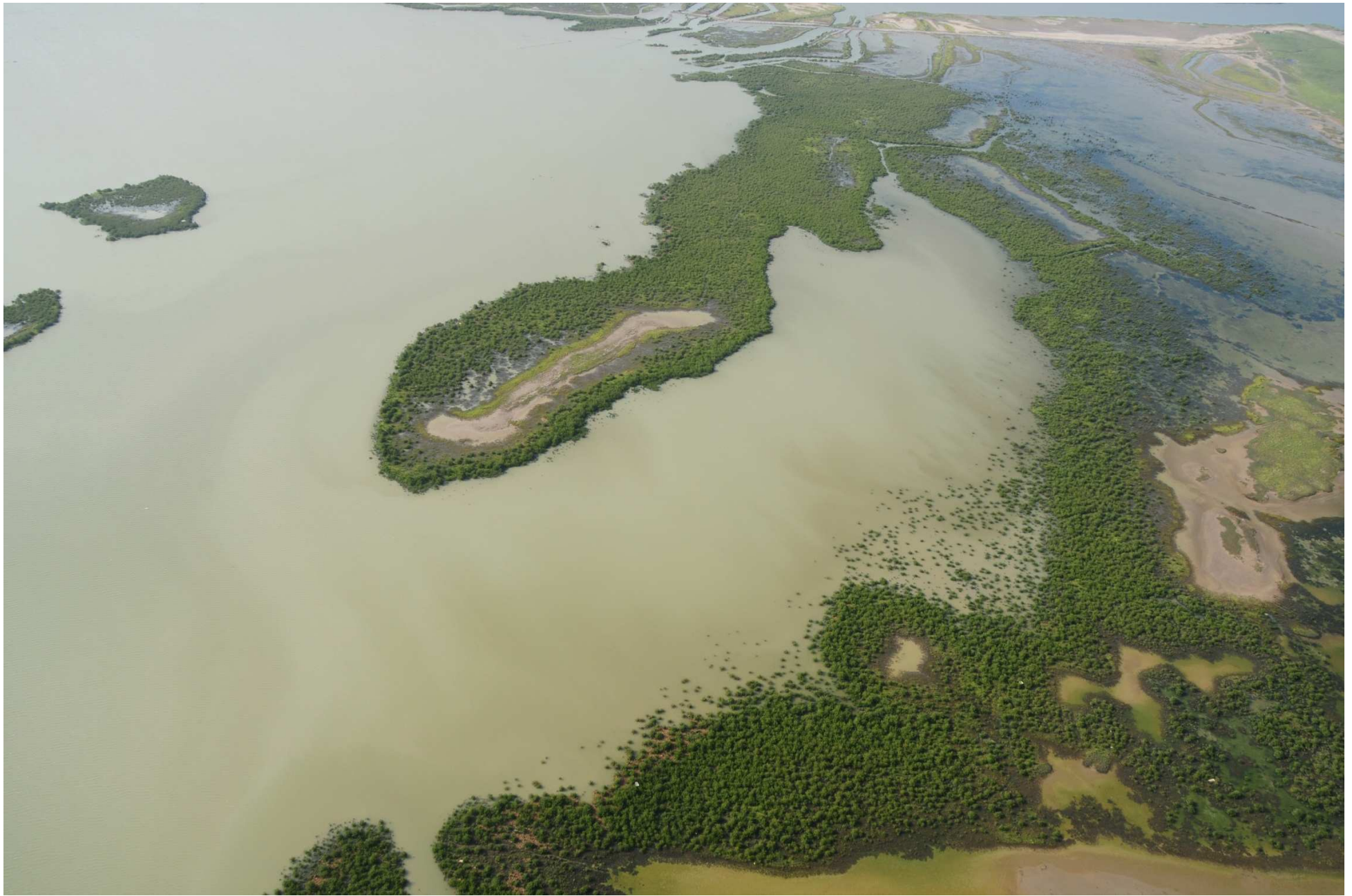
Fig. 4. Manglares del Delta de Río Bravo, Tamaulipas. CONABIO – SEMAR / J. Acosta-Velázquez (2008). Fotografía aérea panorámica.