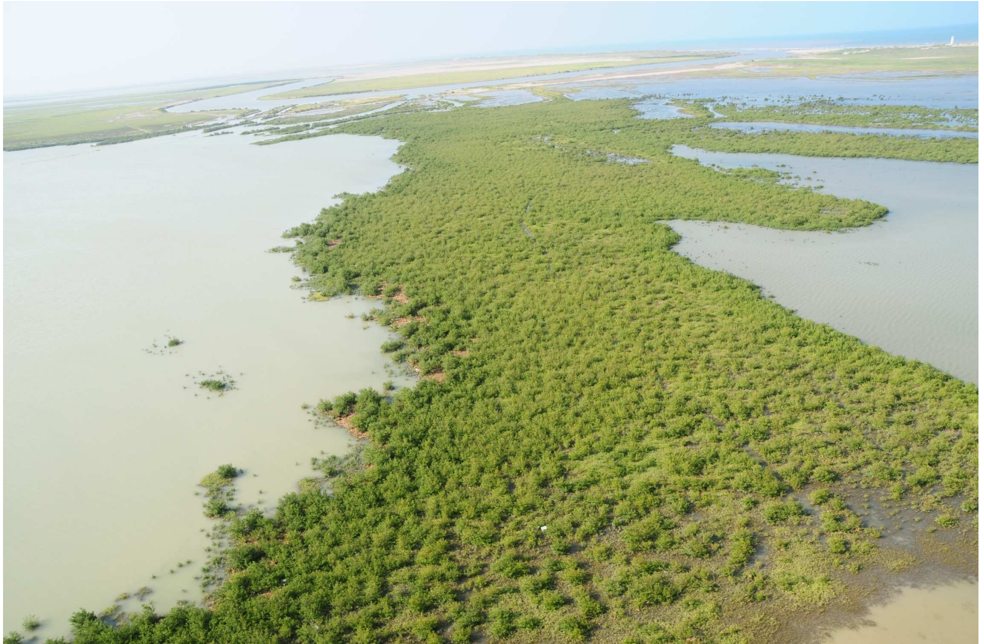
Fig. 1. Manglares del Delta de Río Bravo, Tamaulipas. CONABIO – SEMAR / J. Acosta-Velázquez (2008). Fotografía aérea panorámica.