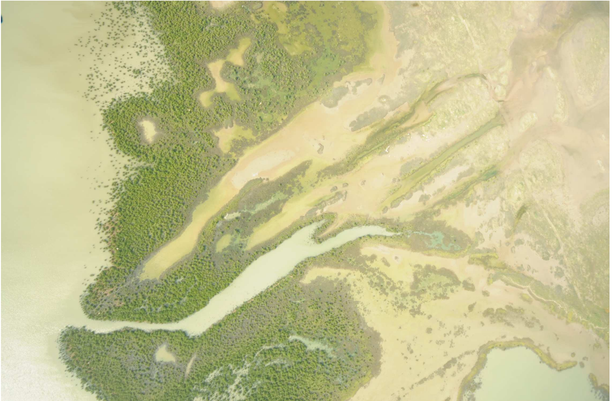
Fig. 8. Manglares del Delta de Río Bravo, Tamaulipas. CONABIO – SEMAR / J. Díaz (2008). Fotografía aérea vertical.