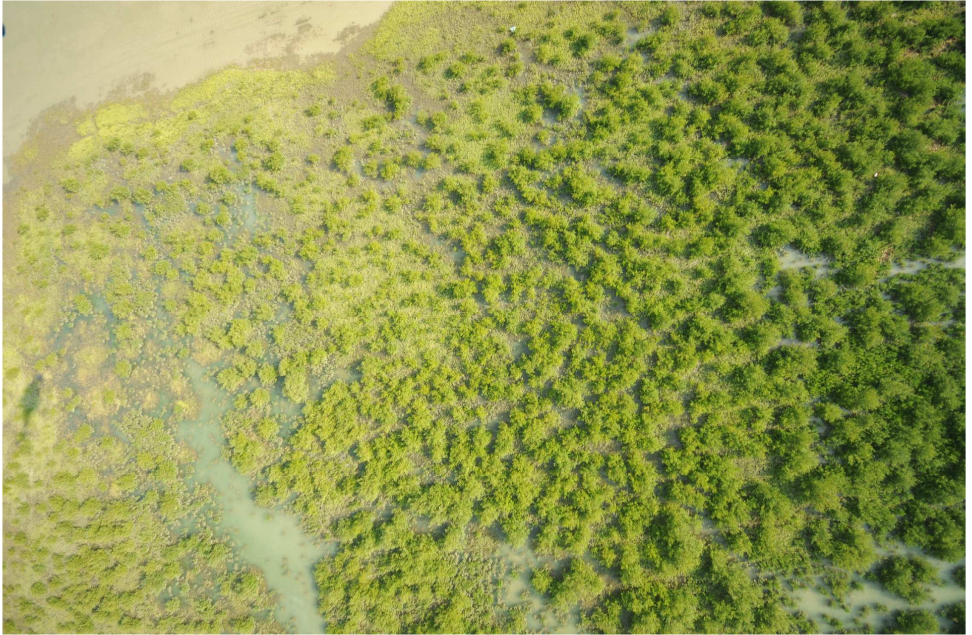
Fig. 7. Manglares del Delta de Río Bravo, Tamaulipas CONABIO – SEMAR / J. Díaz (2008). Fotografía aérea vertical.