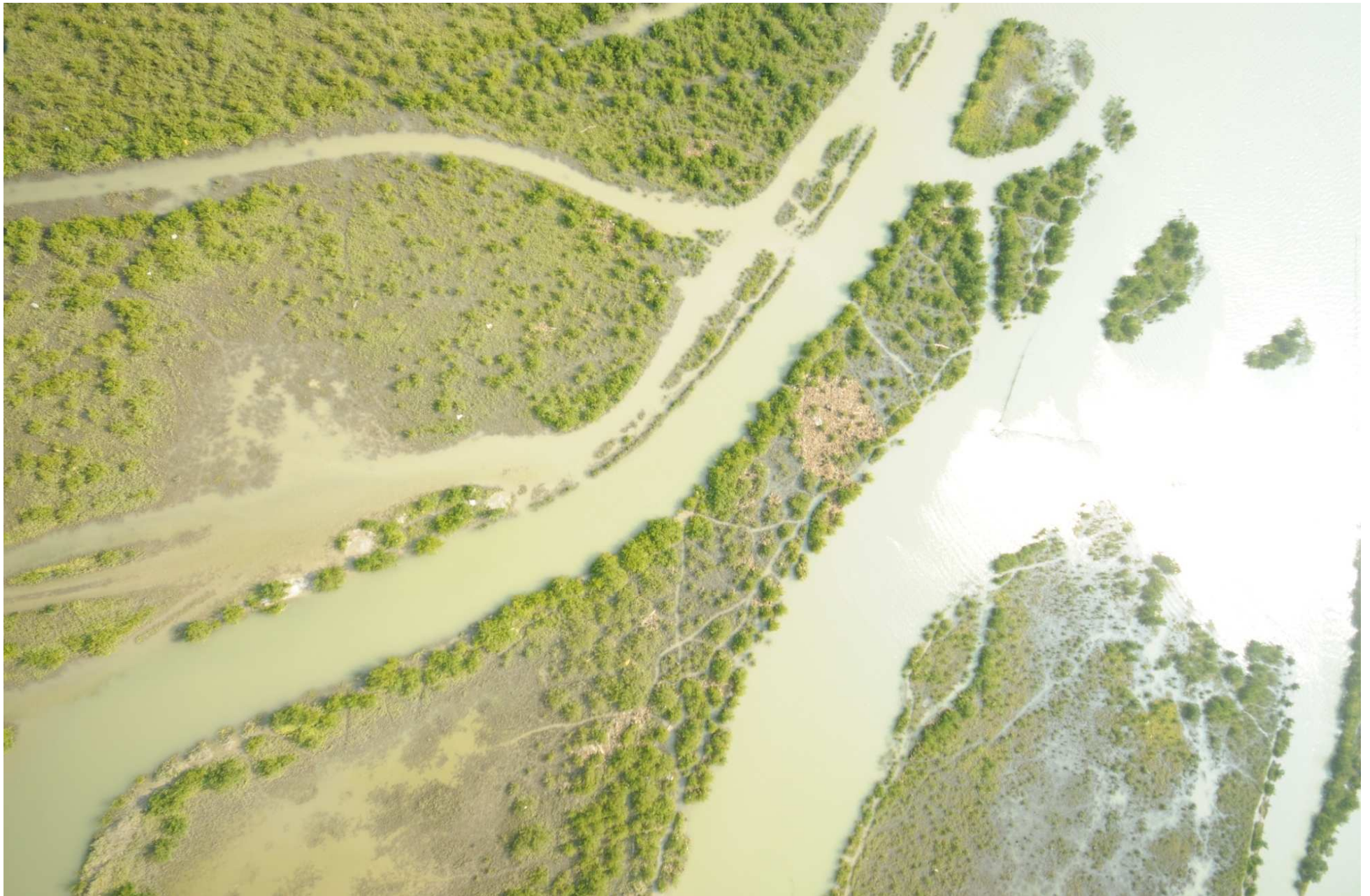
Fig. 5. Manglares del Delta de Río Bravo, Tamaulipas. Fotografía aérea vertical.