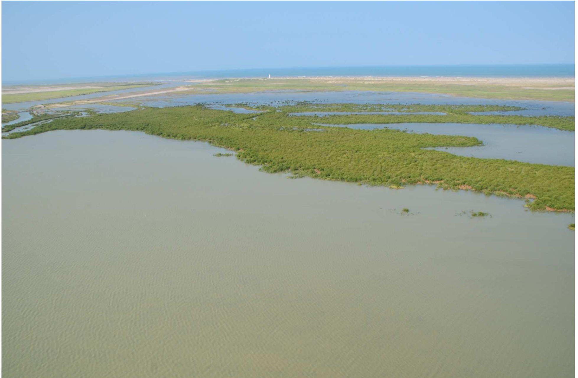
Fig. 2. Manglares del Delta de Río Bravo, Tamaulipas. CONABIO – SEMAR / J. Acosta-Velázquez (2008). Fotografía aérea panorámica.