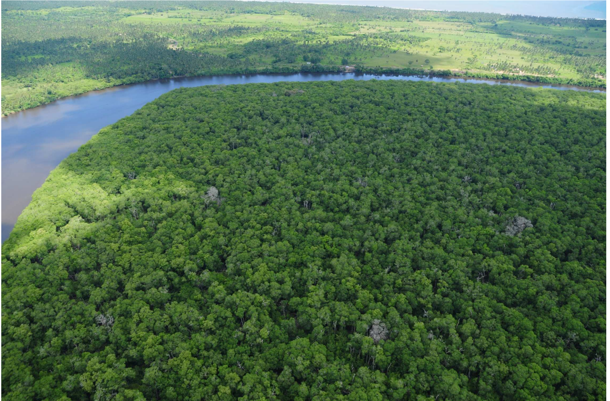
Fig. 1. Manglares del Estero del Río Tonalá – Laguna El Yucateco, Veracruz y Tabasco. Fotografía aérea panorámica.