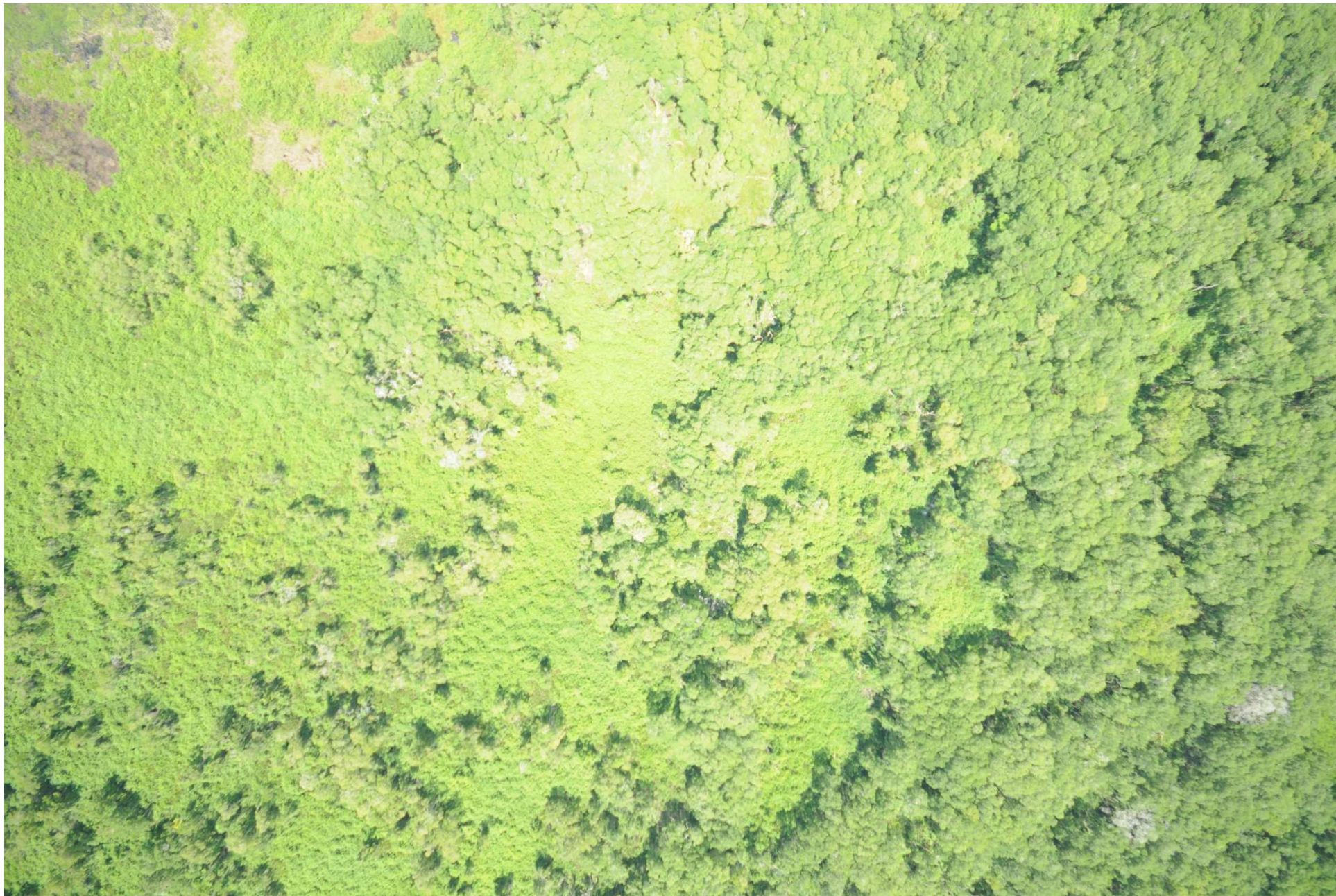
Fig. 5. Manglares del Estero del Río Tonalá – Laguna el Yucateco, Veracruz y Tabasco. CONABIO – SEMAR / J. Díaz (2008). Fotografía aérea vertical.