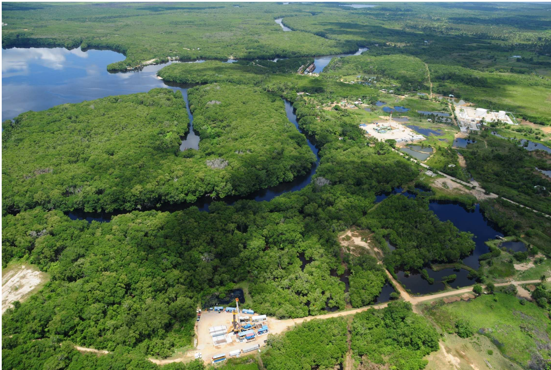
Fig. 4. Manglares del Estero del Río Tonalá – Laguna El Yucateco, Veracruz y Tabasco. CONABIO – SEMAR / J. Acosta-Velázquez (2008). Fotografía aérea panorámica.