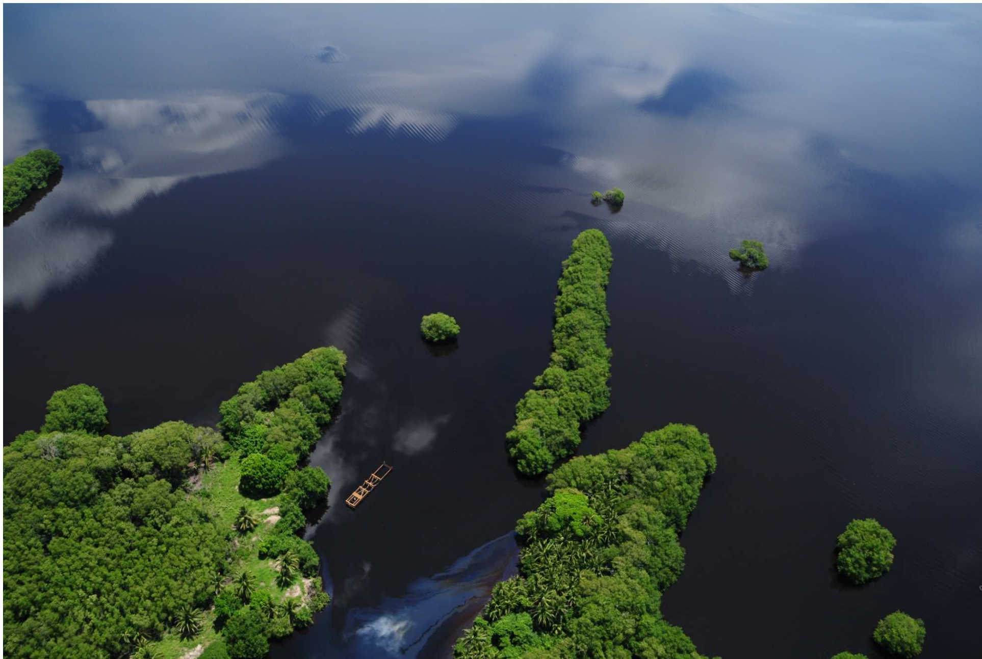
Fig. 3. Manglares del Estero del Río Tonalá – Laguna El Yucateco, Veracruz y Tabasco. Fotografía aérea panorámica.