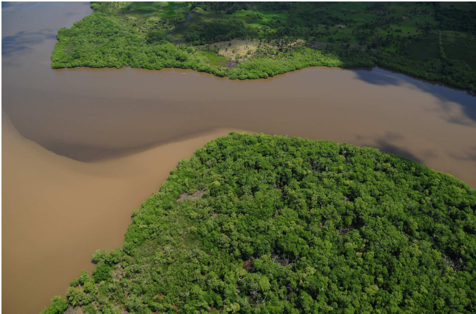
Fig. 2. Manglares del Estero del Rio Tonalá - Laguna El Yucateco, Veracruz y Tabasco. CONABIO – SEMAR / J. Acosta-Velázquez (2008). Fotografía aérea panorámica.