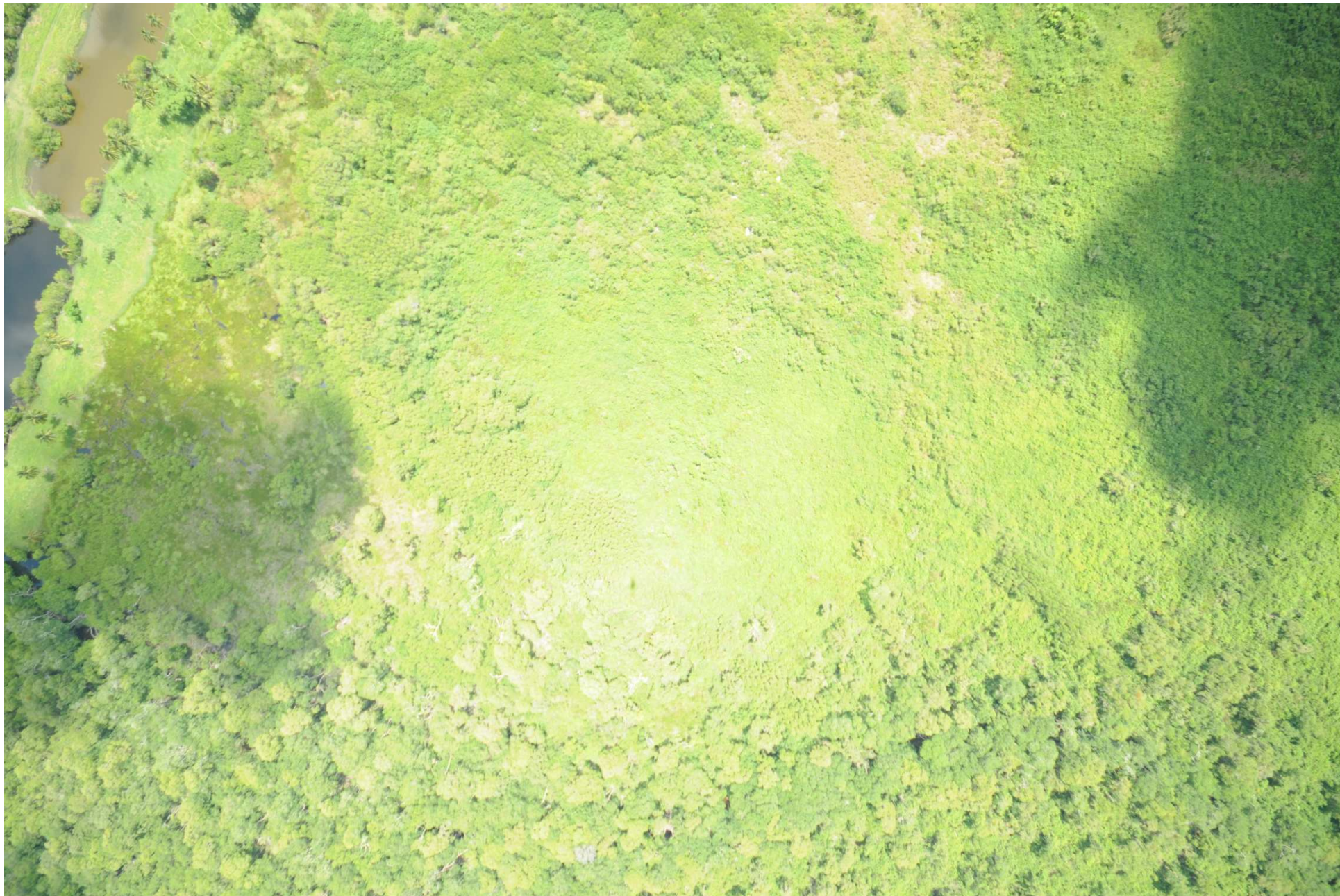
Fig. 6. Manglares del Estero del Río Tonalá – Laguna El Yucateco, Veracruz y Tabasco. CONABIO – SEMAR / J. Díaz (2008). Fotografía aérea vertical.