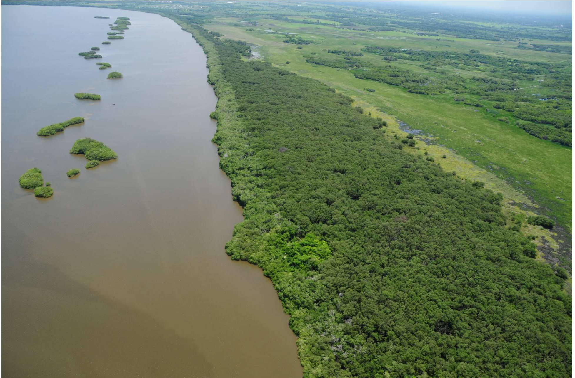
Fig. 3. Manglares de Mandinga, Veracruz. Fotografía aérea panorámica.