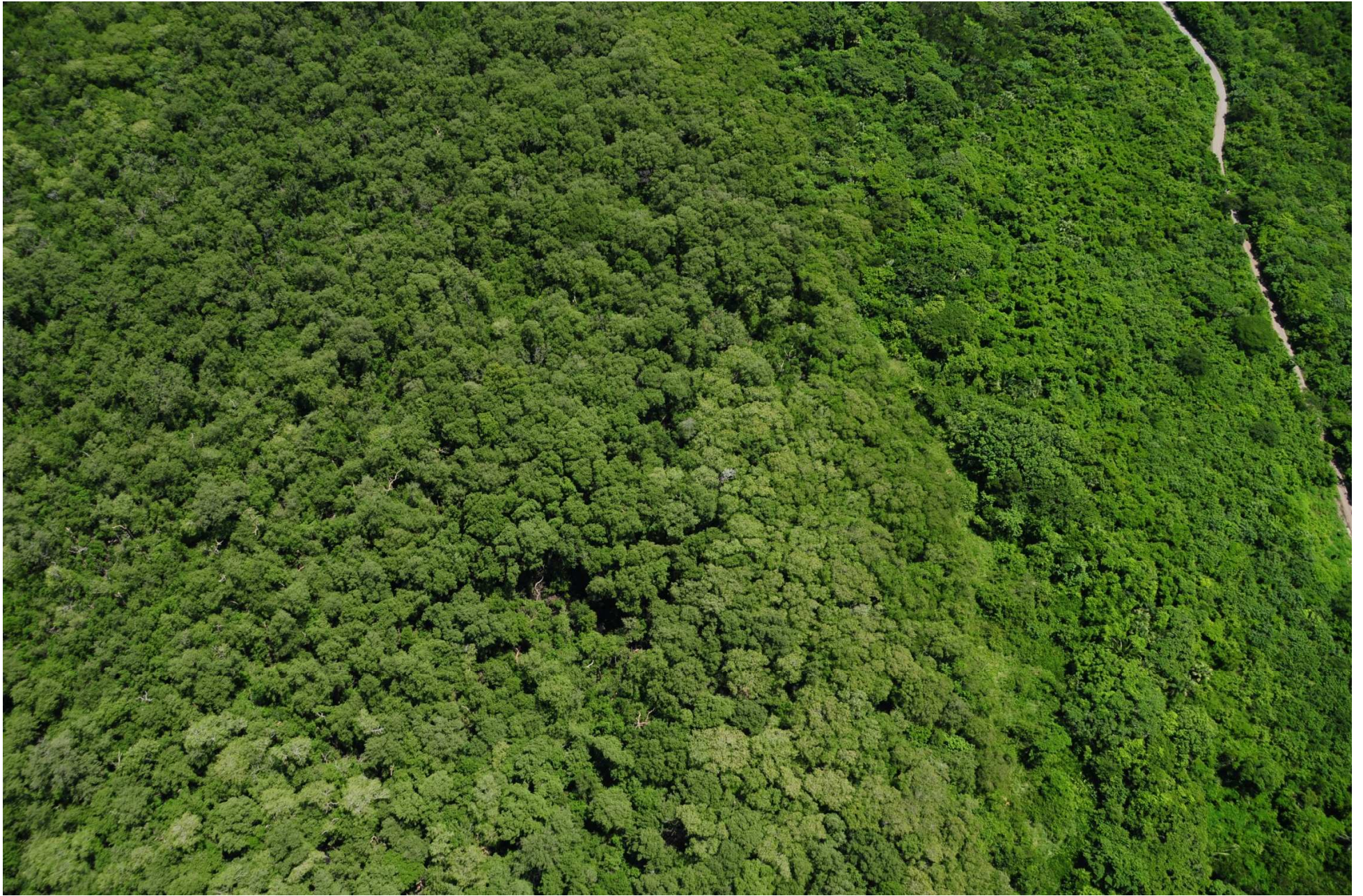
Fig. 2. Manglares de Mandinga, Veracruz. CONABIO – SEMAR / J. Acosta-Velázquez (2008). Fotografía aérea panorámica.