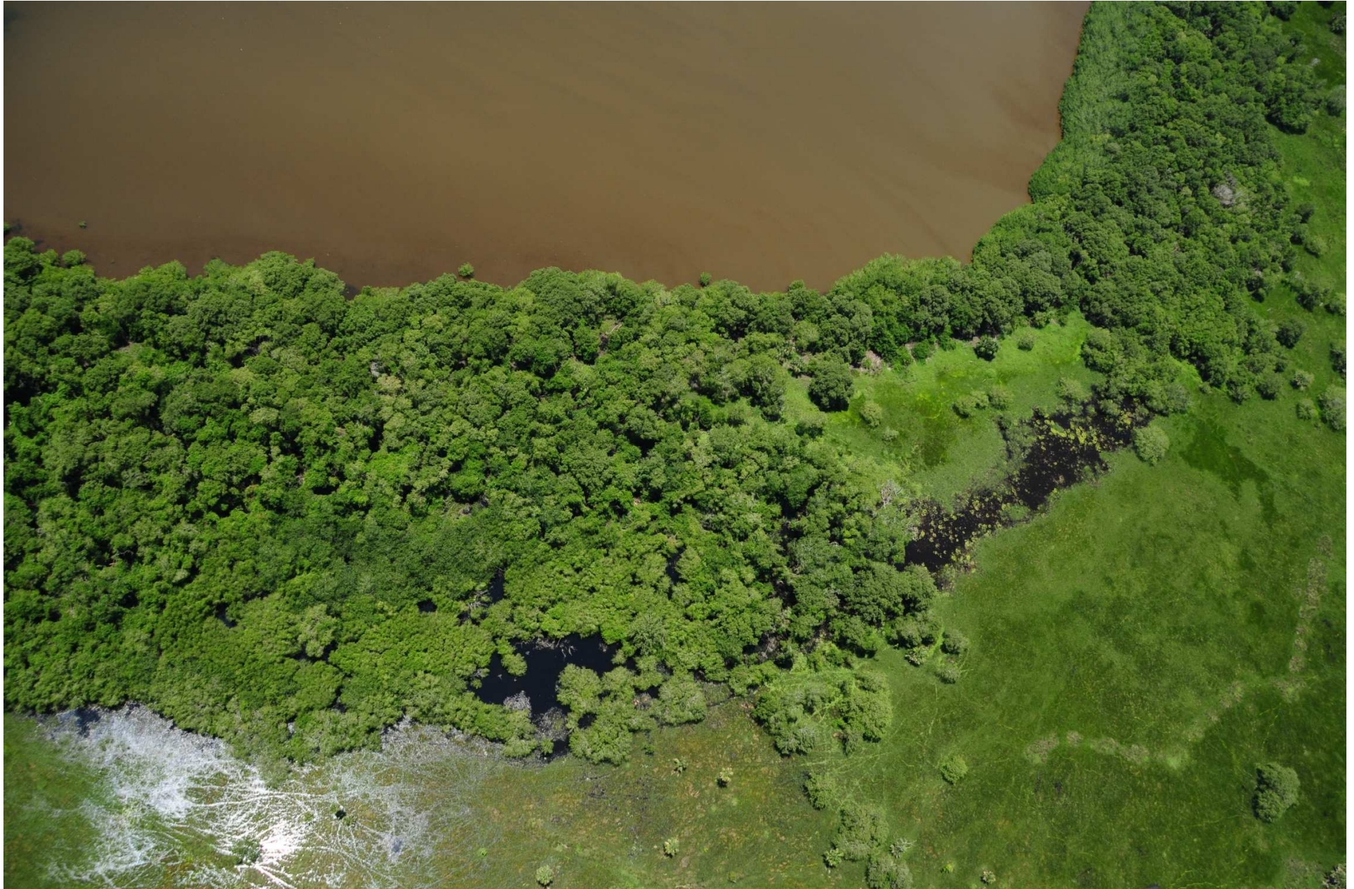
Fig. 1. Manglares de Mandinga, Veracruz. CONABIO – SEMAR / J. Acosta-Velázquez (2008). Fotografía aérea panorámica.