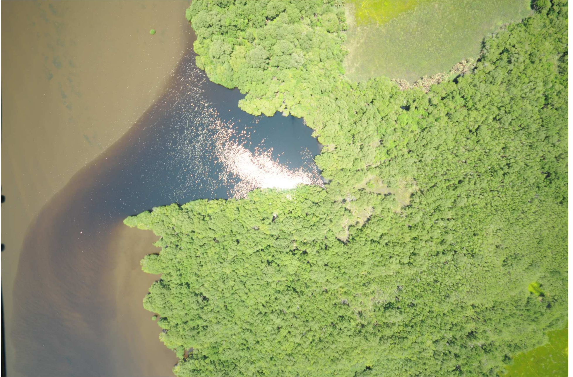
Fig. 5. Manglares de Mandinga, Veracruz. CONABIO – SEMAR / J. Díaz (2008). Fotografía aérea vertical.