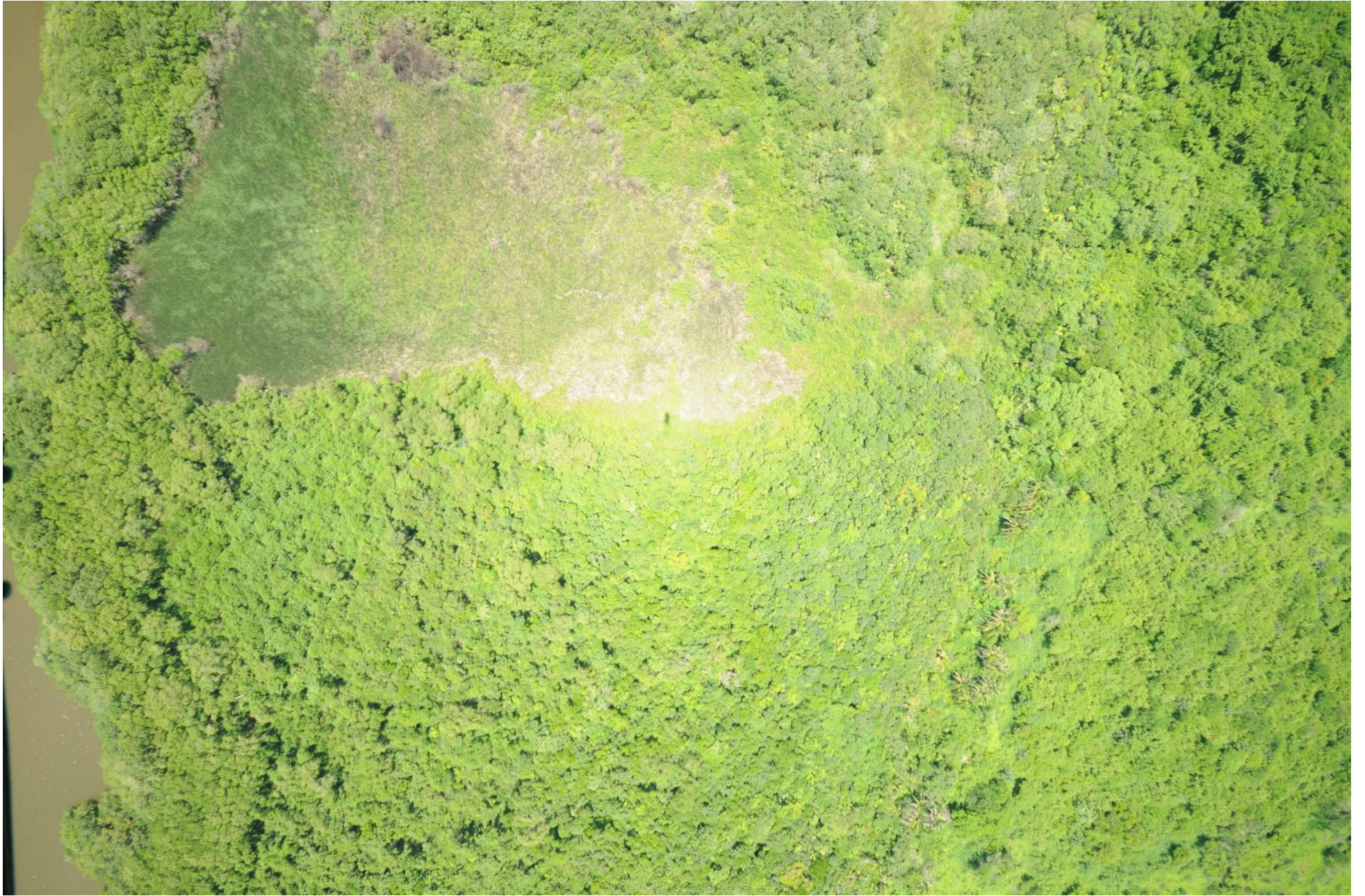
Fig. 6. Manglares de Mandinga, Veracruz. CONABIO – SEMAR / J. Díaz (2008). Fotografía aérea vertical.