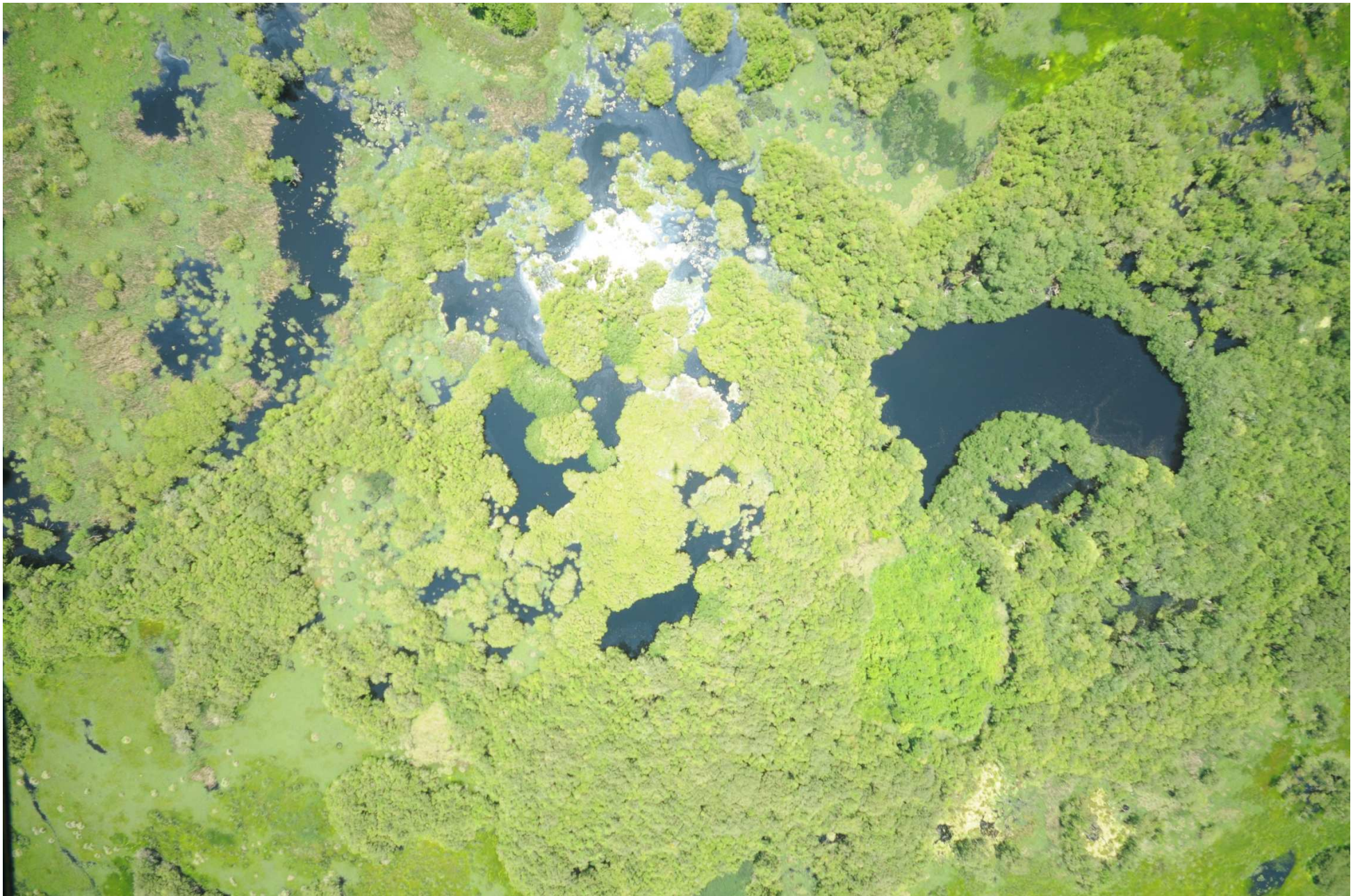
Fig. 7. Manglares de Mandinga, Veracruz. Fotografía aérea vertical.