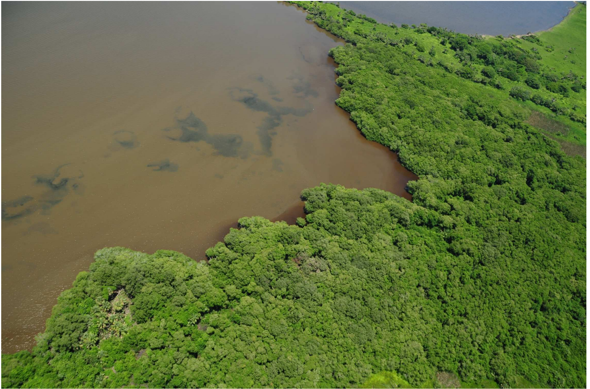
Fig. 4. Manglares de Mandinga, Veracruz. Fotografía aérea panorámica.