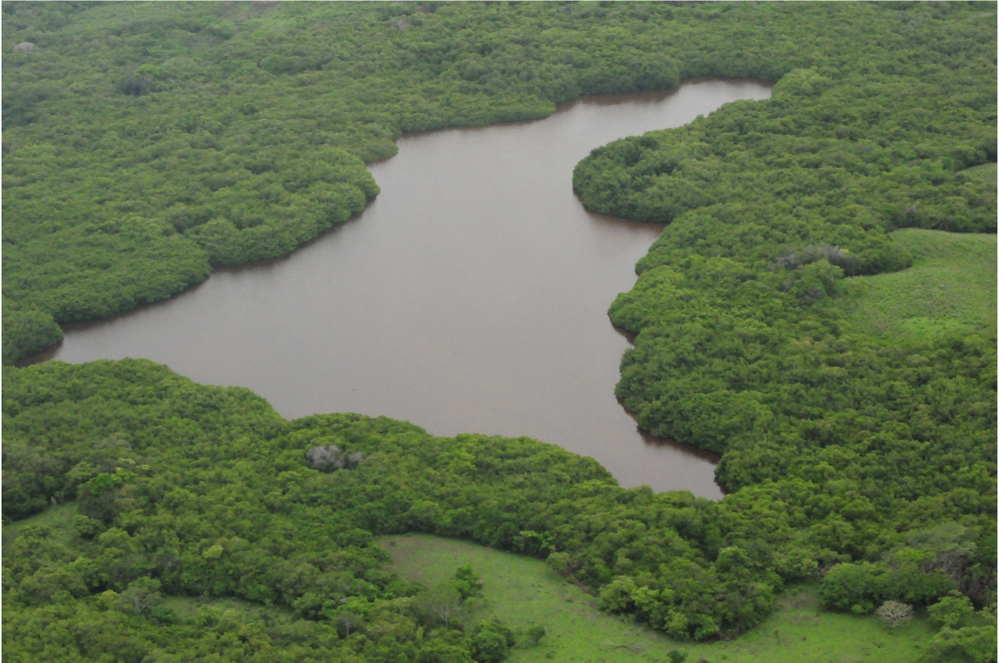
Fig. 2. Manglares de la Laguna El Caimán, Michoacán. Fotografía aérea panorámica.