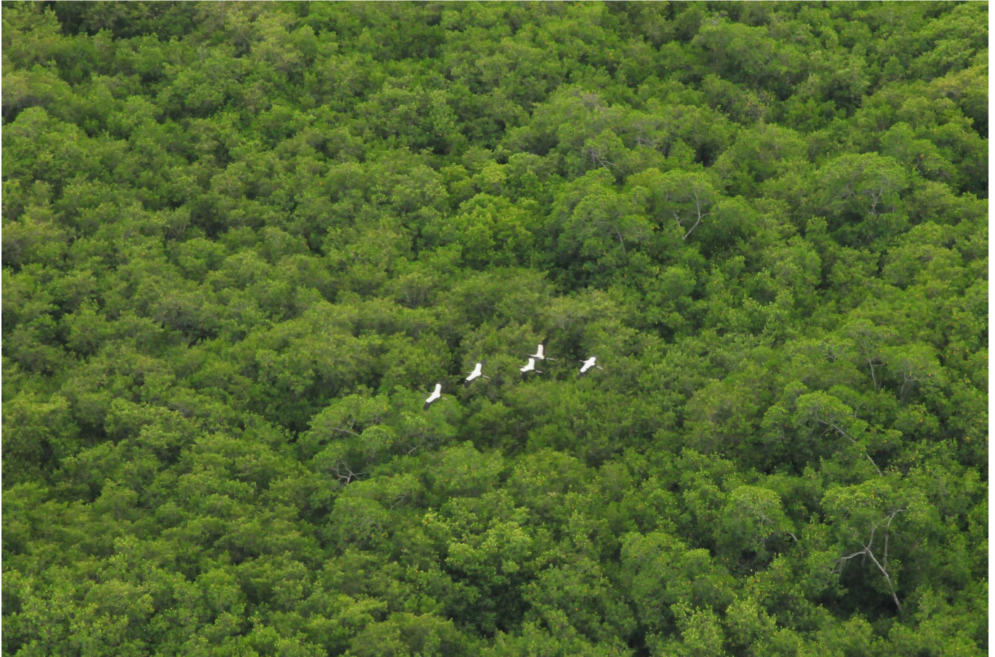
Fig. 4. Manglares de la Laguna El Caimán, Michoacán. CONABIO – SEMAR / J. Acosta-Velázquez (2008). Fotografía aérea panorámica.