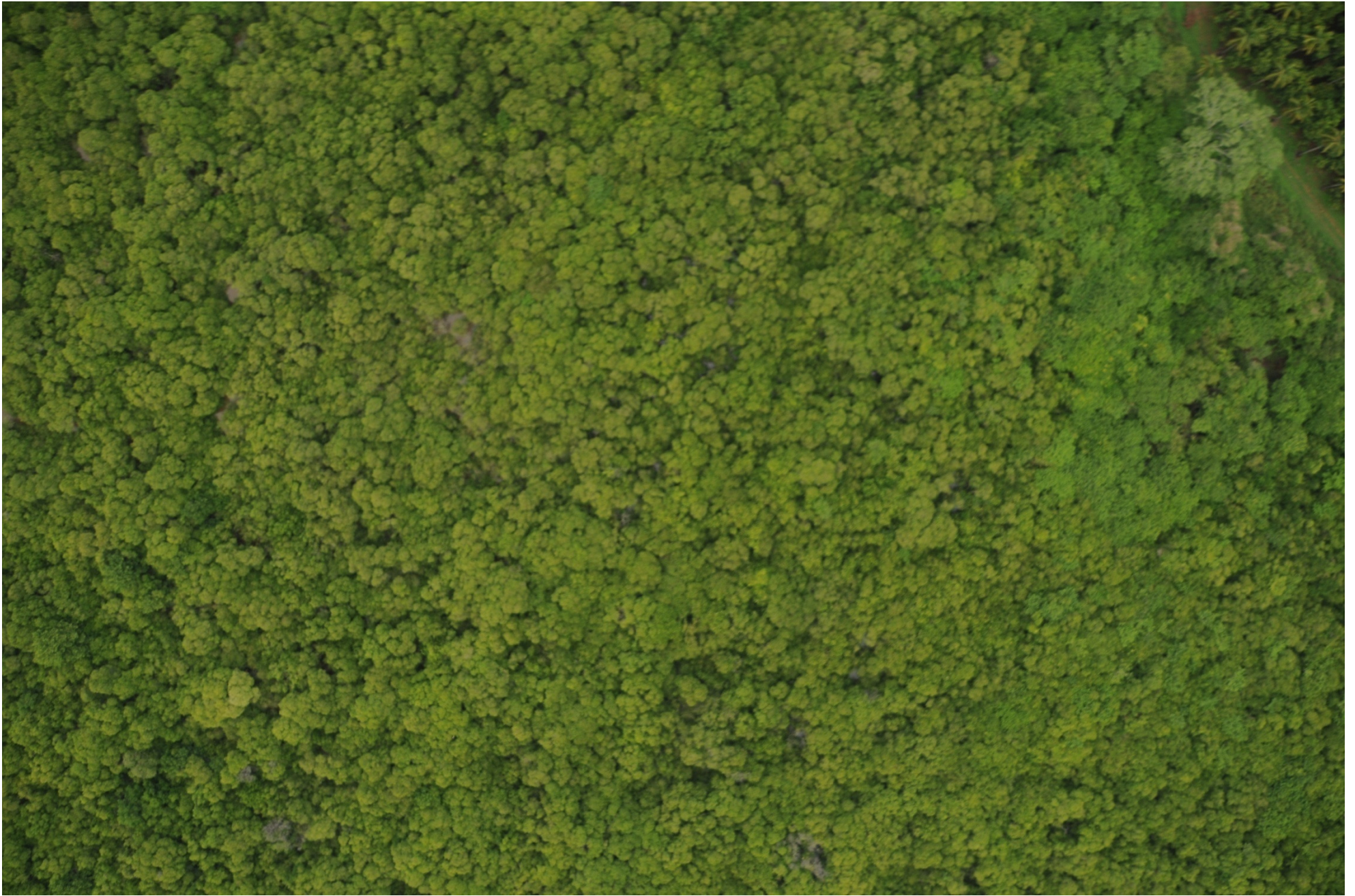
Fig. 7. Manglares de Laguna El Caimán, Michoacán. CONABIO – SEMAR / J. Díaz (2008). Fotografía aérea vertical.