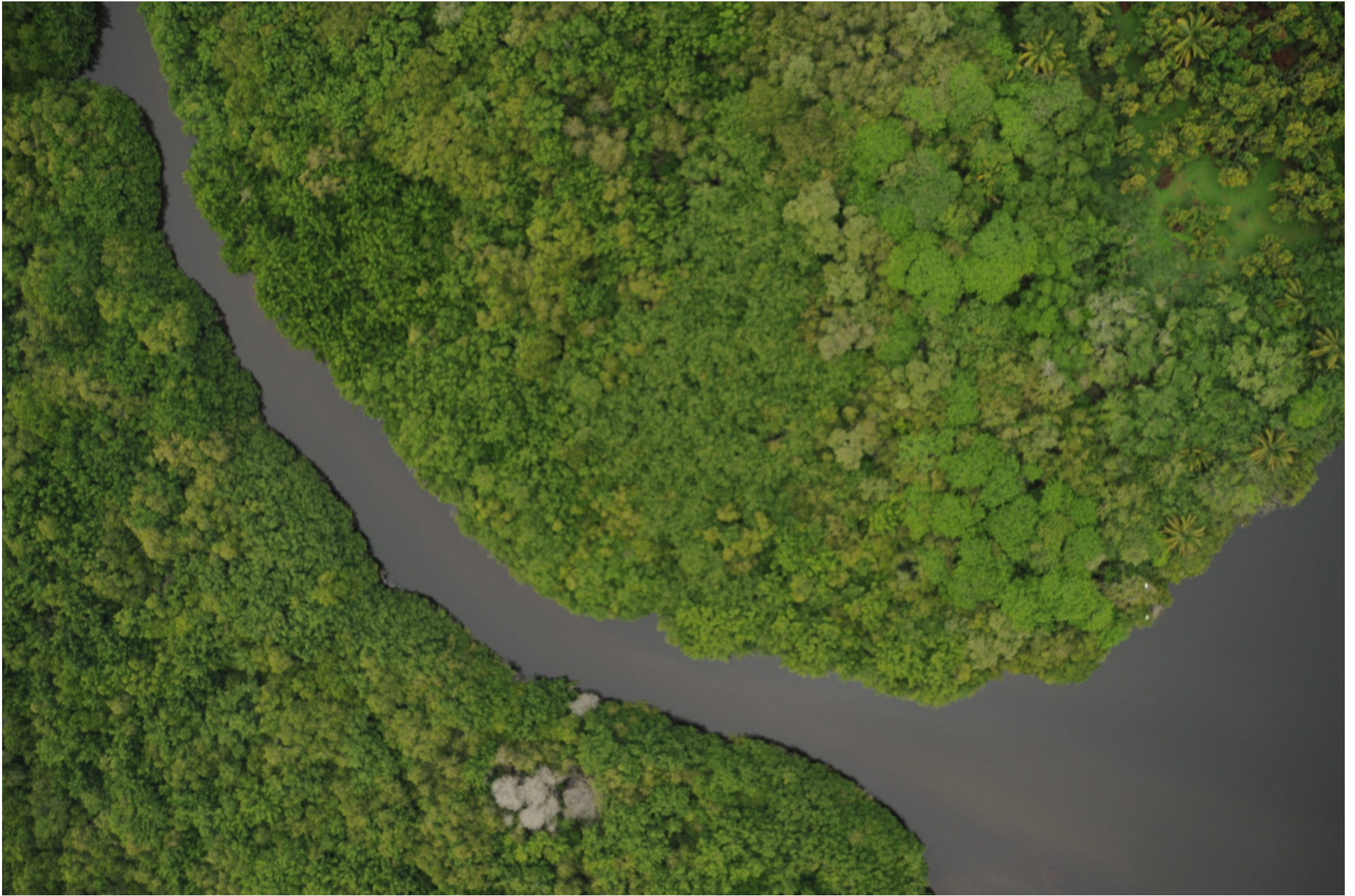
Fig. 8. Manglares de Laguna El Caimán, Michoacán. Fotografía aérea vertical.