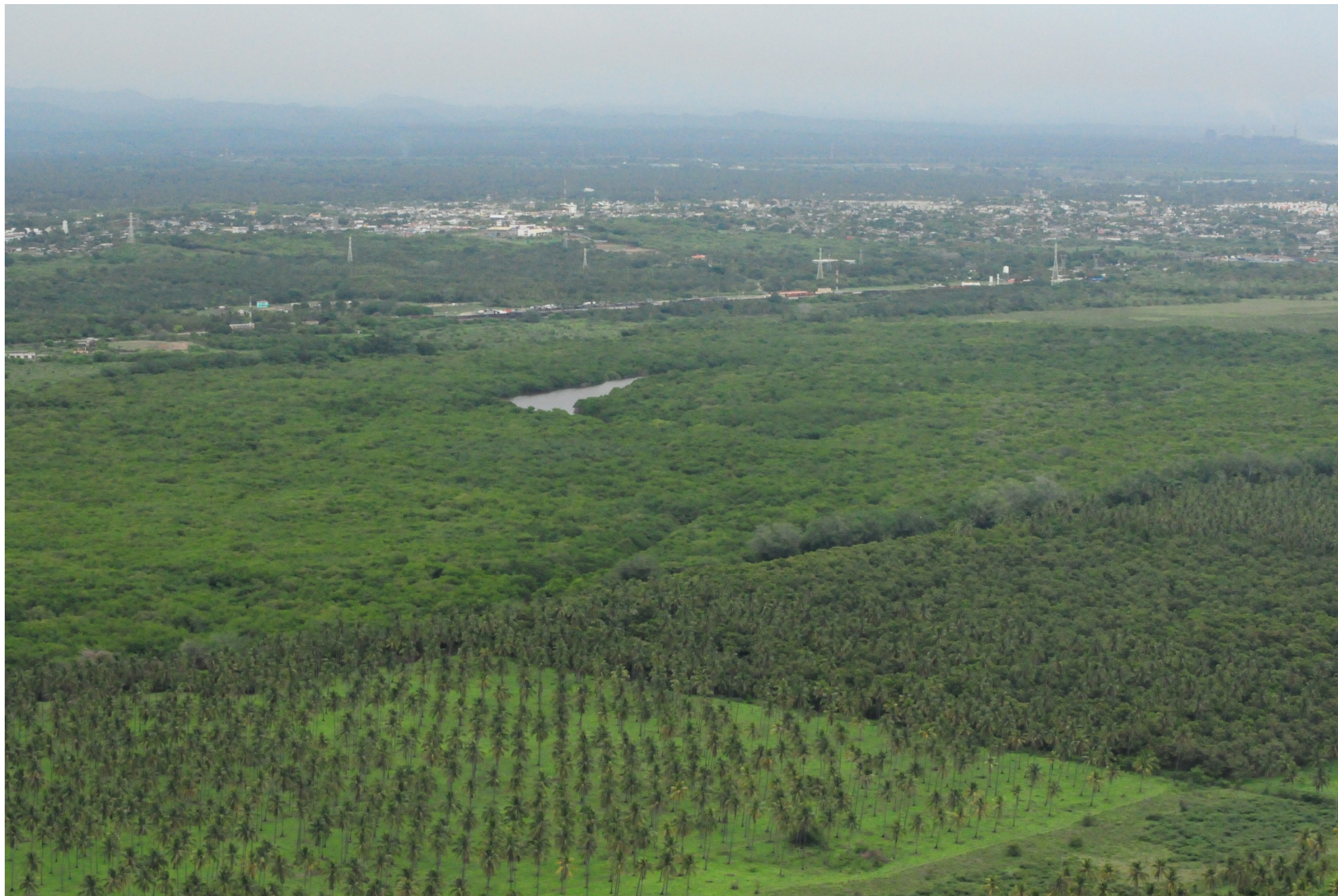
Fig. 1. Vista panorámica de cocoteros, manglares y la ciudad de Lázaro Cárdenas, Laguna El Caimán, Michoacán. Fotografía aérea panorámica.