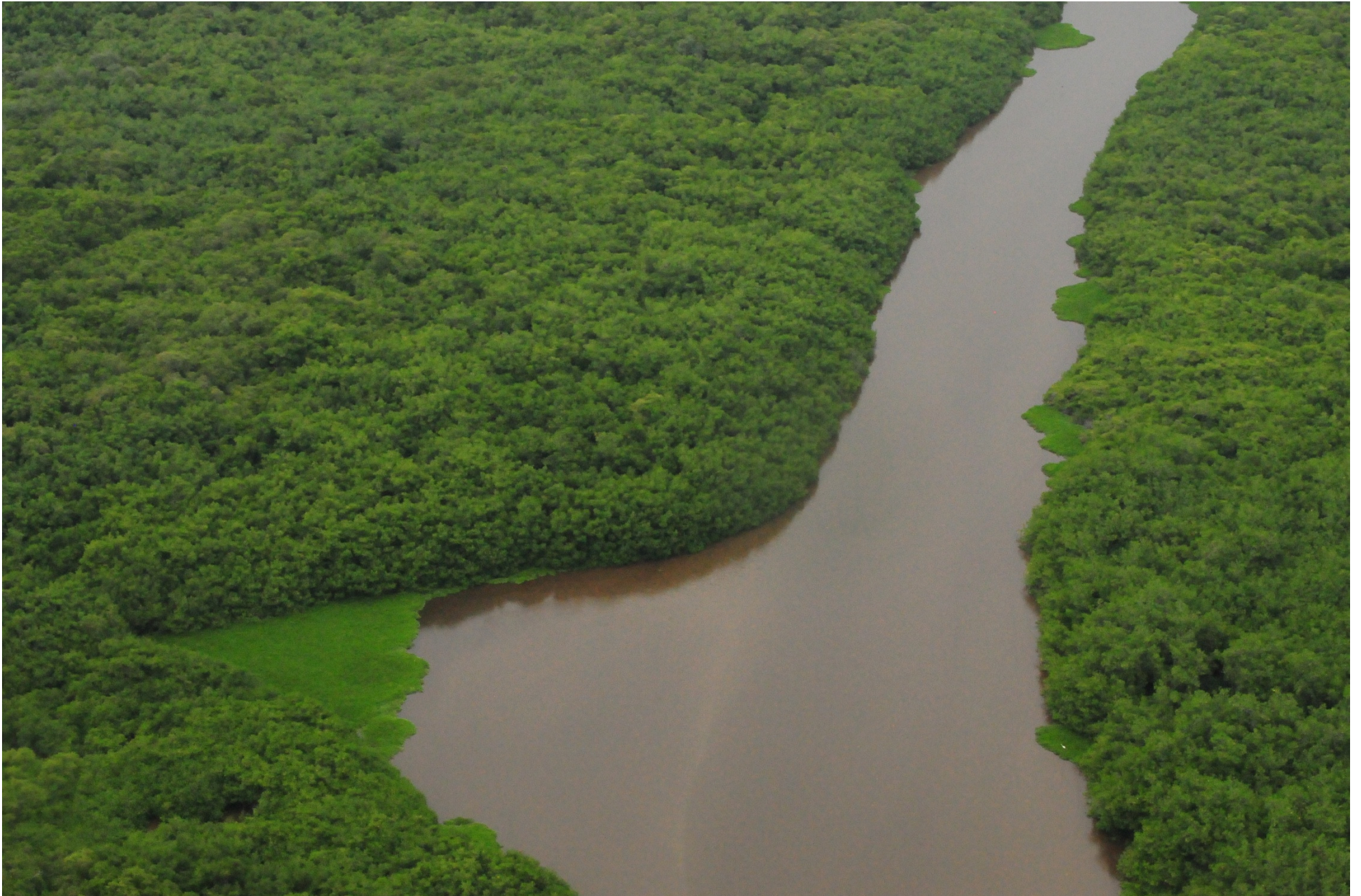
Fig. 3. Manglares de la Laguna El Caimán, Michoacán. CONABIO – SEMAR / J. Acosta-Velázquez (2008). Fotografía aérea panorámica.