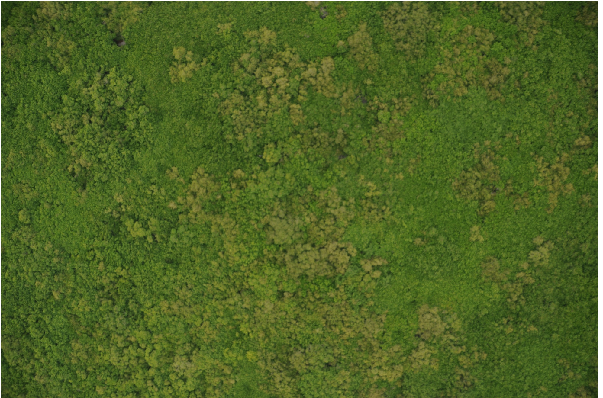
Fig. 5. Manglares de Laguna El Caimán, Michoacán. Fotografía aérea vertical.