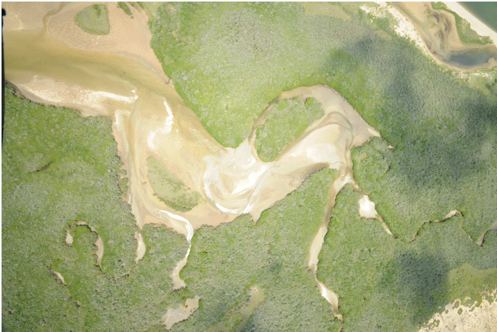
Fig. 5. Manglares de Estero El Sargento-Isla Tiburón, Sonora. Fotografía aérea vertical.