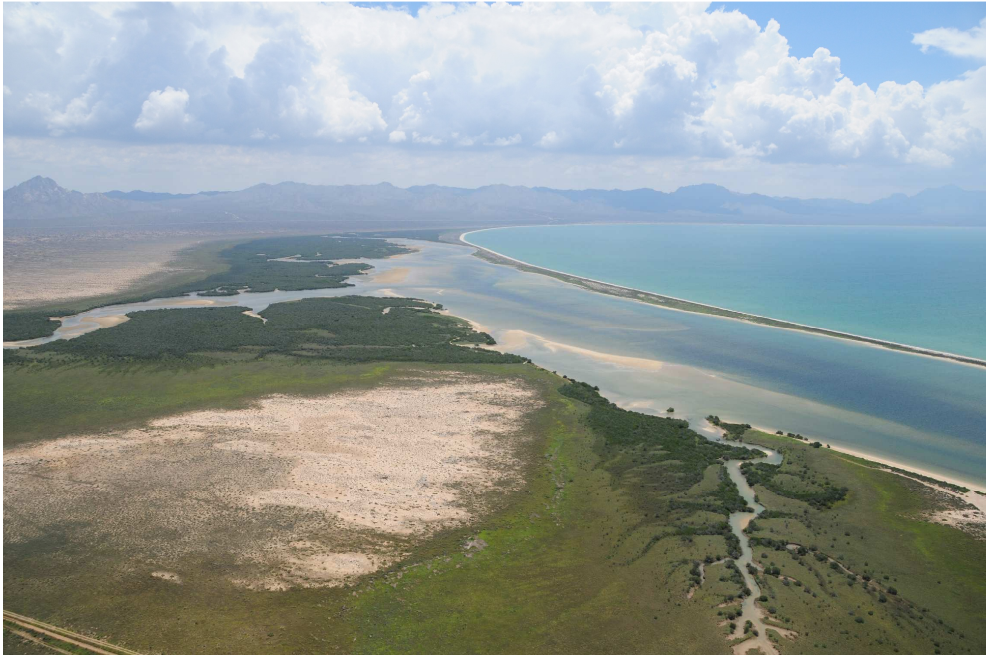
Fig. 2. Manglares de Estero El Sargento-Isla Tiburón, Sonora. CONABIO – SEMAR / J. Acosta-Velázquez (2008). Fotografía aérea panorámica.