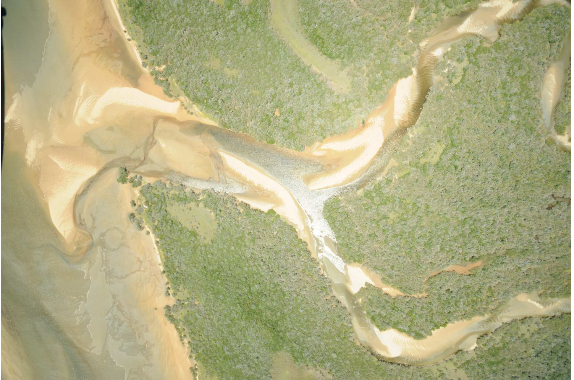
Fig. 8. Manglares de Estero El Sargento-Isla Tiburón, Sonora. Fotografía aérea vertical.