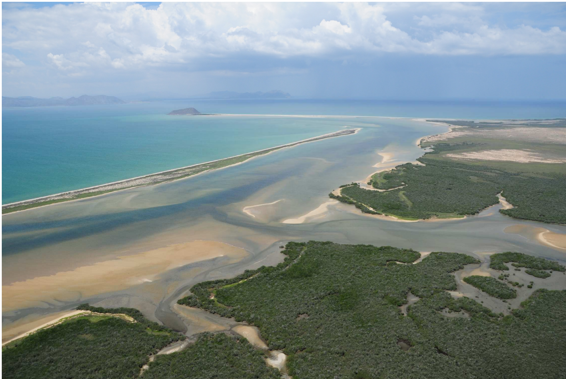
Fig. 3 Manglares de Estero El Sargento-Isla Tiburón, Sonora. Fotografía aérea panorámica.