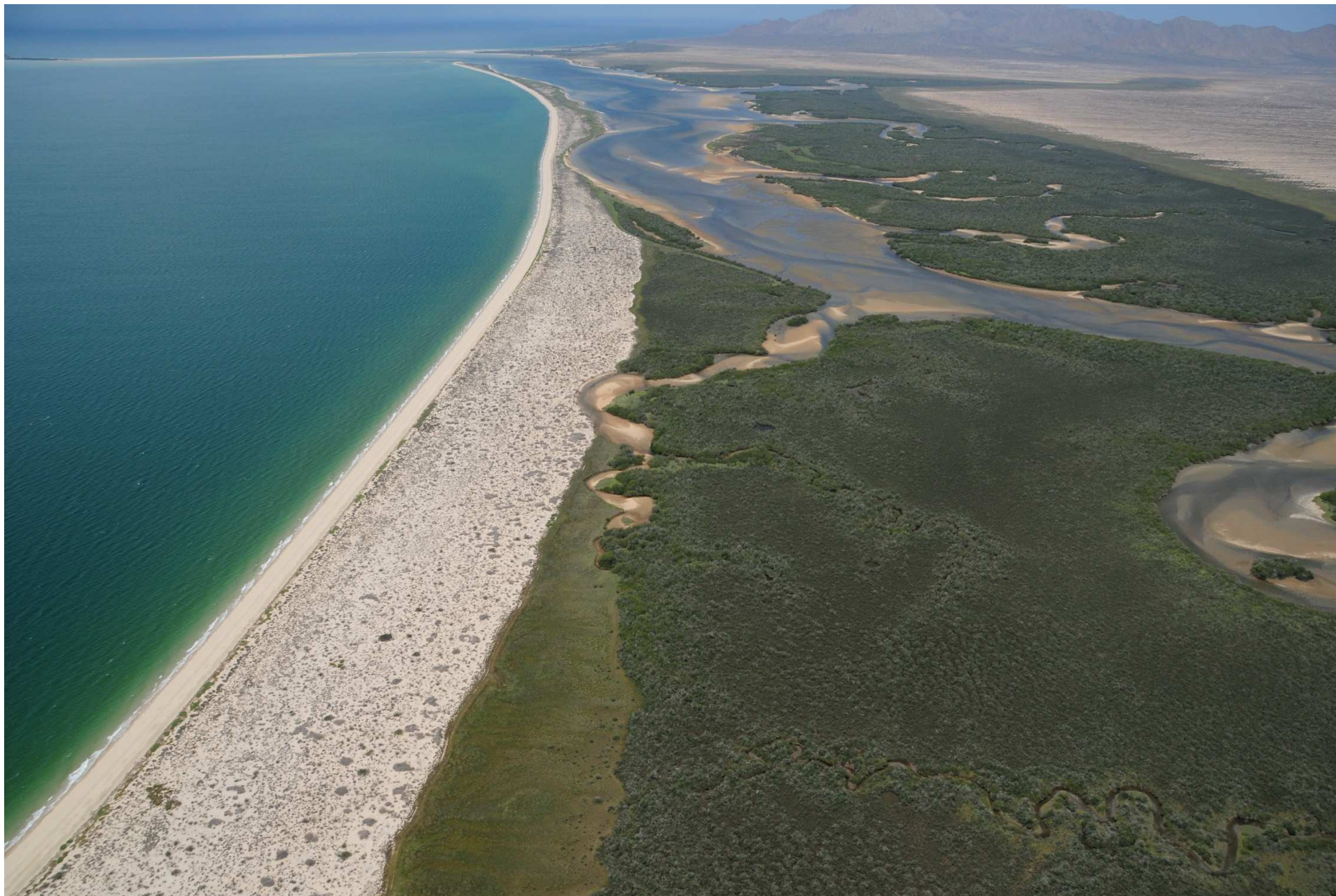
Fig. 4. Manglares de Estero El Sargento-Isla Tiburón, Sonora. Fotografía aérea panorámica.