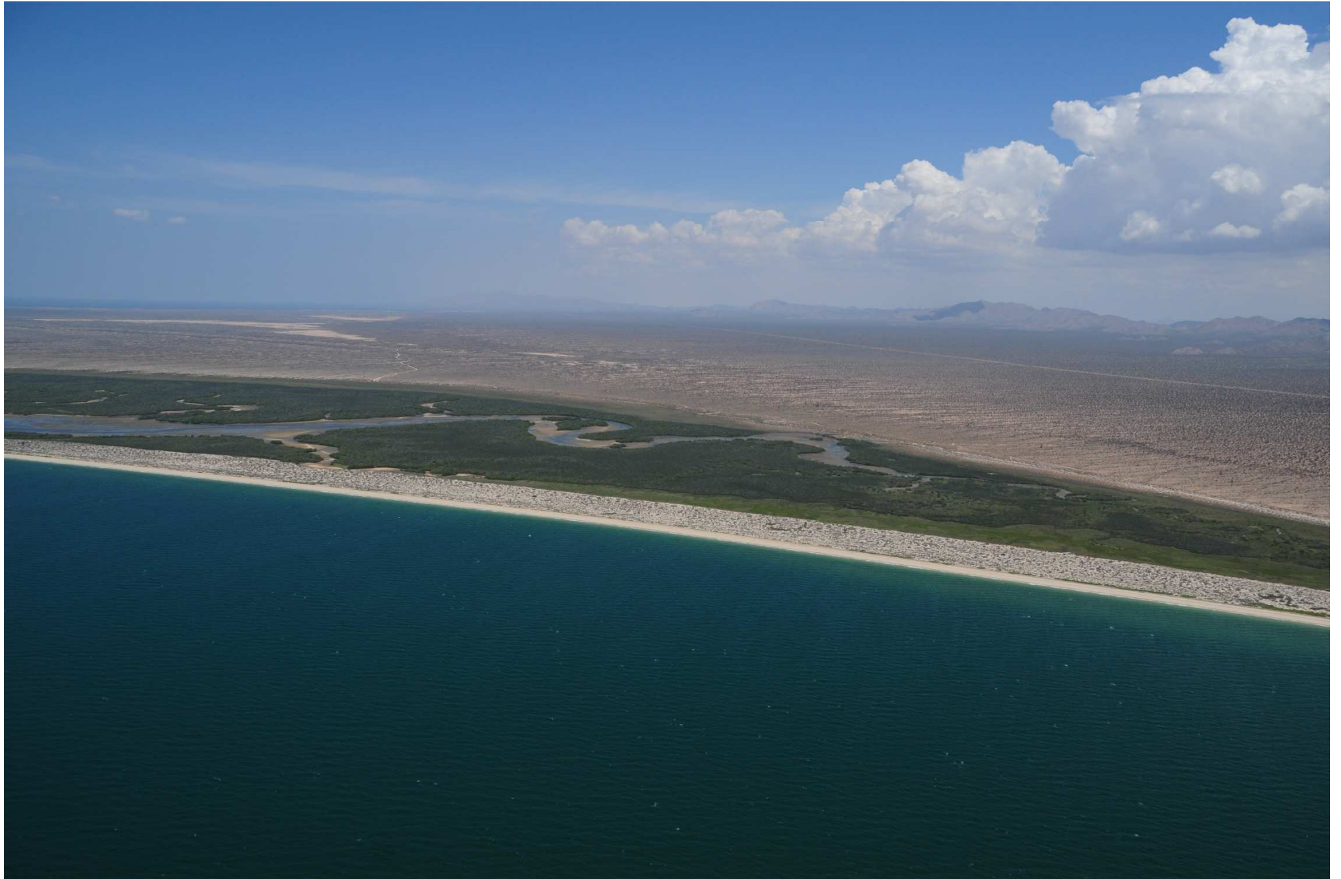
Fig. 1. Manglares de Estero El Sargento-Isla Tiburón, Sonora. Fotografía aérea panorámica.