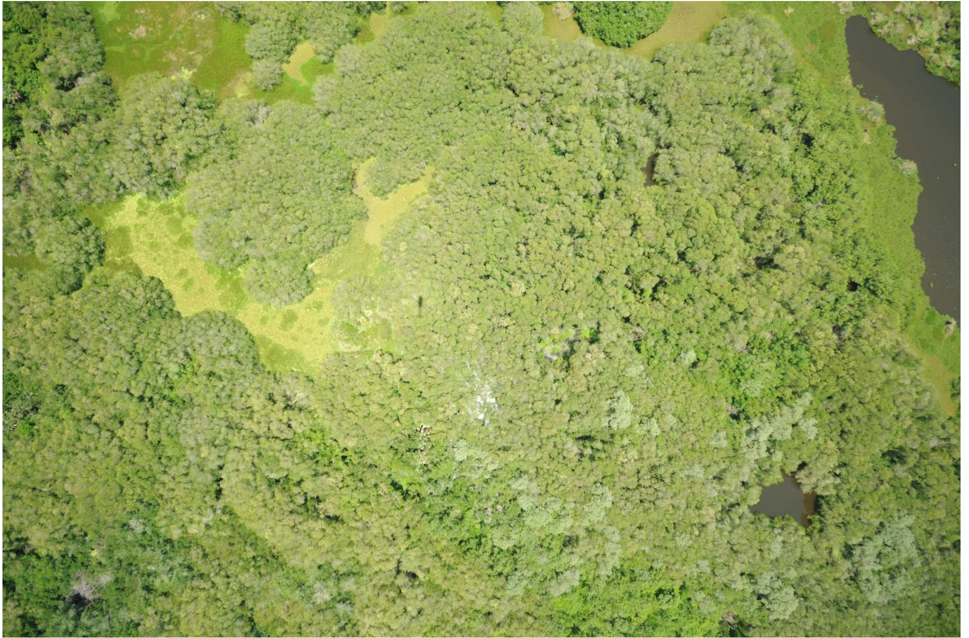
Fig. 7. Manglares de Coyuca – Mitla, Guerrero. CONABIO – SEMAR / J. Díaz (2008). Fotografía aérea vertical.