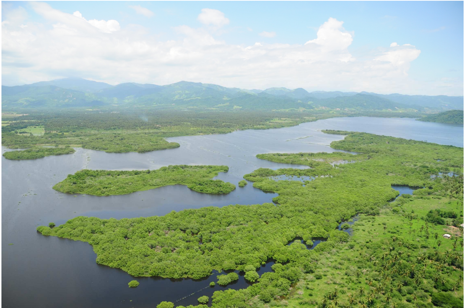
Fig. 1. Manglares de Coyuca – Mitla, Guerrero. CONABIO – SEMAR / J. Acosta-Velázquez (2008). Fotografía aérea panorámica.