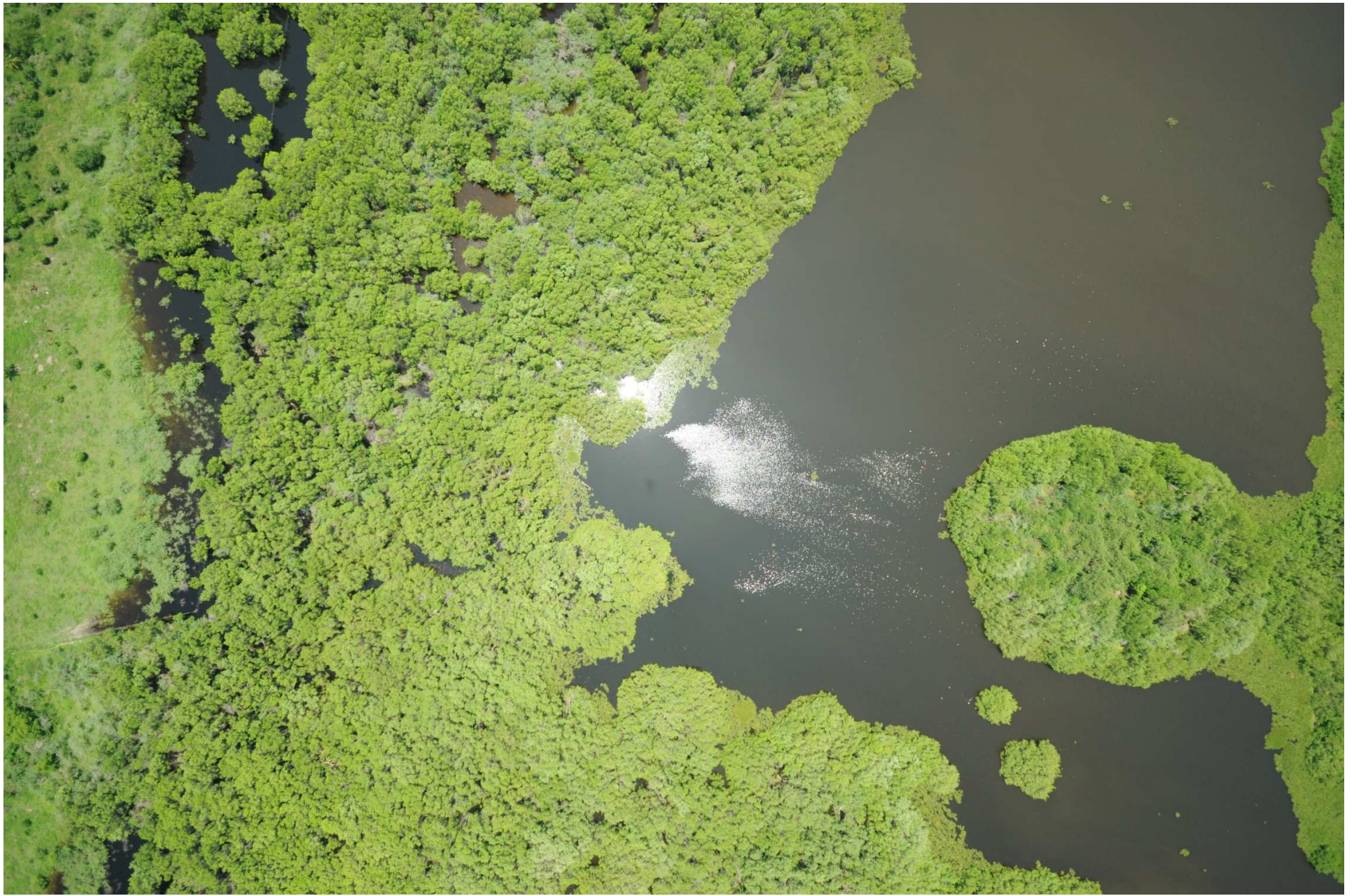
Fig. 8. Manglares de Coyuca – Mitla, Guerrero. Fotografía aérea vertical.