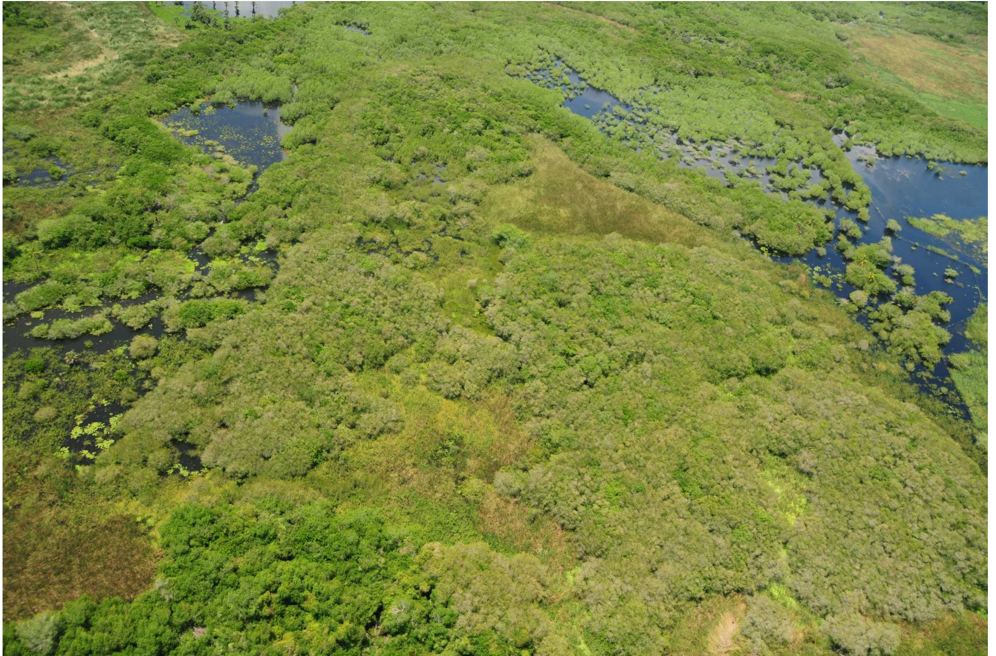
Fig. 4. Manglares de Coyuca – Mitla, Guerrero. Fotografía aérea panorámica.