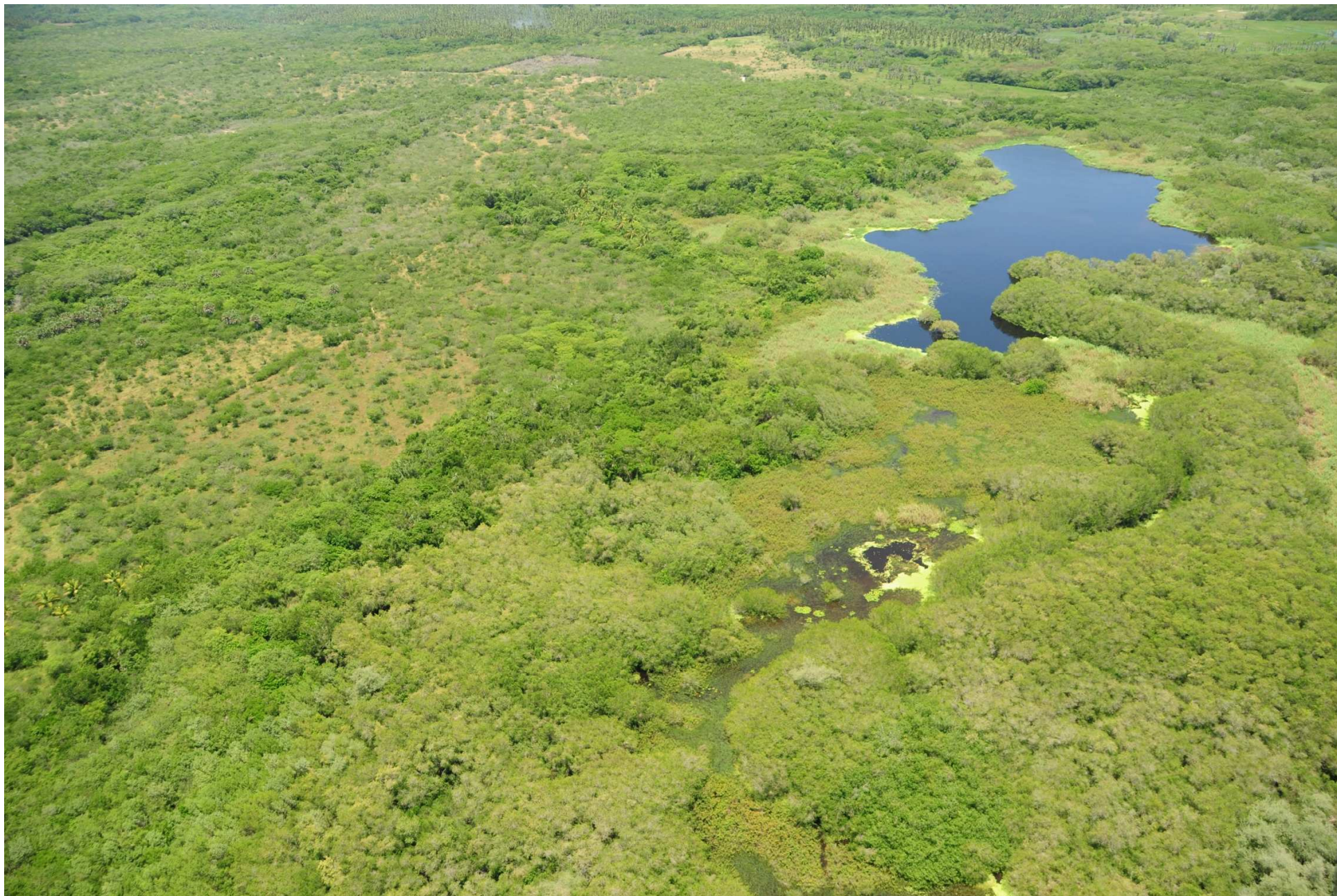
Fig. 2. Manglares de Coyuca – Mitla, Guerrero. Fotografía aérea panorámica.