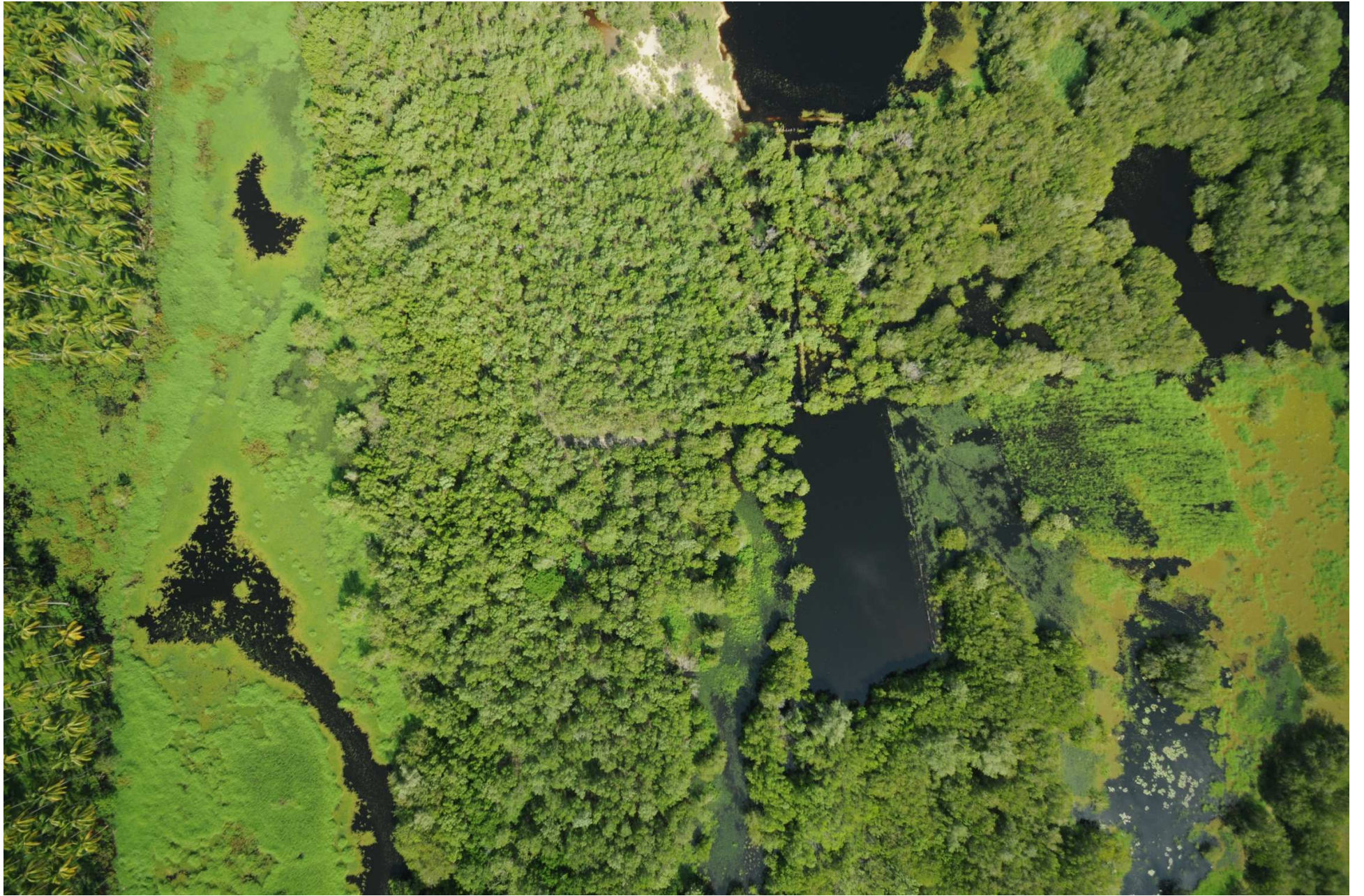
Fig. 5. Manglares de Coyuca – Mitla, Guerrero. CONABIO – SEMAR / J. Díaz (2008). Fotografía aérea vertical.