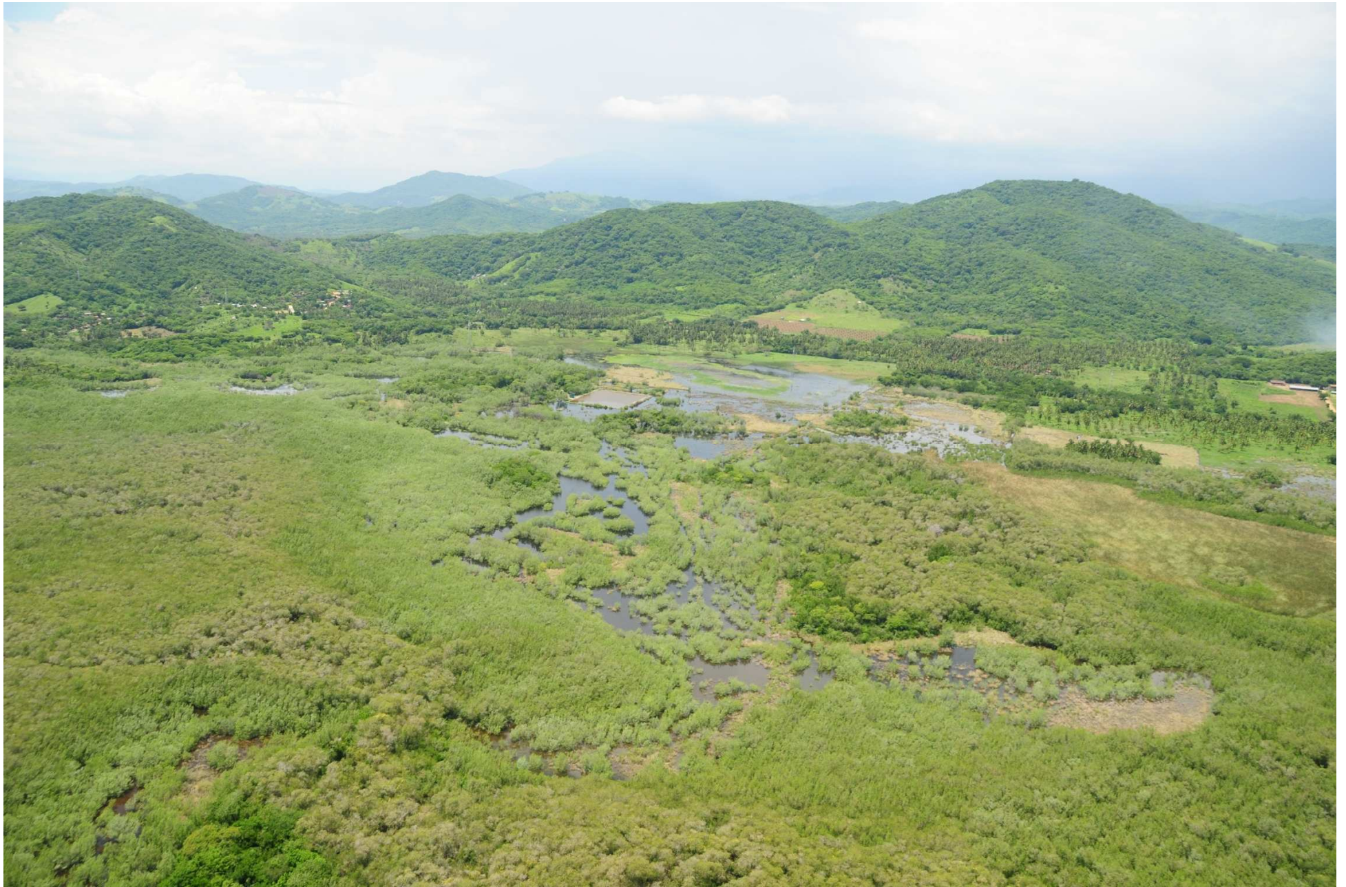
Fig. 3. Manglares de Manglares de Coyuca – Mitla, Guerrero. (2008). Fotografía aérea panorámica.