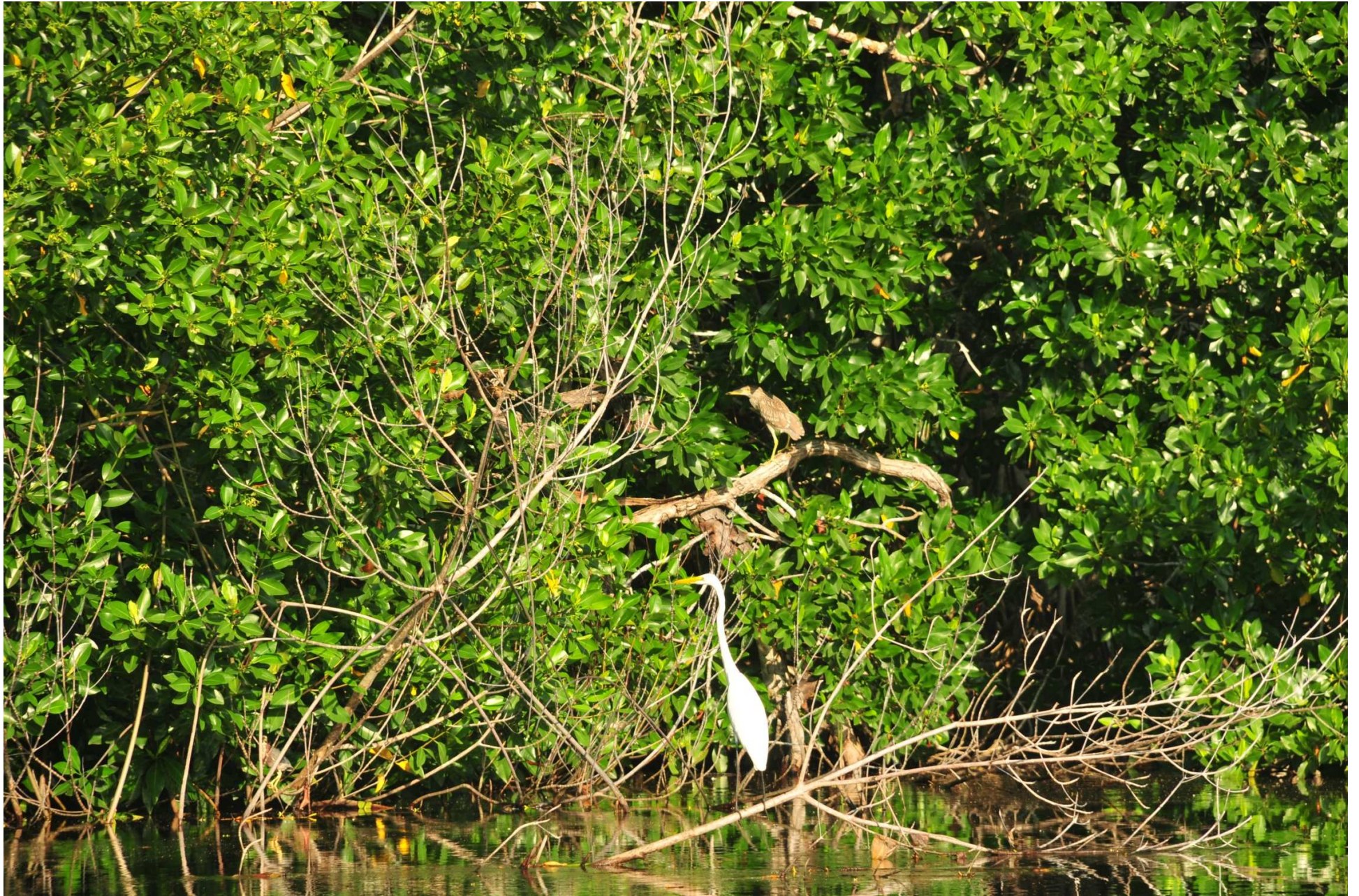
Fig. 9. Manglares de La Encrucijada, Chiapas.