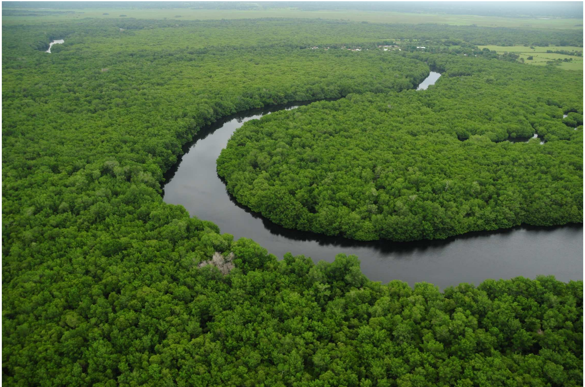
Fig. 1. Manglares de La Encrucijada, Chiapas. Fotografía aérea panorámica.