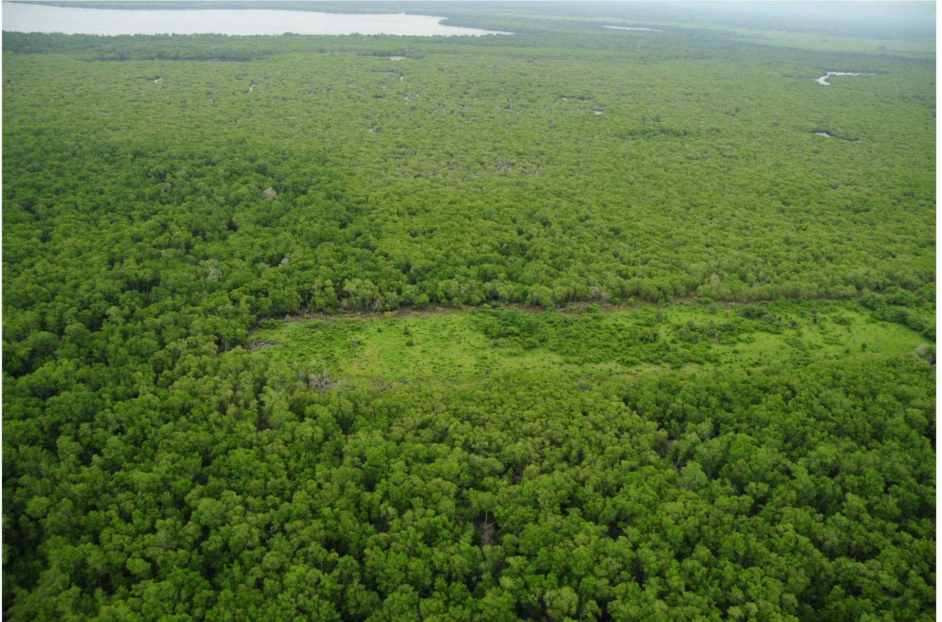
Fig. 2. Manglares de La Encrucijada, Chiapas. CONABIO – SEMAR / J. Acosta-Velázquez (2008). Fotografía aérea panorámica.