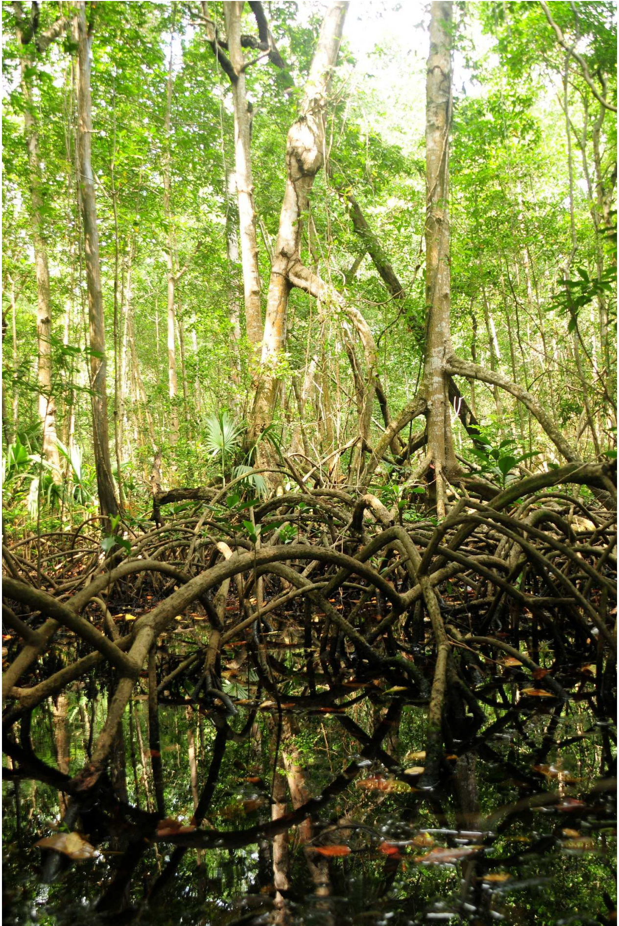
Fig. 10. Manglares de La Encrucijada, Chiapas.