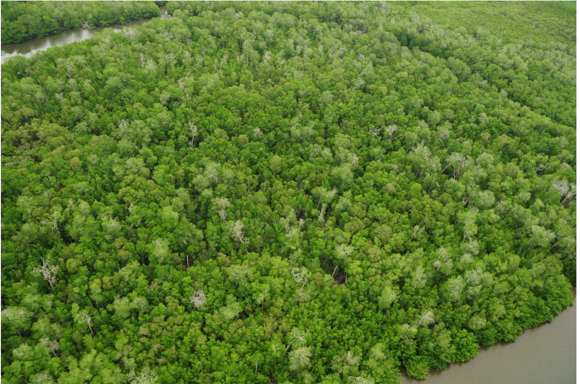
Fig. 4. Manglares de La Encrucijada, Chiapas. Fotografía aérea panorámica.