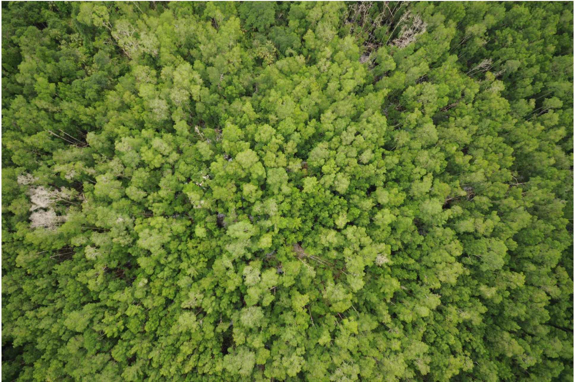
Fig. 8. Manglares de La Encrucijada, Chiapas. CONABIO – SEMAR / J. Díaz (2008). Fotografía aérea vertical.