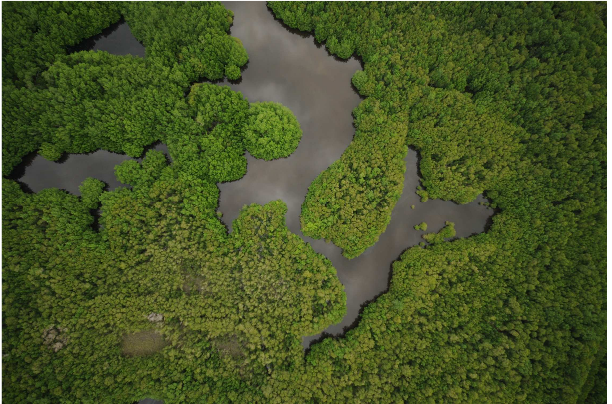
Fig. 7. Manglares de La Encrucijada, Chiapas. Fotografía aérea vertical.