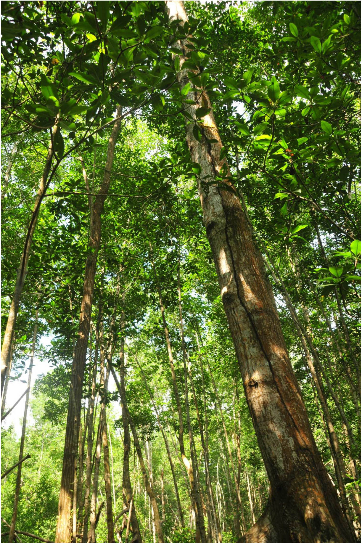
Fig. 11. Manglares de La Encrucijada, Chiapas.