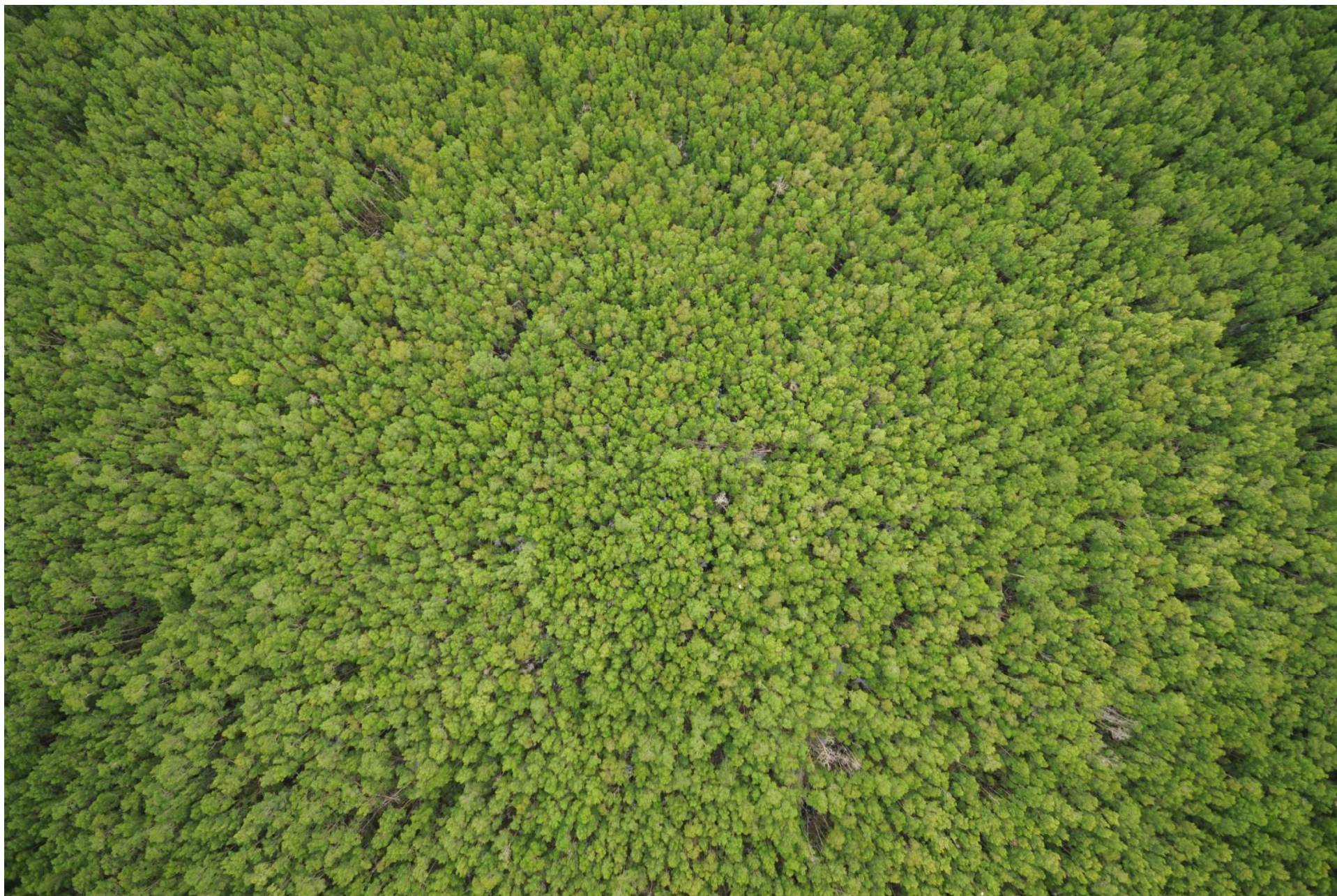
Fig. 5. Manglares de La Encrucijada, Chiapas. CONABIO – SEMAR / J. Díaz (2008). Fotografía aérea vertical.