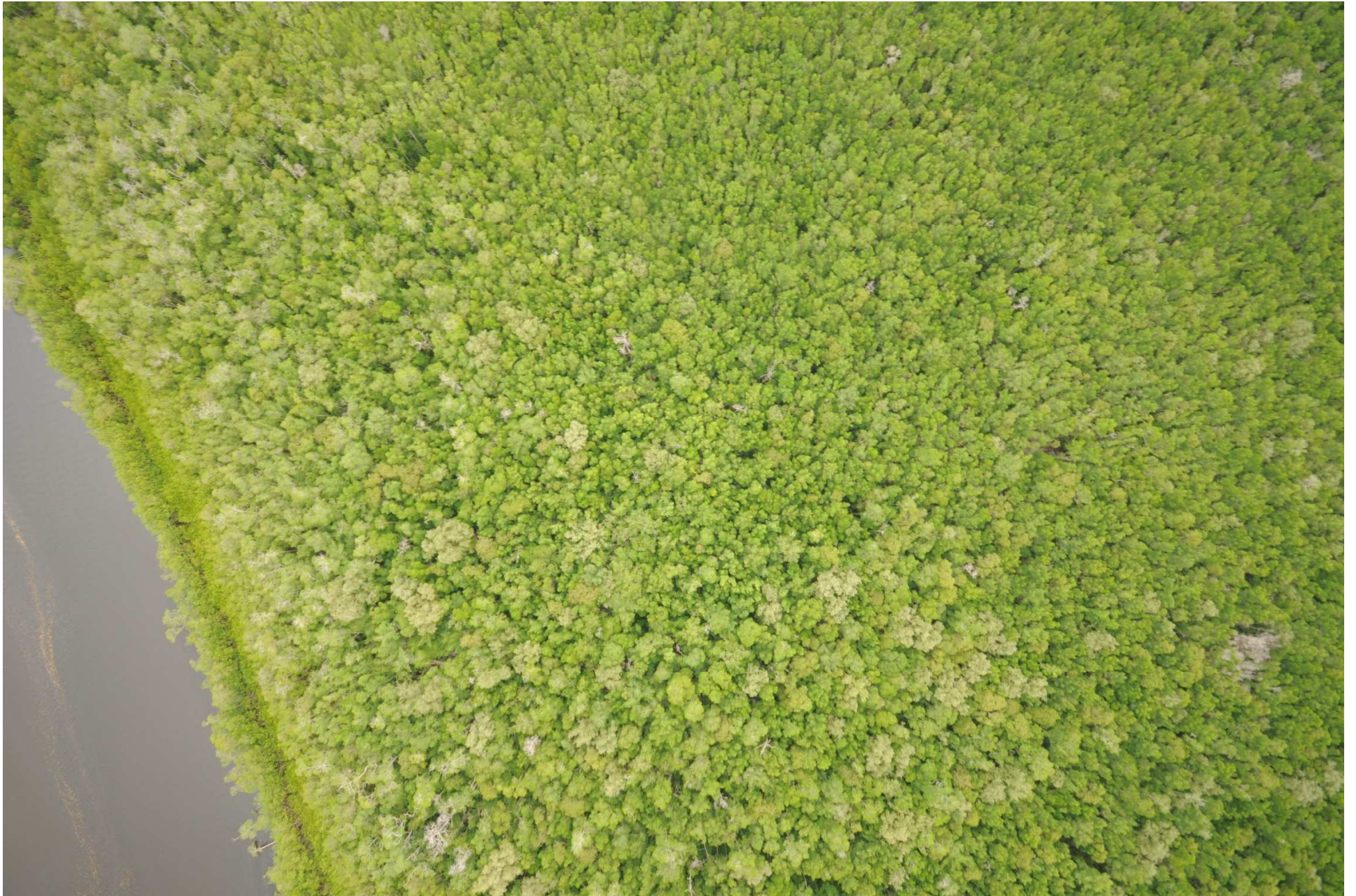
Fig. 6. Manglares de La Encrucijada, Chiapas. Fotografía aérea vertical.