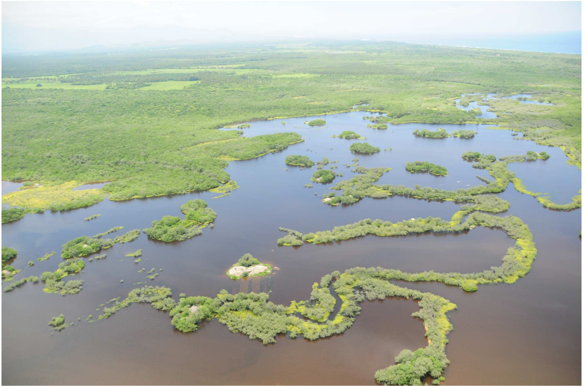
Fig. 4. Manglares de Laguna El Potosí, Guerrero. CONABIO – SEMAR / J. Acosta-Velázquez (2008). Fotografía aérea panorámica.