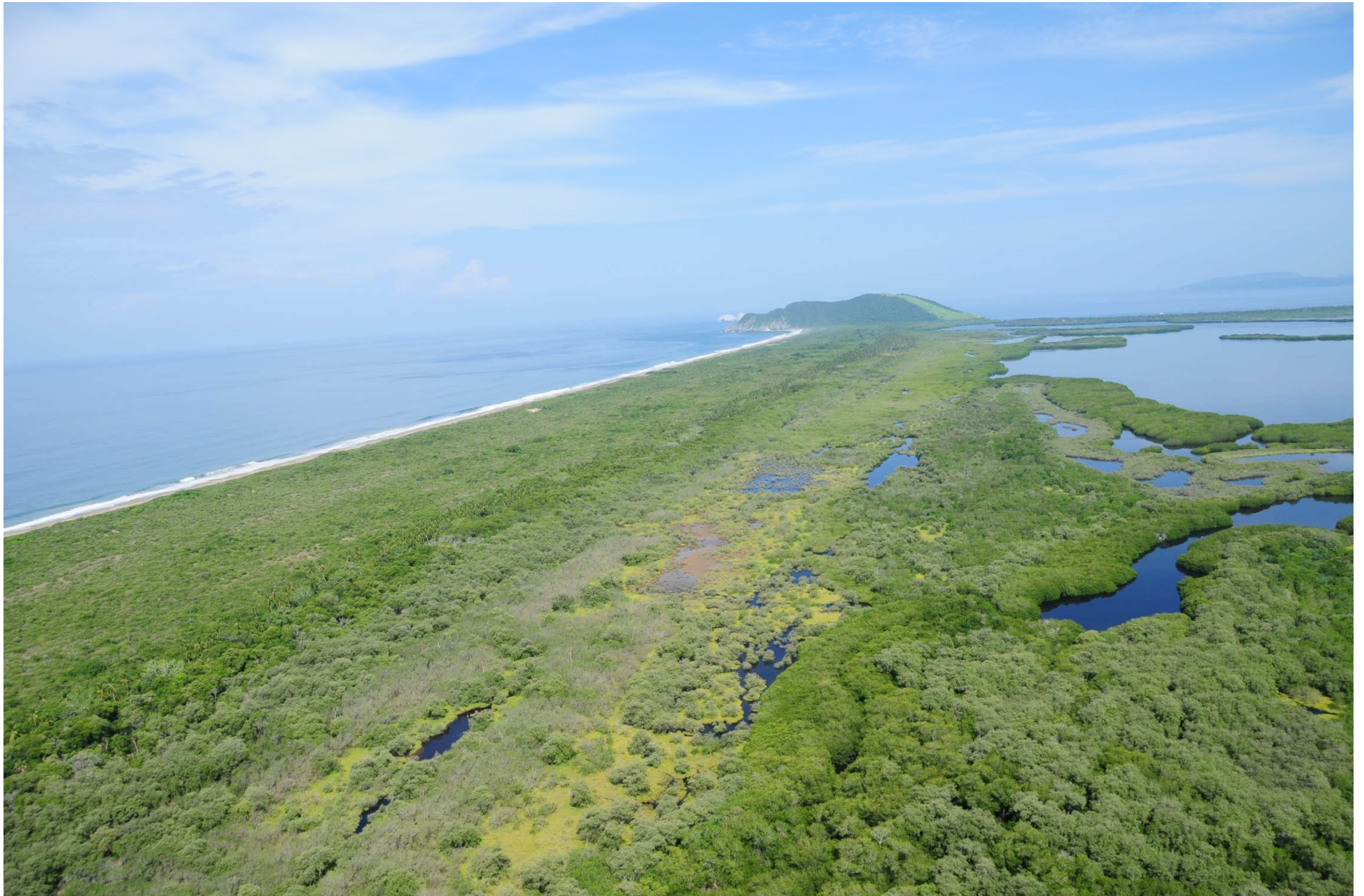
Fig. 2. Manglares de Laguna El Potosí, Guerrero. Fotografía aérea panorámica.