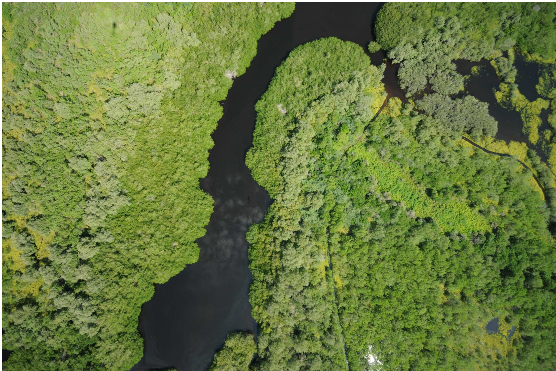
Fig. 7. Manglares de Laguna El Potosí, Guerrero. CONABIO – SEMAR / J. Díaz (2008). Fotografía aérea vertical.