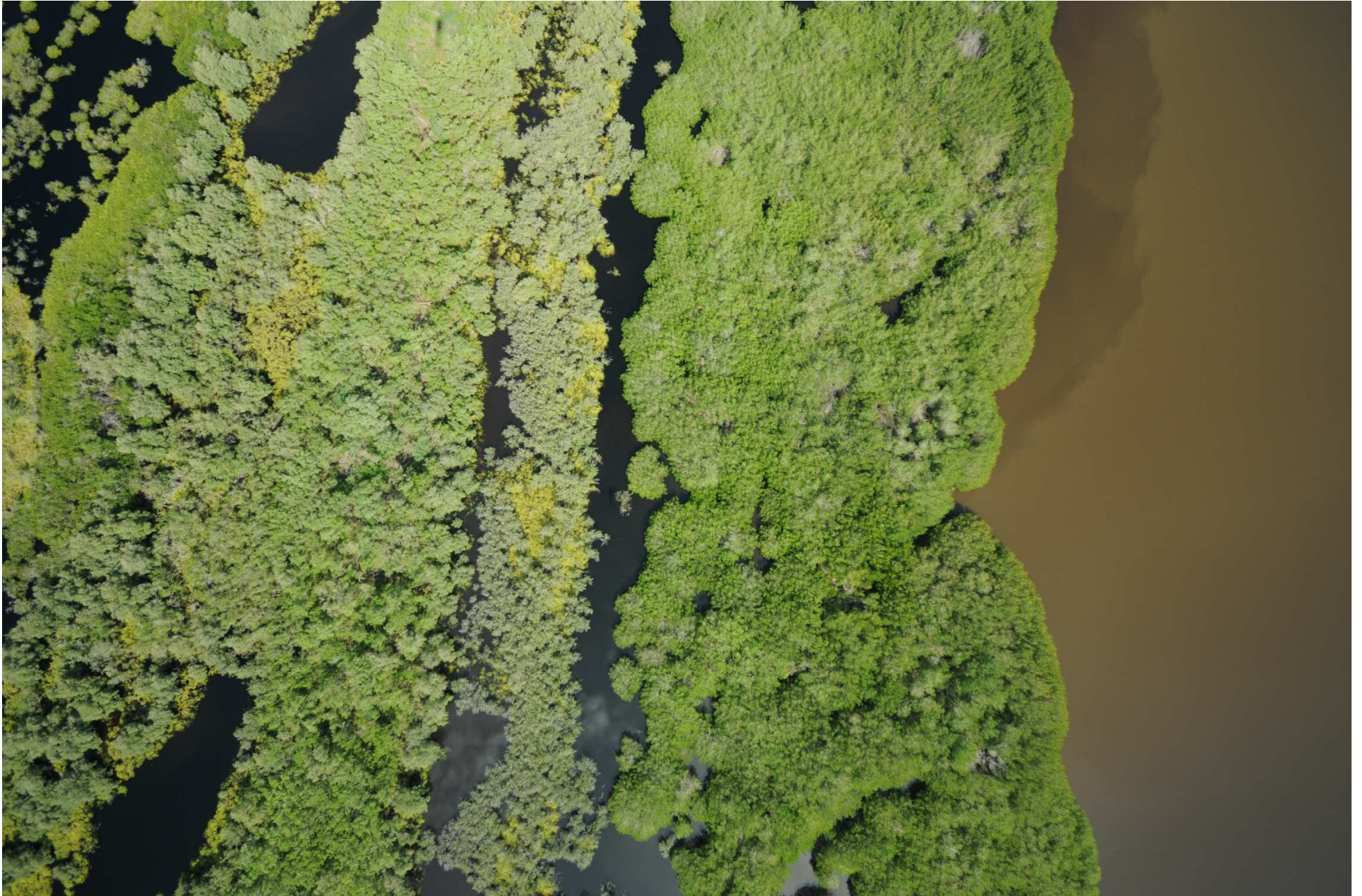
Fig. 5. Manglares de Laguna El Potosí, Guerrero. CONABIO – SEMAR / J. Díaz (2008). Fotografía aérea vertical.