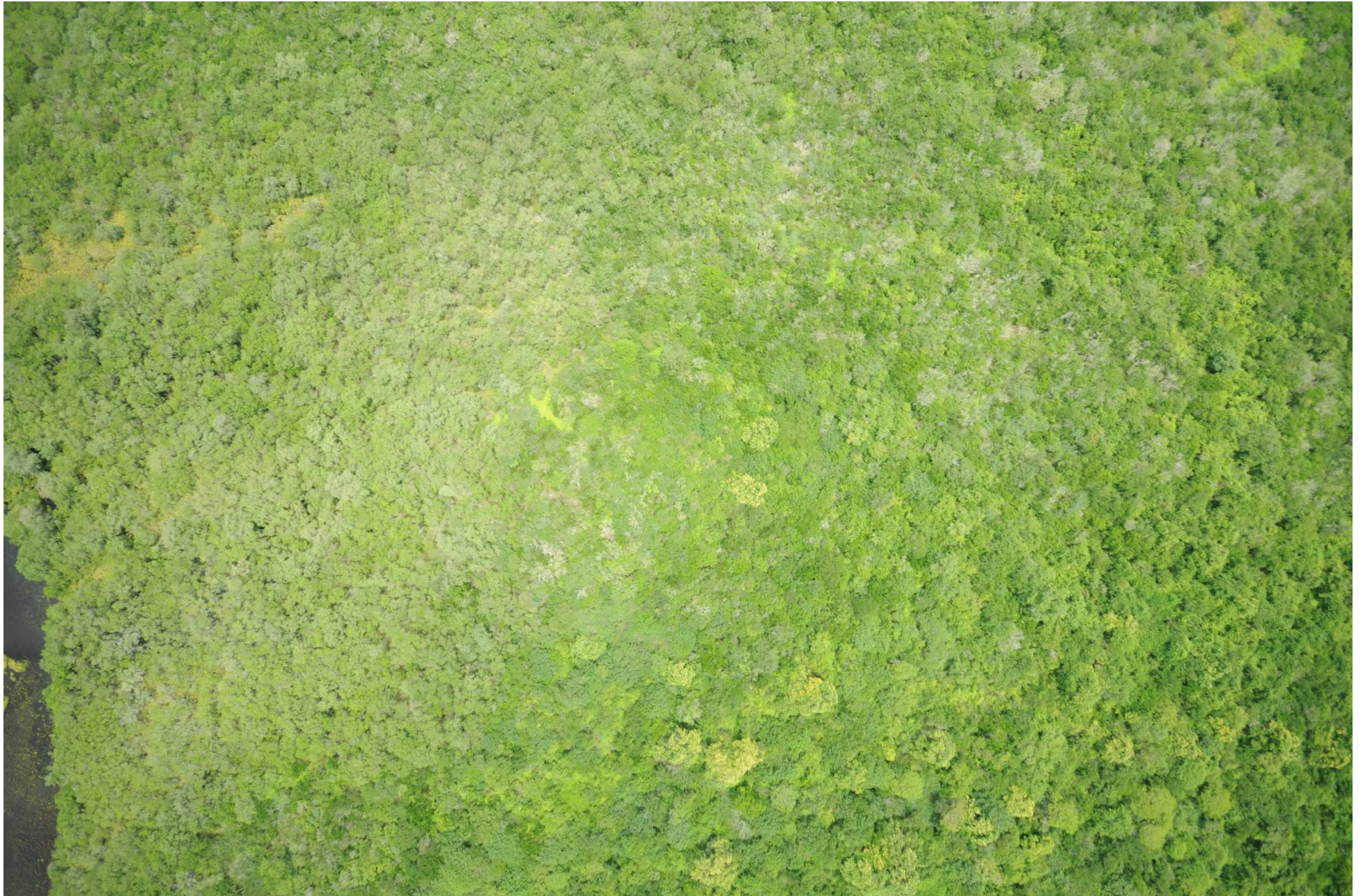
Fig. 6. Manglares de Laguna El Potosí, Guerrero. CONABIO – SEMAR / J. Díaz (2008). Fotografía aérea vertical.