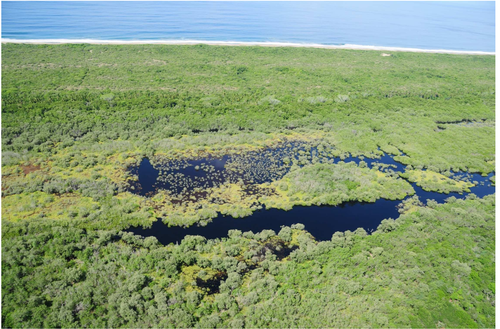
Fig. 3. Manglares de Laguna El Potosí, Guerrero. CONABIO – SEMAR / J. Acosta-Velázquez (2008). Fotografía aérea panorámica.