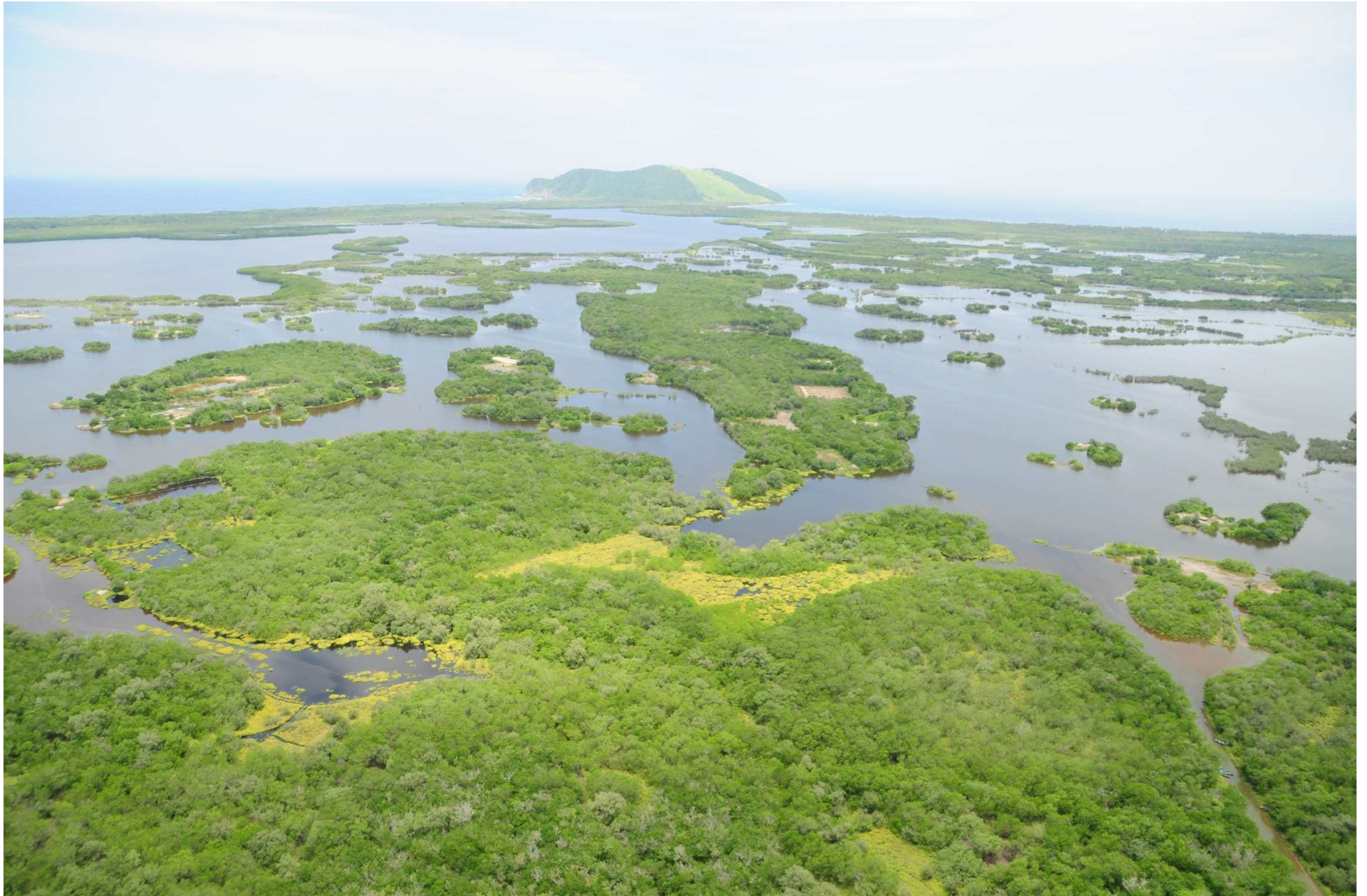
Fig. 1. Manglares de Laguna El Potosí, Guerrero. CONABIO – SEMAR / J. Acosta-Velázquez (2008). Fotografía aérea panorámica.