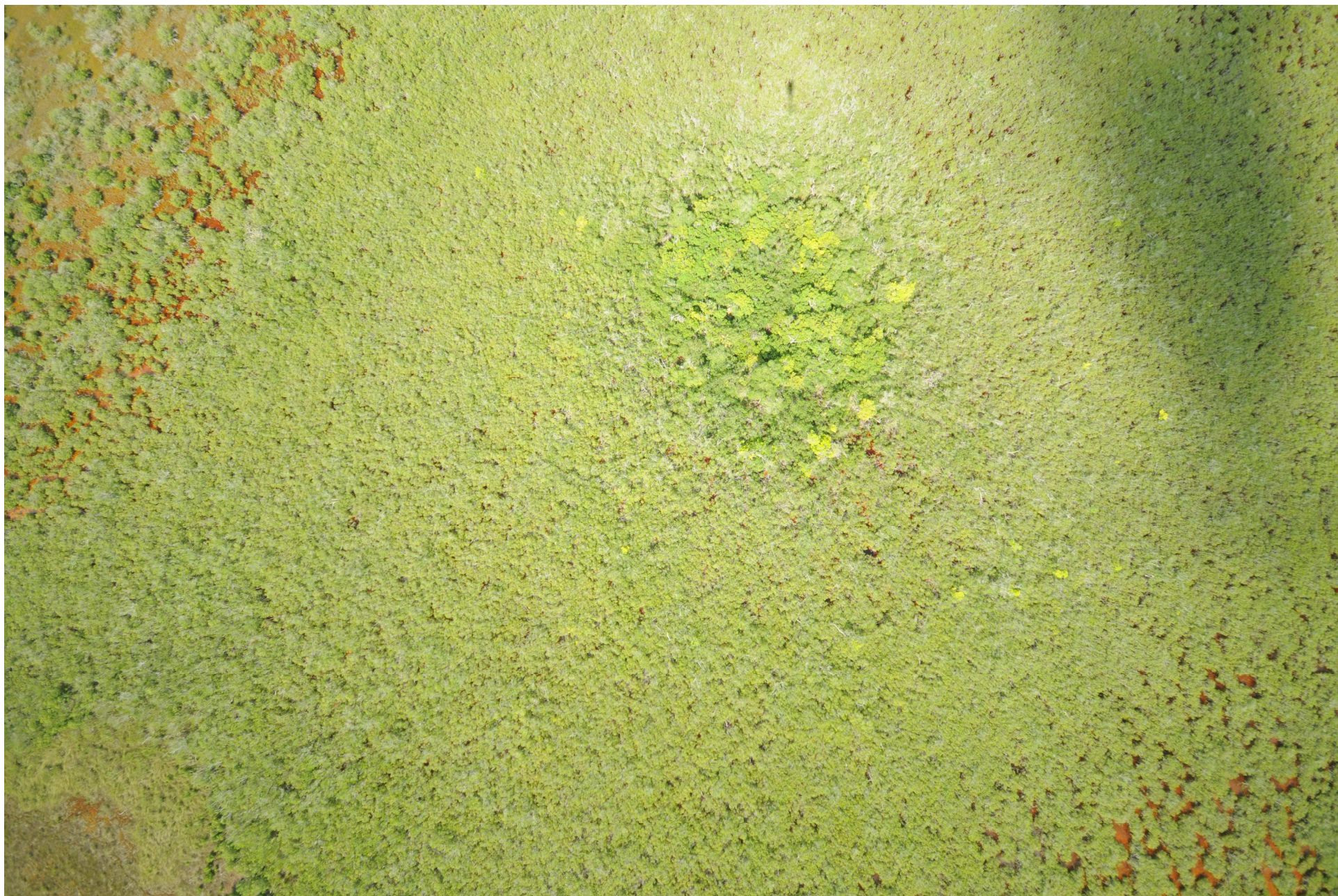
Fig. 5. Manglares de Celestún, Yucatán – Campeche. Fotografía aérea vertical.