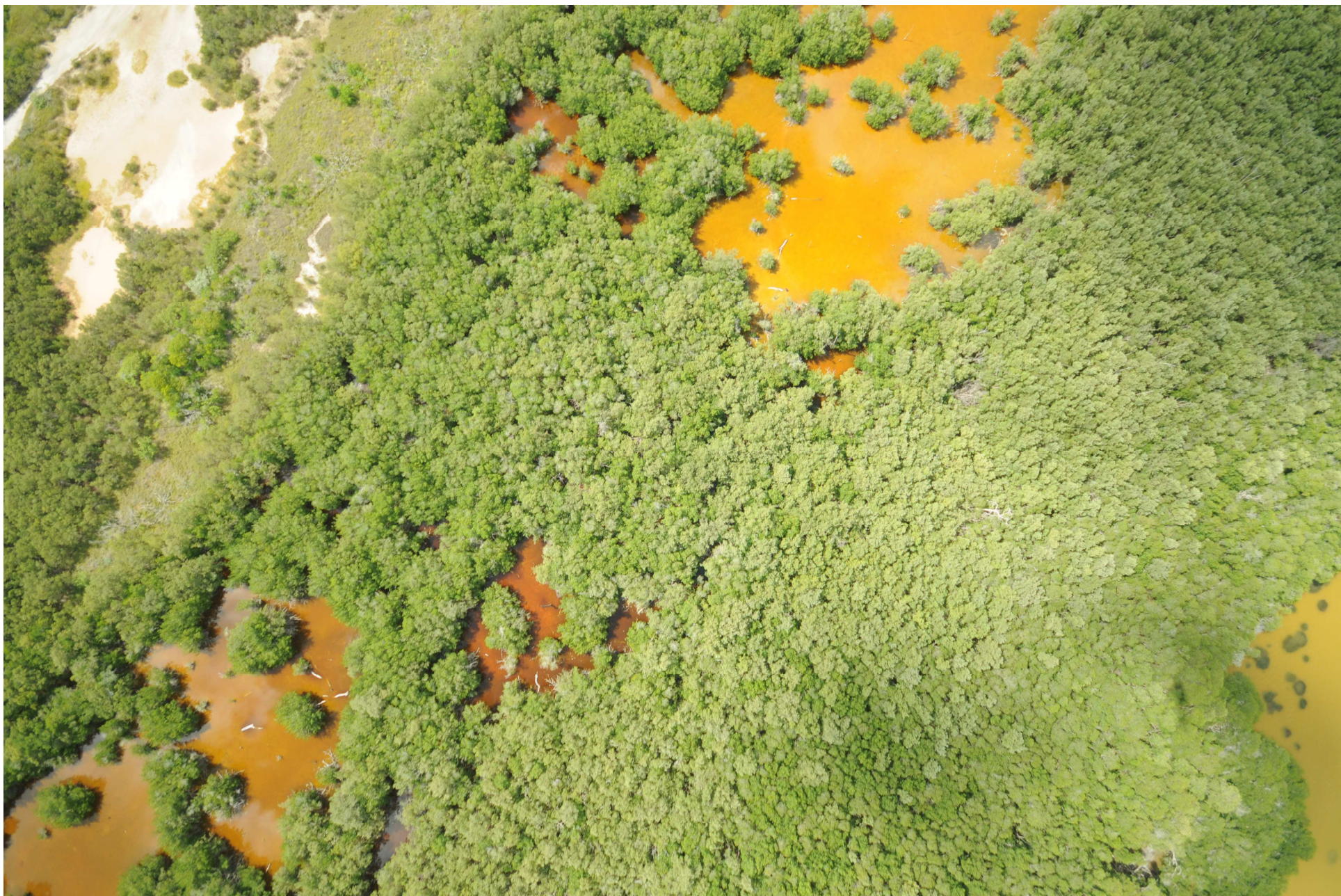
Fig. 6. Manglares de Celestún, Yucatán – Campeche. CONABIO – SEMAR / J. Díaz (2008). Fotografía aérea vertical.