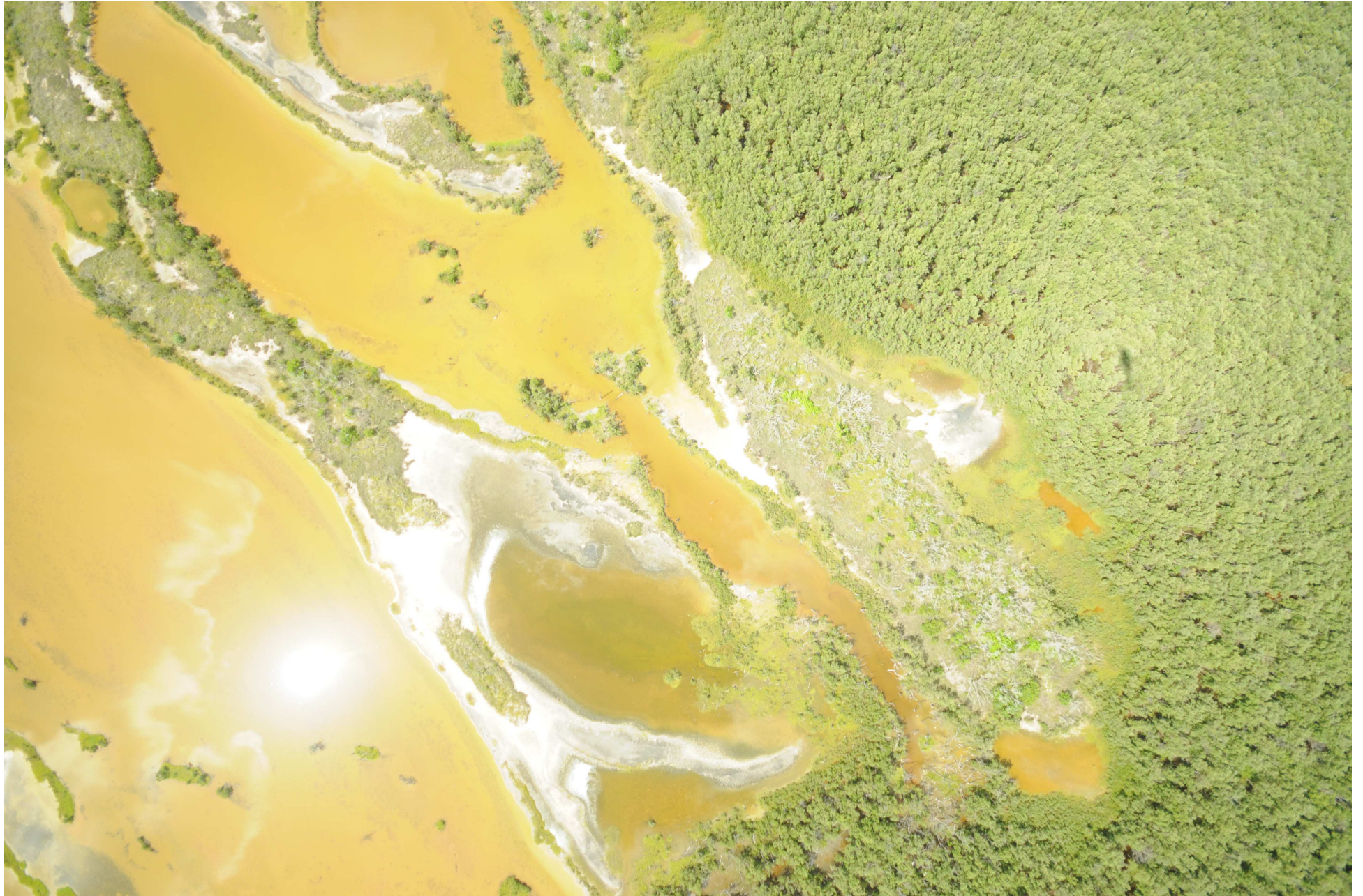
Fig. 2. Manglares de Celestún, Yucatán – Campeche. CONABIO – SEMAR / J. Díaz (2008). Fotografía aérea vertical.