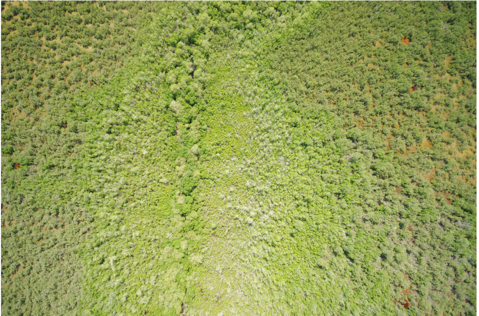
Fig. 3. Manglares de Celestún, Yucatán – Campeche. Fotografía aérea vertical.