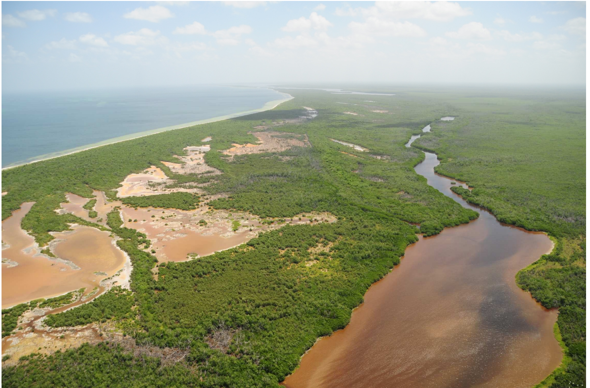
Fig. 1. Manglares de Dzilam, Yucatán. CONABIO – SEMAR / J. Acosta-Velázquez (2008). Fotografía aérea panorámica.