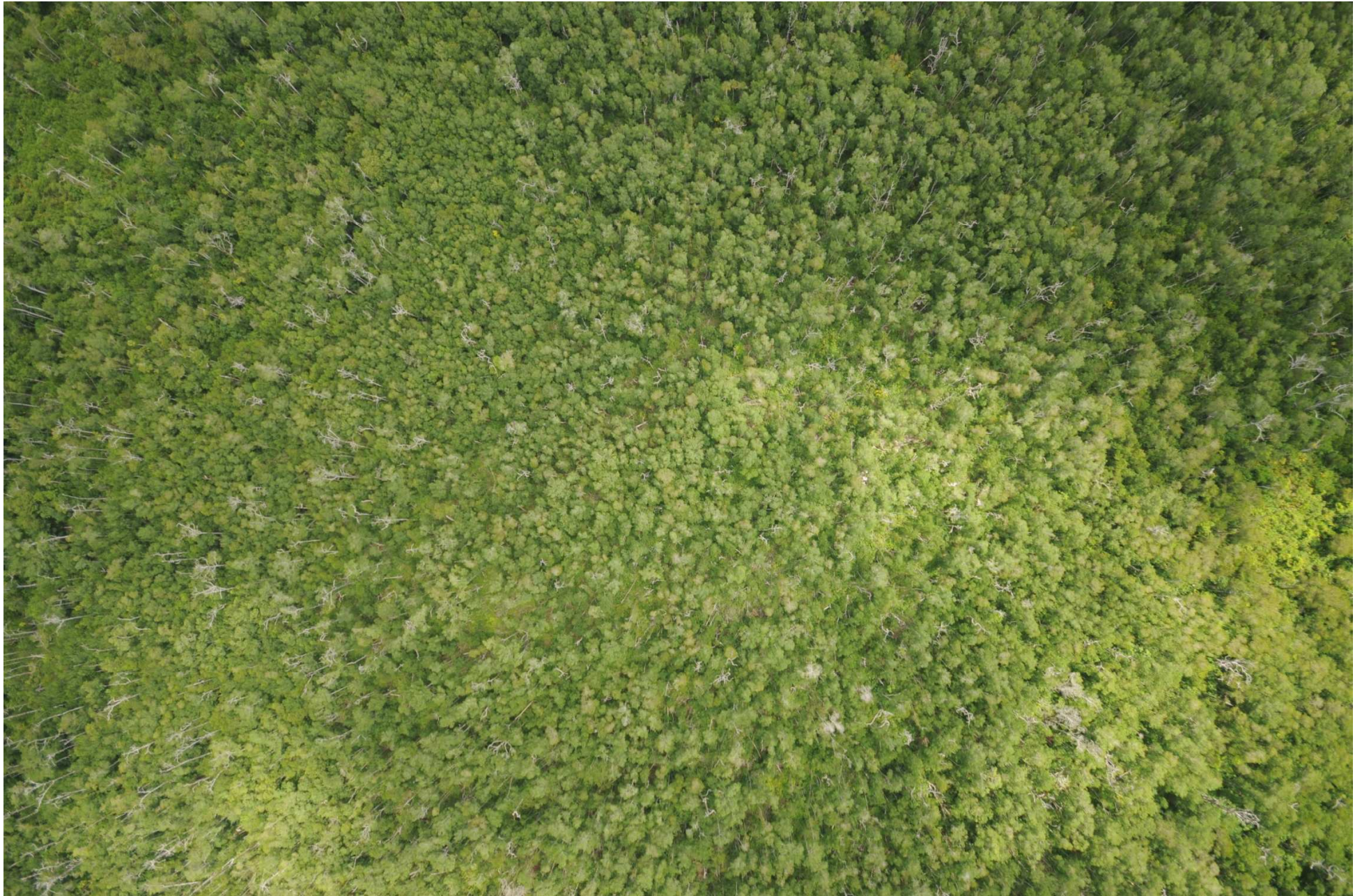
Fig. 7. Manglares de Dzilam, Yucatán. CONABIO – SEMAR / J. Díaz (2008). Fotografía aérea vertical.