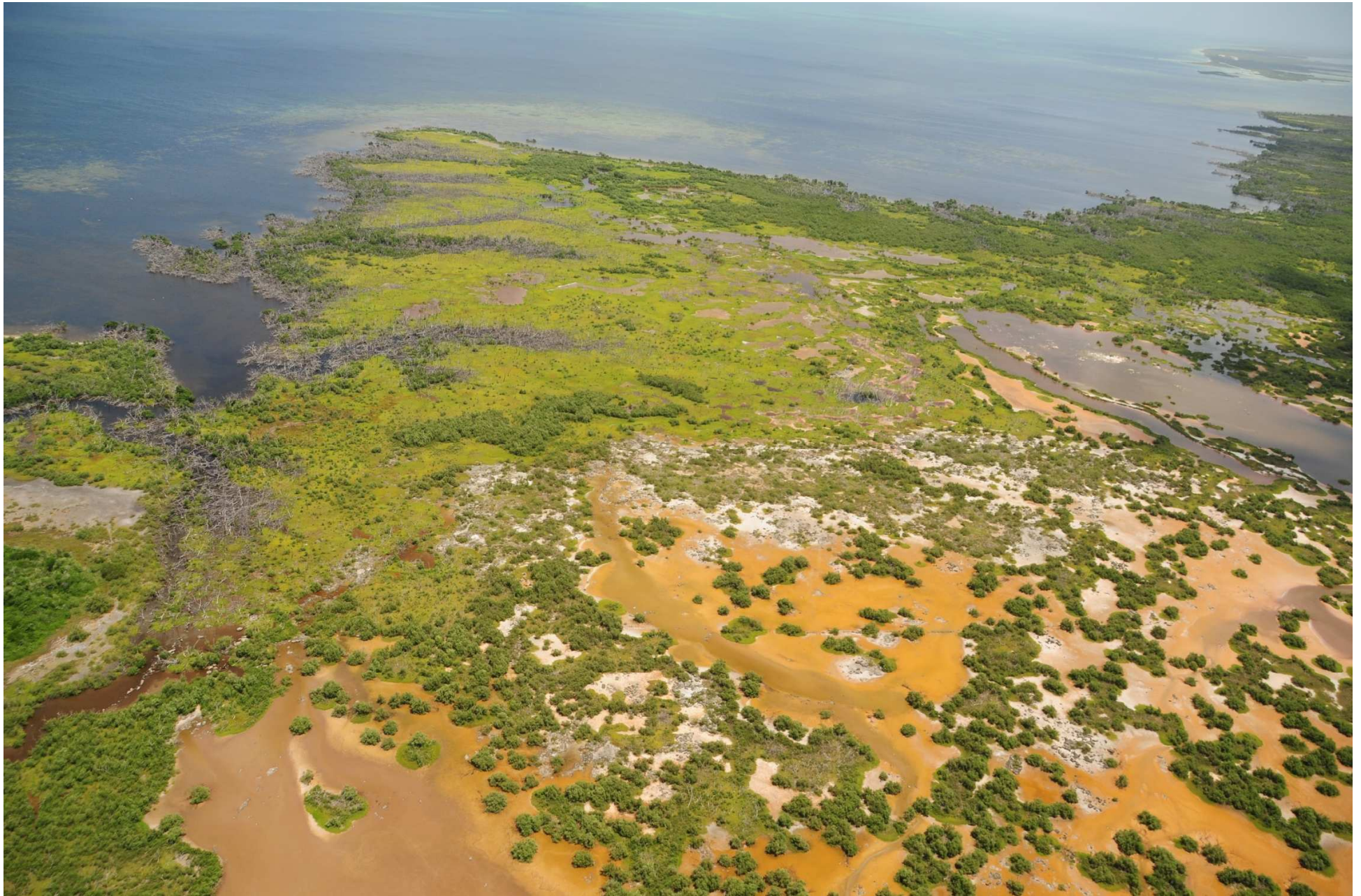
Fig. 4. Manglares de Dzilam, Yucatán. CONABIO – SEMAR / J. Acosta-Velázquez (2008). Fotografía aérea panorámica.