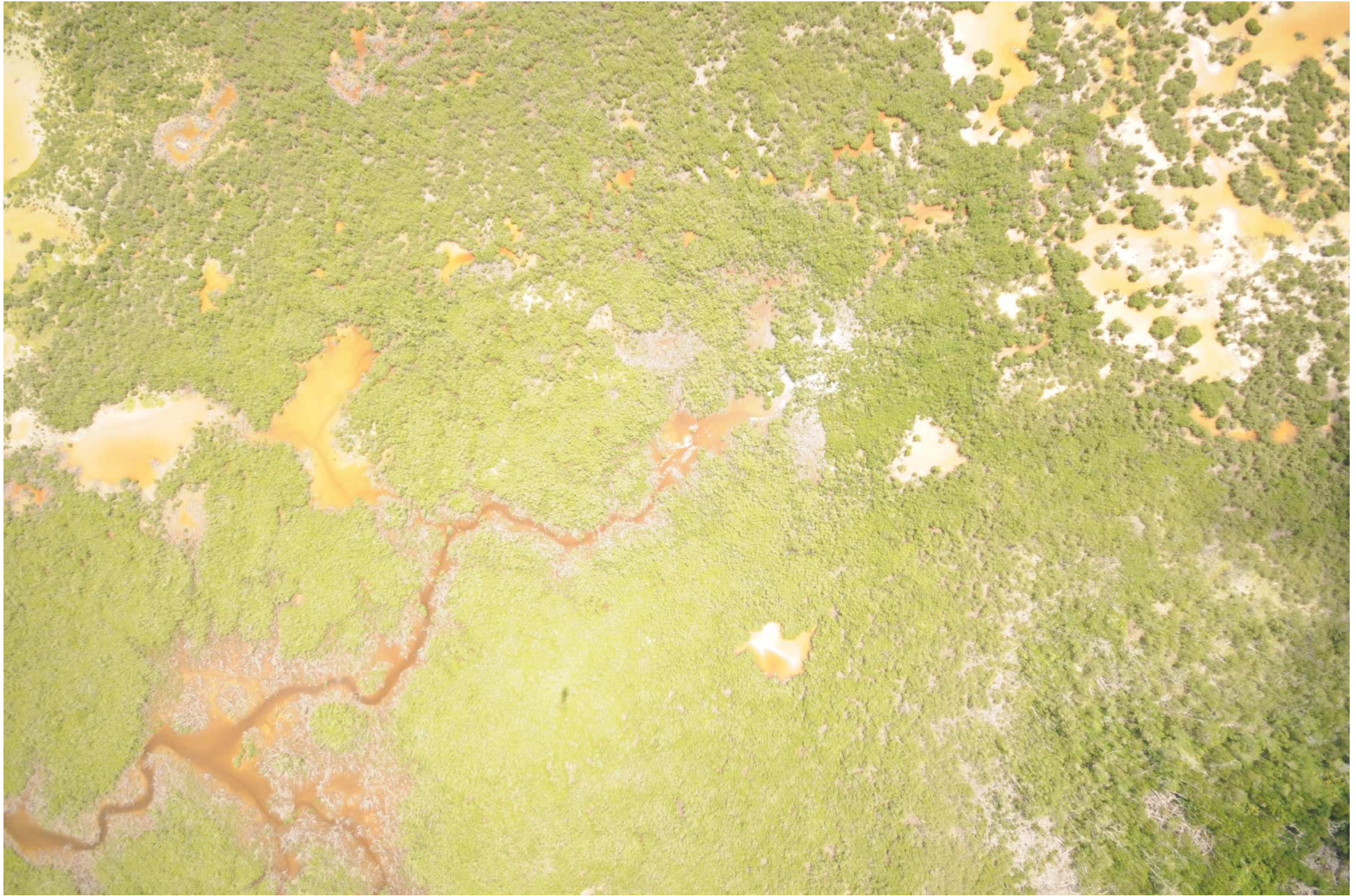
Fig. 5. Manglares de Dzilam, Yucatán. Fotografía aérea vertical.