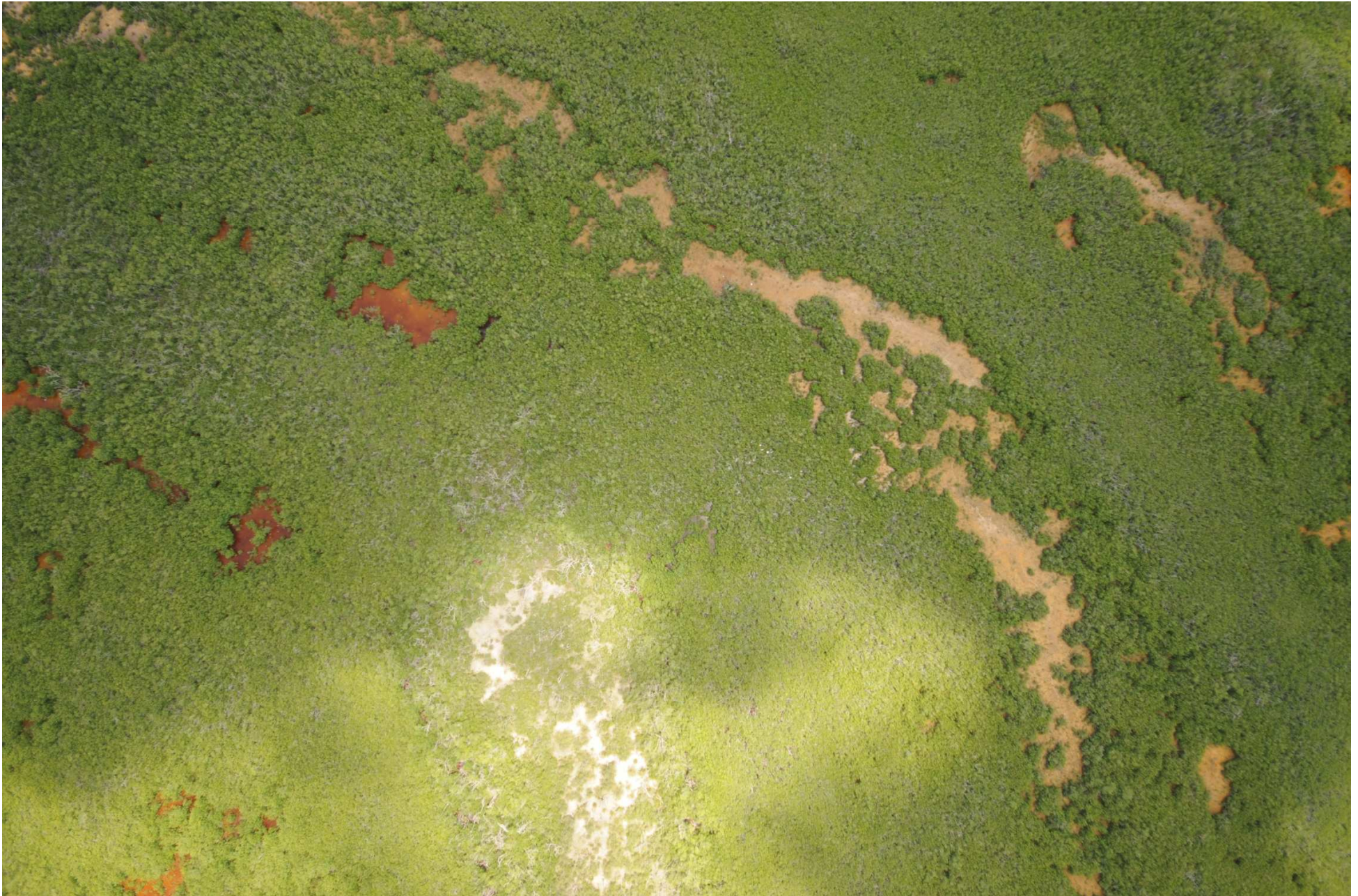
Fig. 8. Manglares de Dzilam, Yucatán. Fotografía aérea vertical.