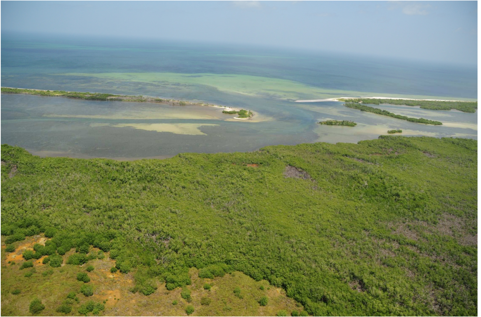
Fig. 2. Manglares de Dzilam, Yucatán. CONABIO – SEMAR / J. Acosta-Velázquez (2008). Fotografía aérea panorámica.