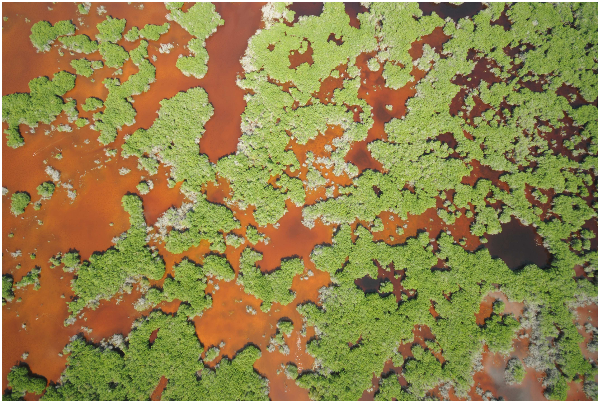
Fig. 8. Manglares de El Palmar, Yucatán. Fotografía aérea vertical.