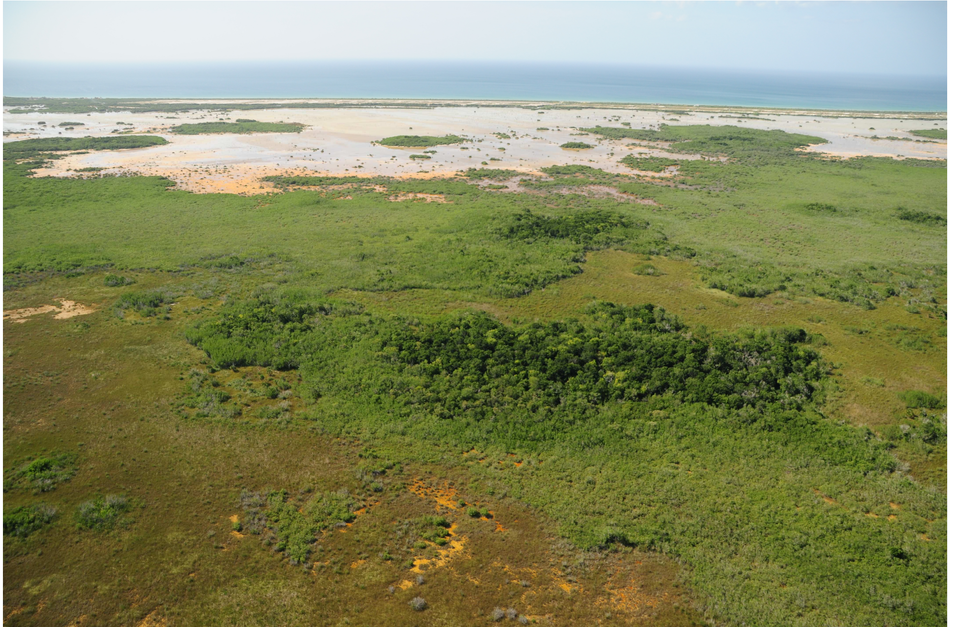
Fig. 1. Manglares de El Palmar, Yucatán. Fotografía aérea panorámica.