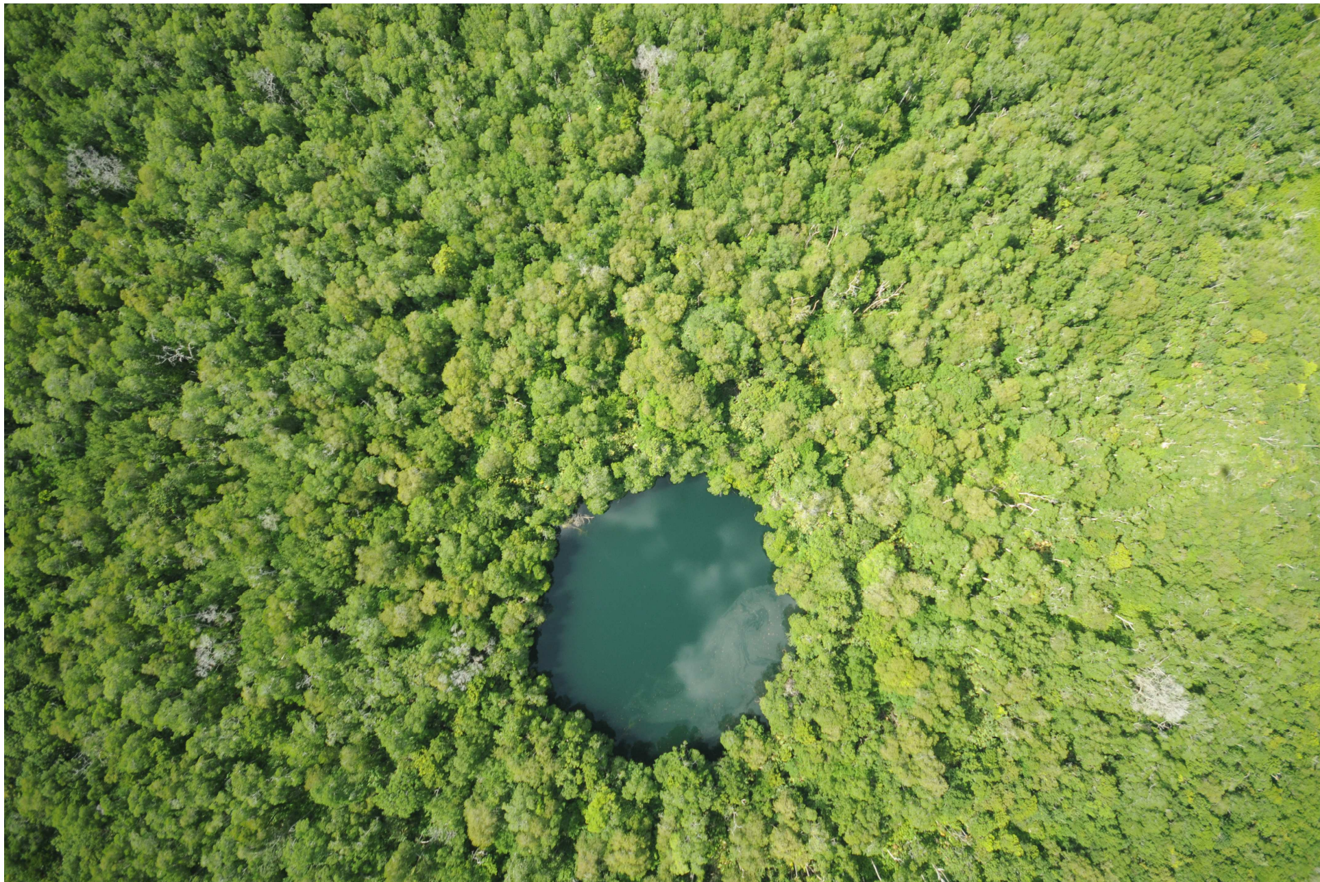
Fig. 6. Manglares de El Palmar, Yucatán. Fotografía aérea vertical.