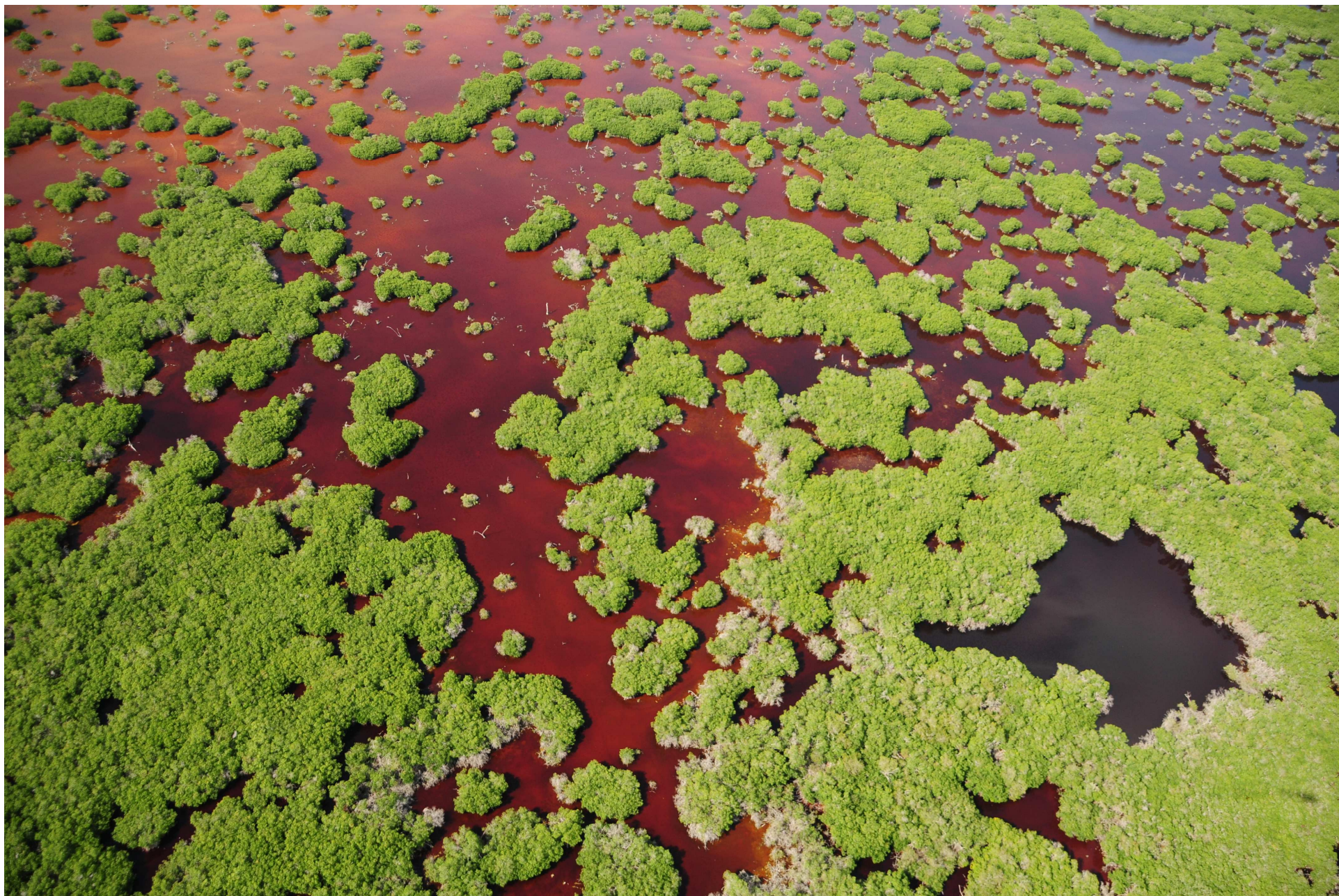
Fig. 4. Manglares de El Palmar, Yucatán. Fotografía aérea panorámica.