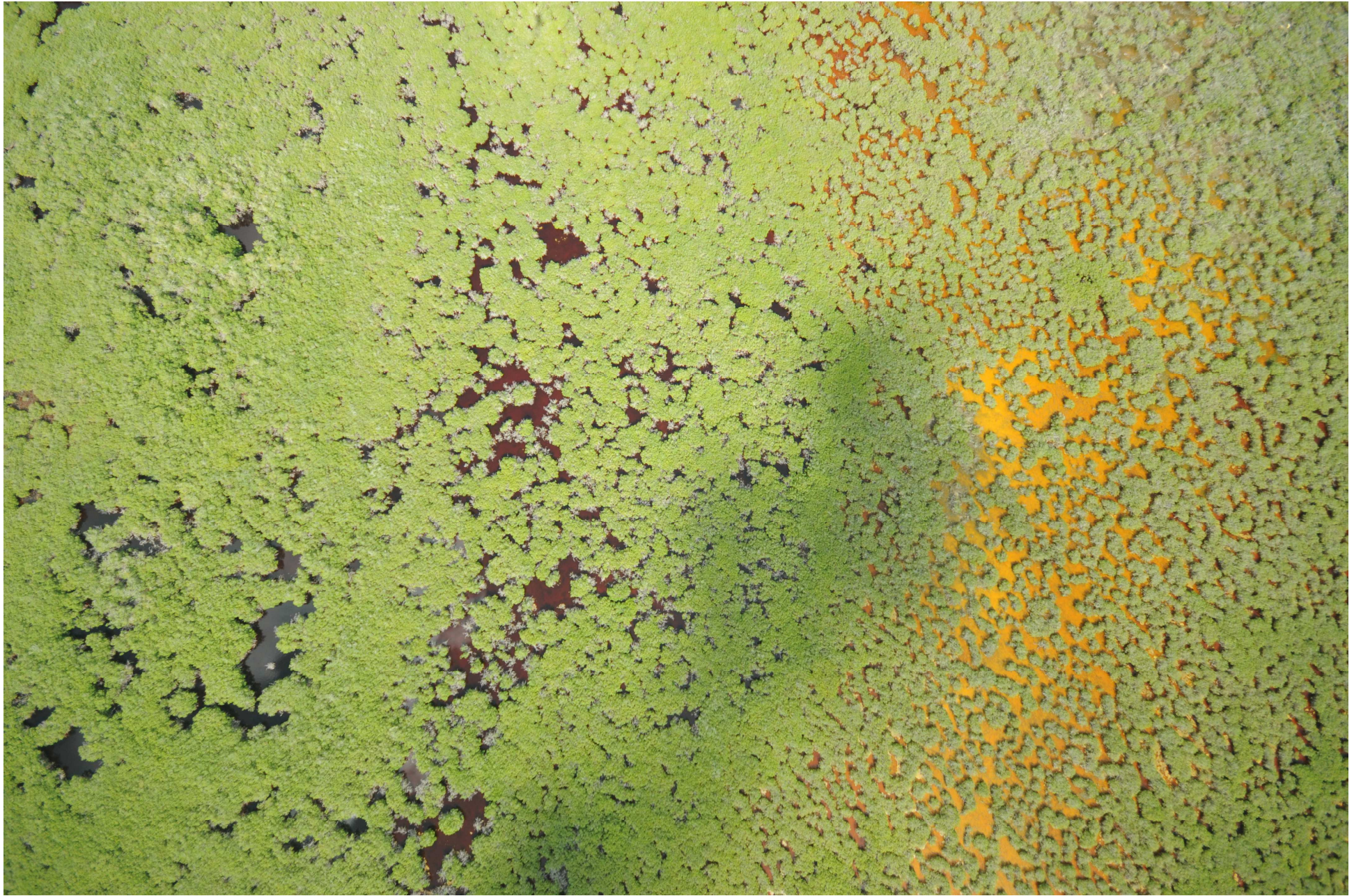
Fig. 7. Manglares de El Palmar, Yucatán. Fotografía aérea vertical.