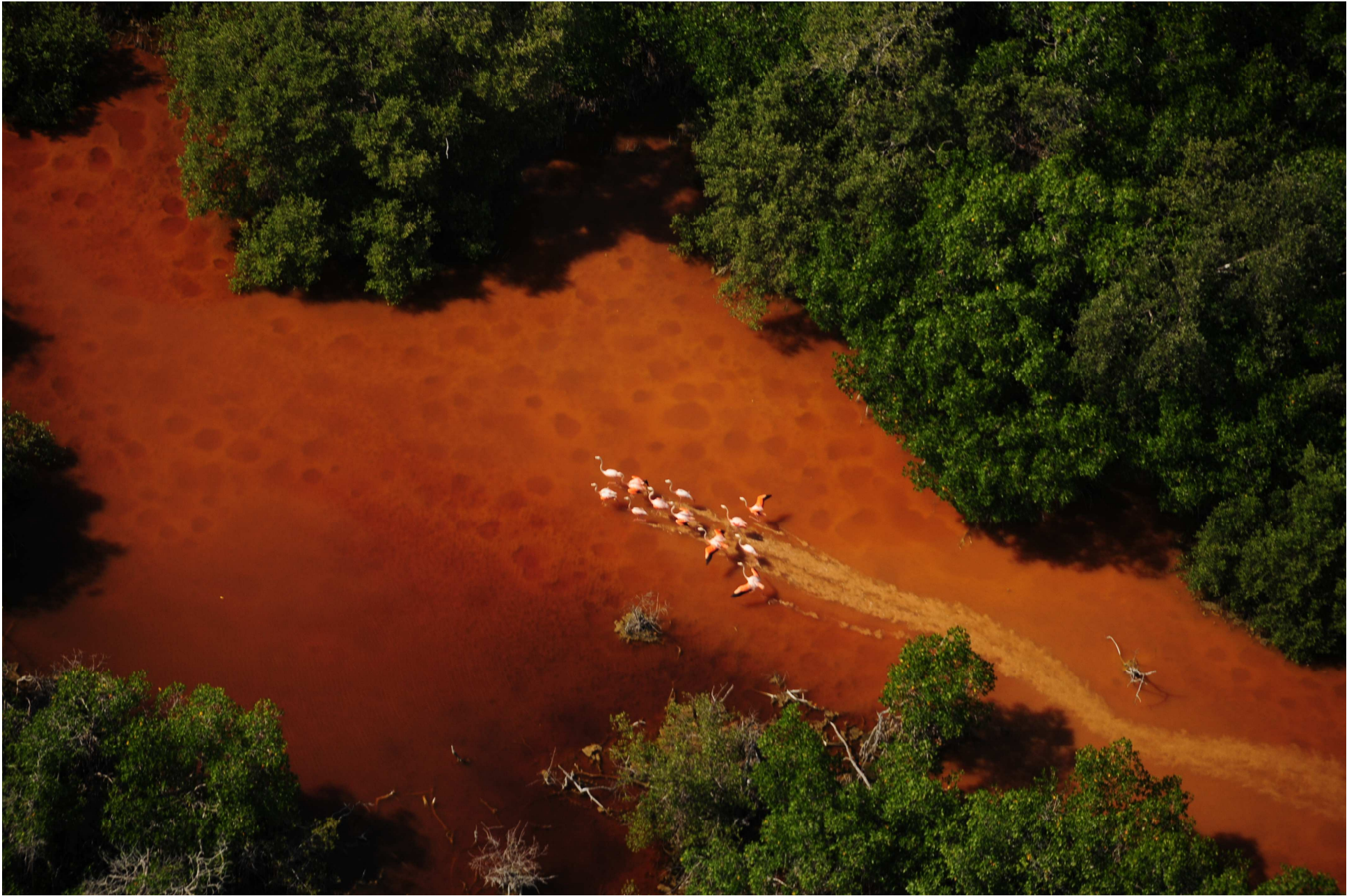
Fig. 2. Manglares y flamencos en El Palmar, Yucatán. Fotografía aérea panorámica.