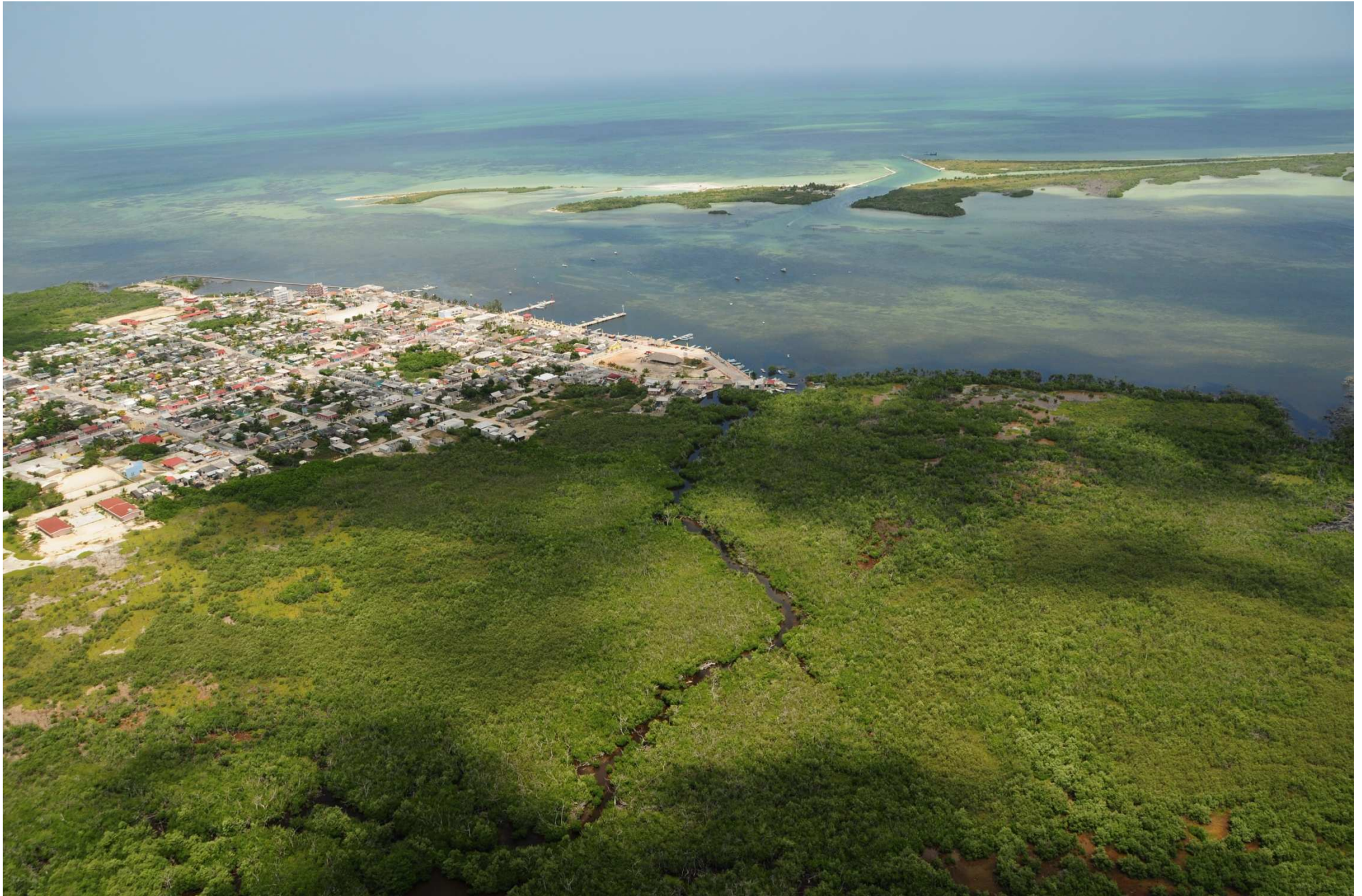
Fig. 1. Manglares de Ría Lagartos (Punta Holchit). En el extremo izquierdo de la imagen se muestra el poblado de San Felipe, Yucatán. Fotografía aérea panorámica.