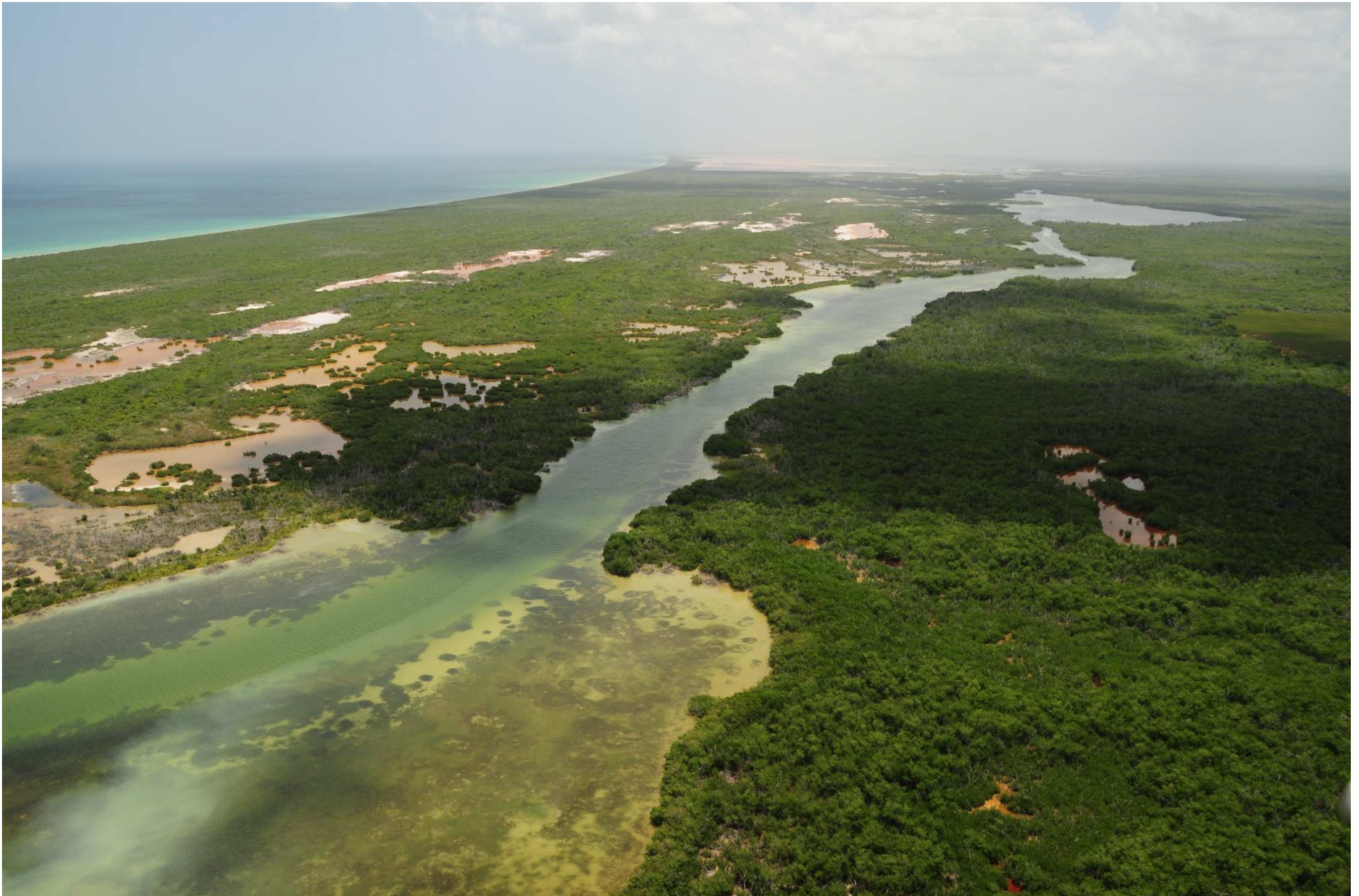
Fig. 3. Manglares de Ría Lagartos (Punta Holchit), Yucatán. Fotografía aérea panorámica.