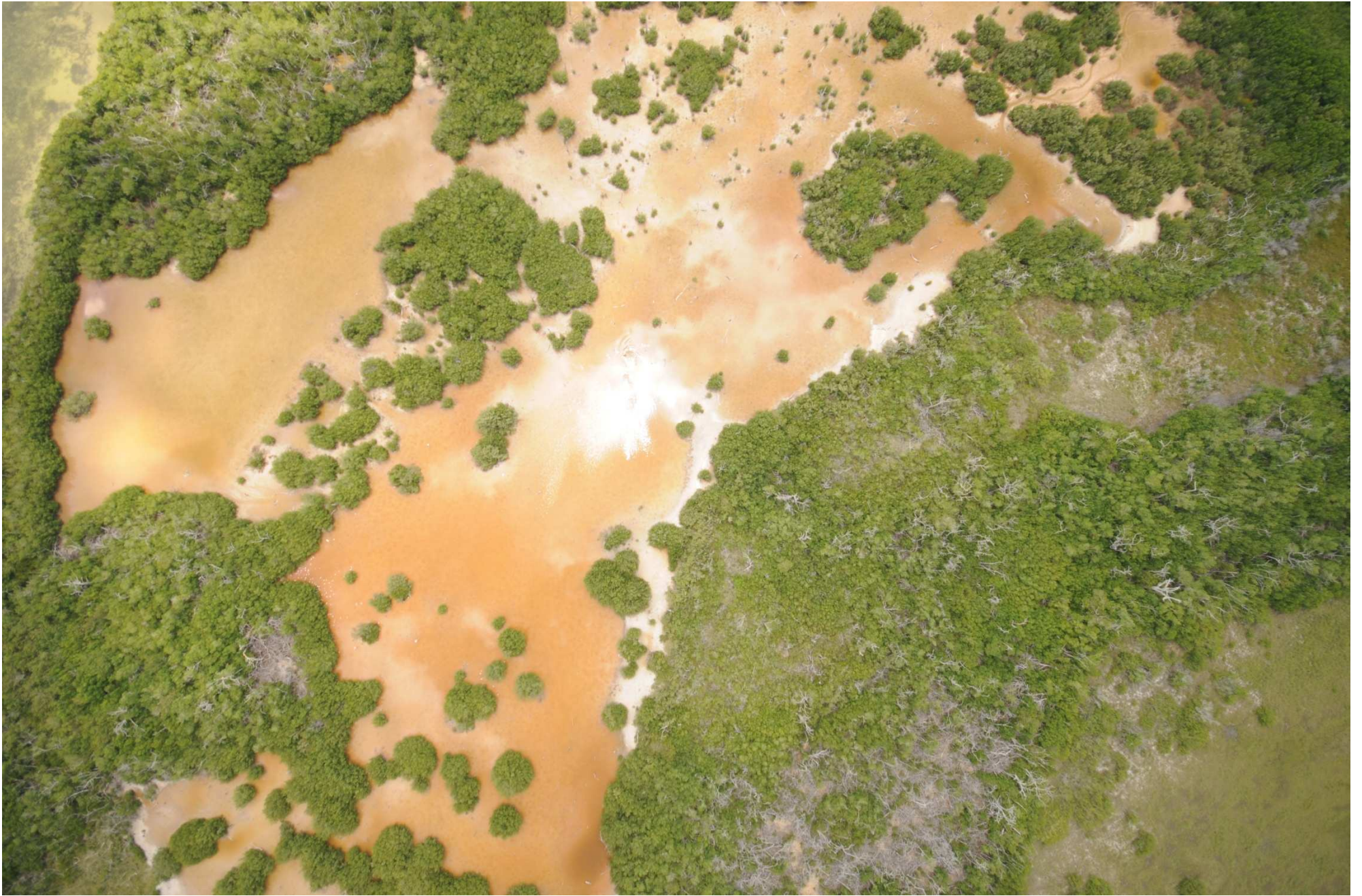
Fig. 8. Manglares de Ría Lagartos (Punta Holchit), Yucatán. Fotografía aérea vertical.