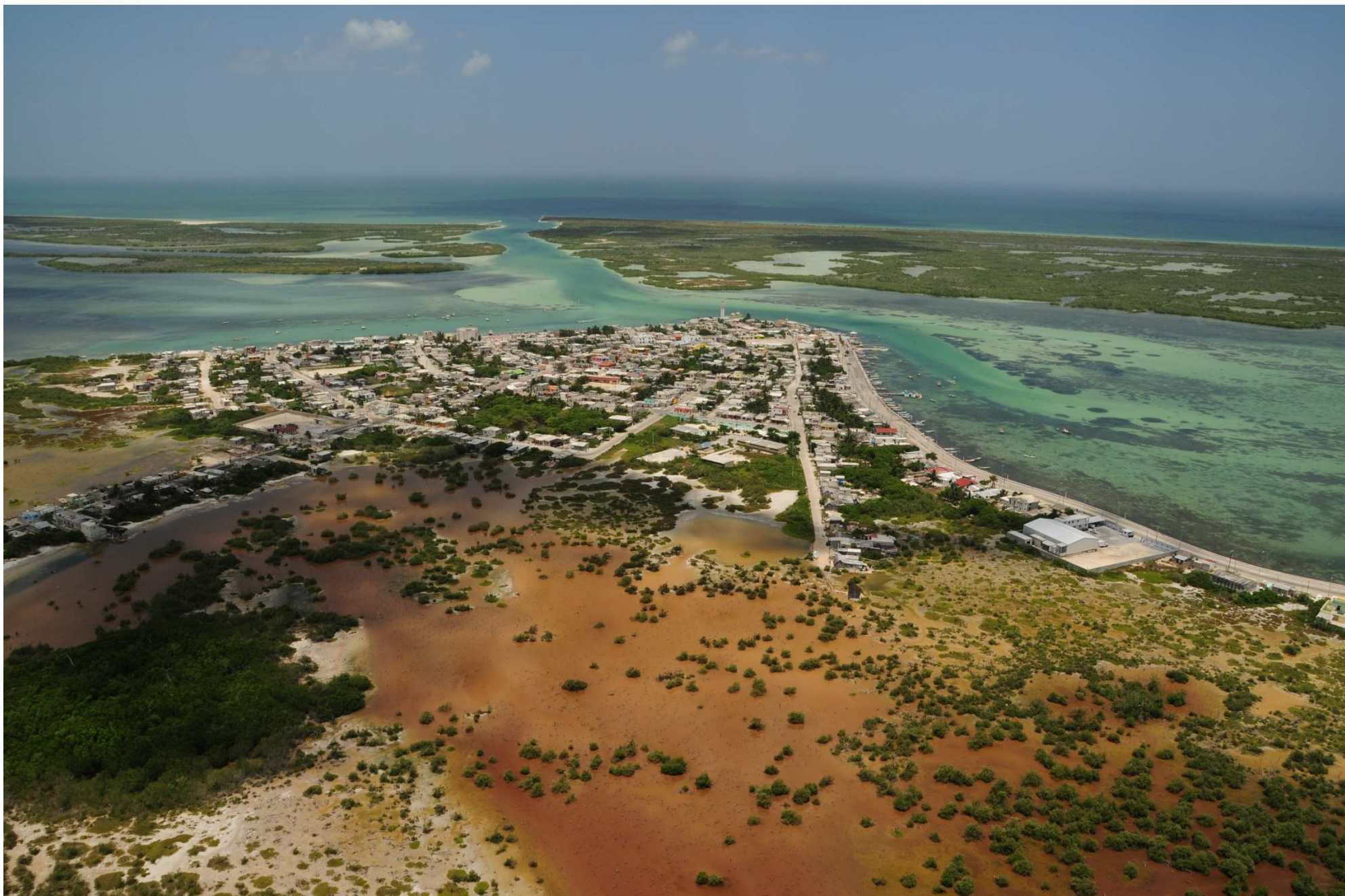
Fig. 2. Manglares de Ría Lagartos (Punta Holchit) y poblado de Ría Lagartos, Yucatán. CONABIO – SEMAR / J. Acosta-Velázquez (2008). Fotografía aérea panorámica.