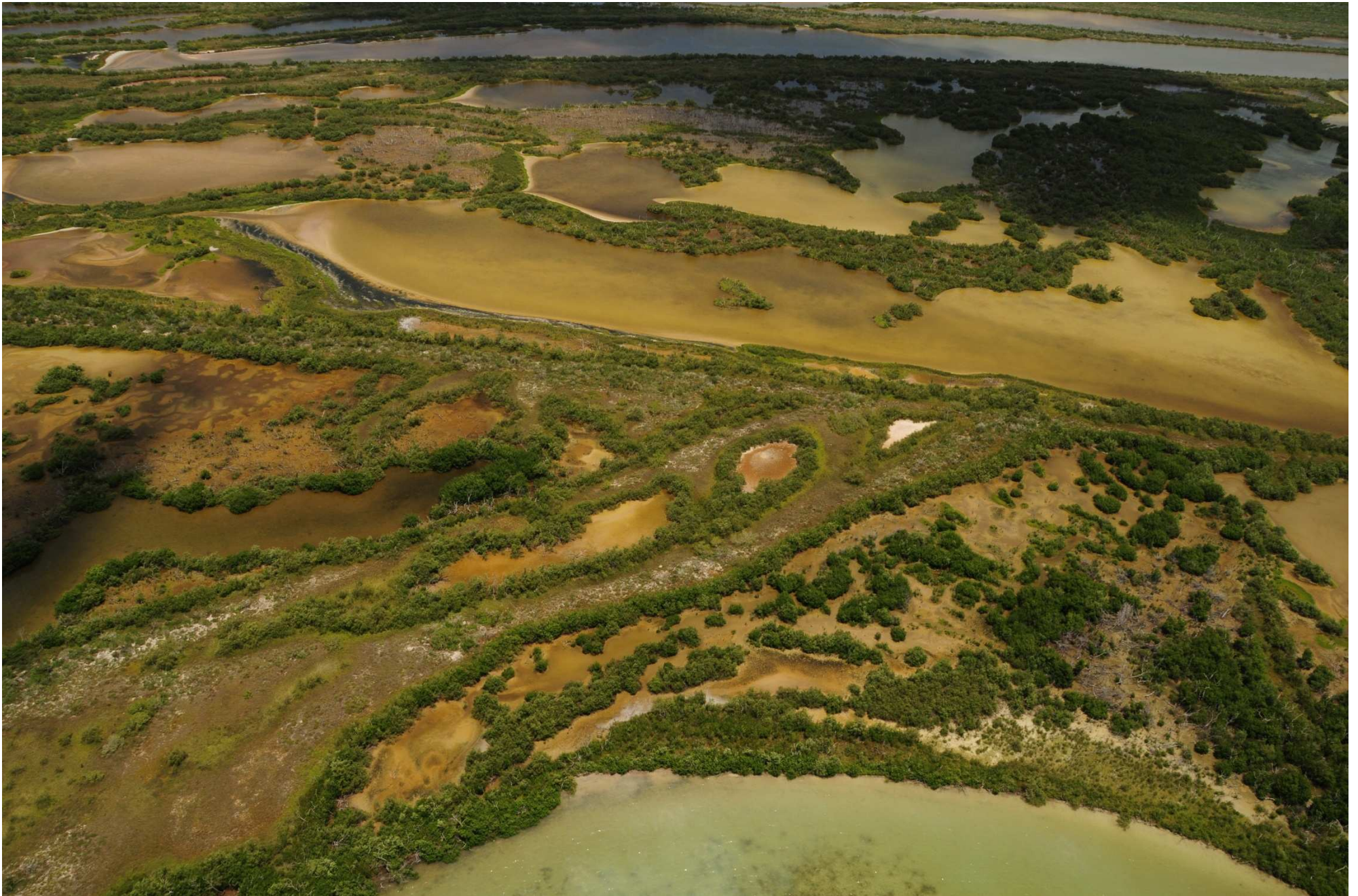
Fig. 4. Manglares de Ría Lagartos (Punta Holchit), Yucatán. Fotografía aérea panorámica.