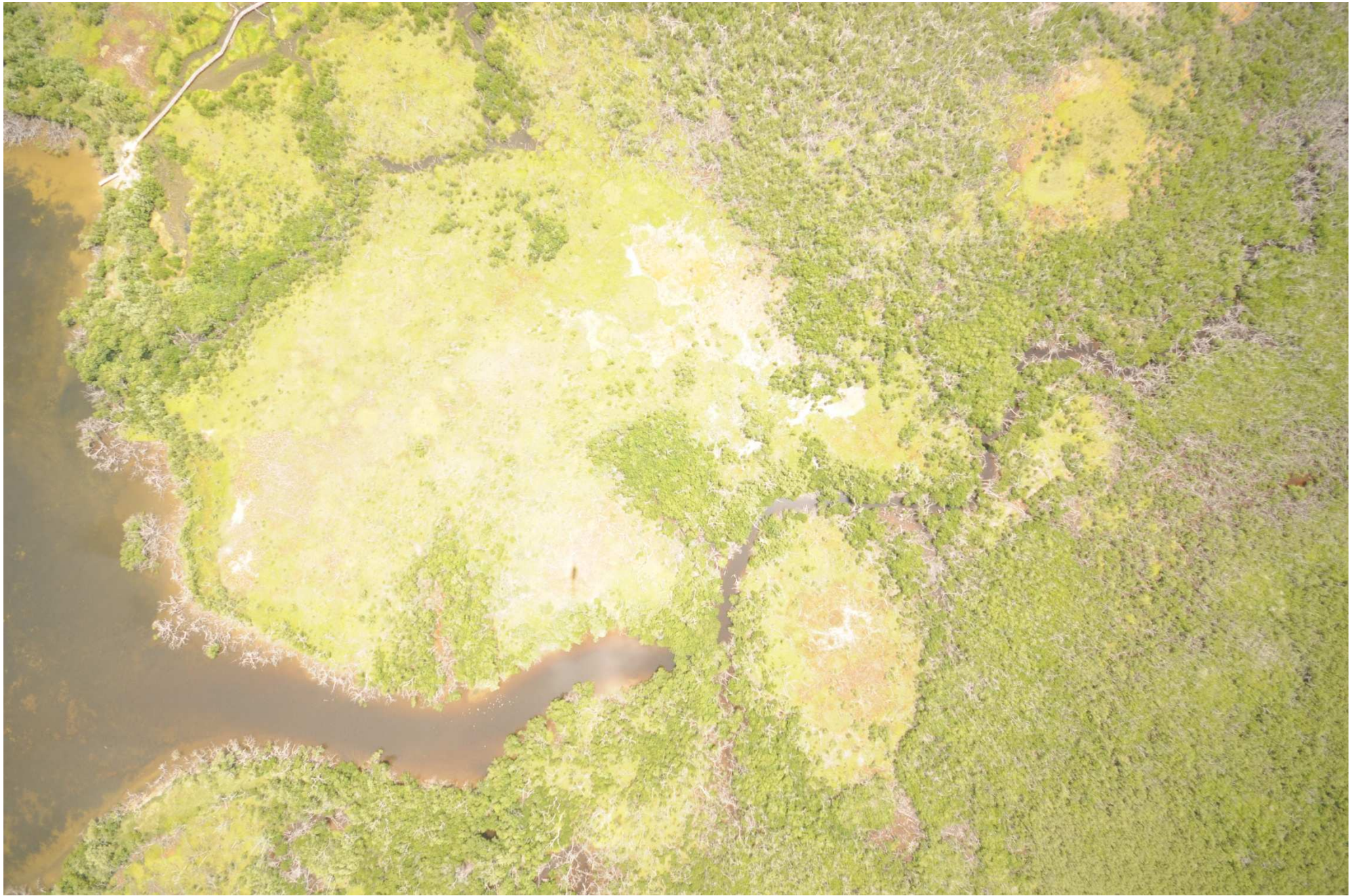
Fig. 6. Manglares de Ría Lagartos (Punta Holchit), Yucatán. Fotografía aérea vertical.