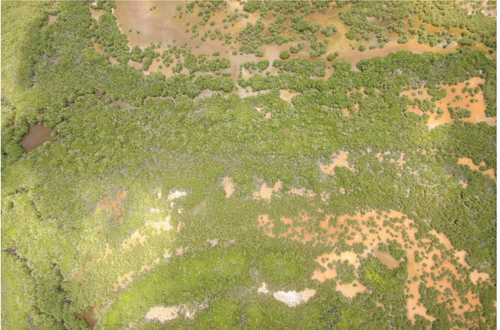
Fig. 5. Manglares de Ría Lagartos (Punta Holchit), Yucatán. Fotografía aérea vertical.