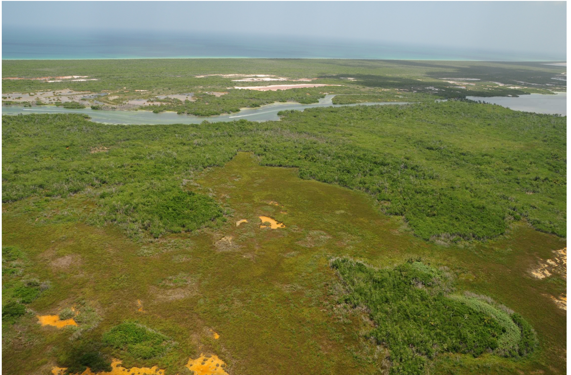
Fig. 1. Manglares de Ría Lagartos (Las Coloradas), Yucatán. Fotografía aérea panorámica.