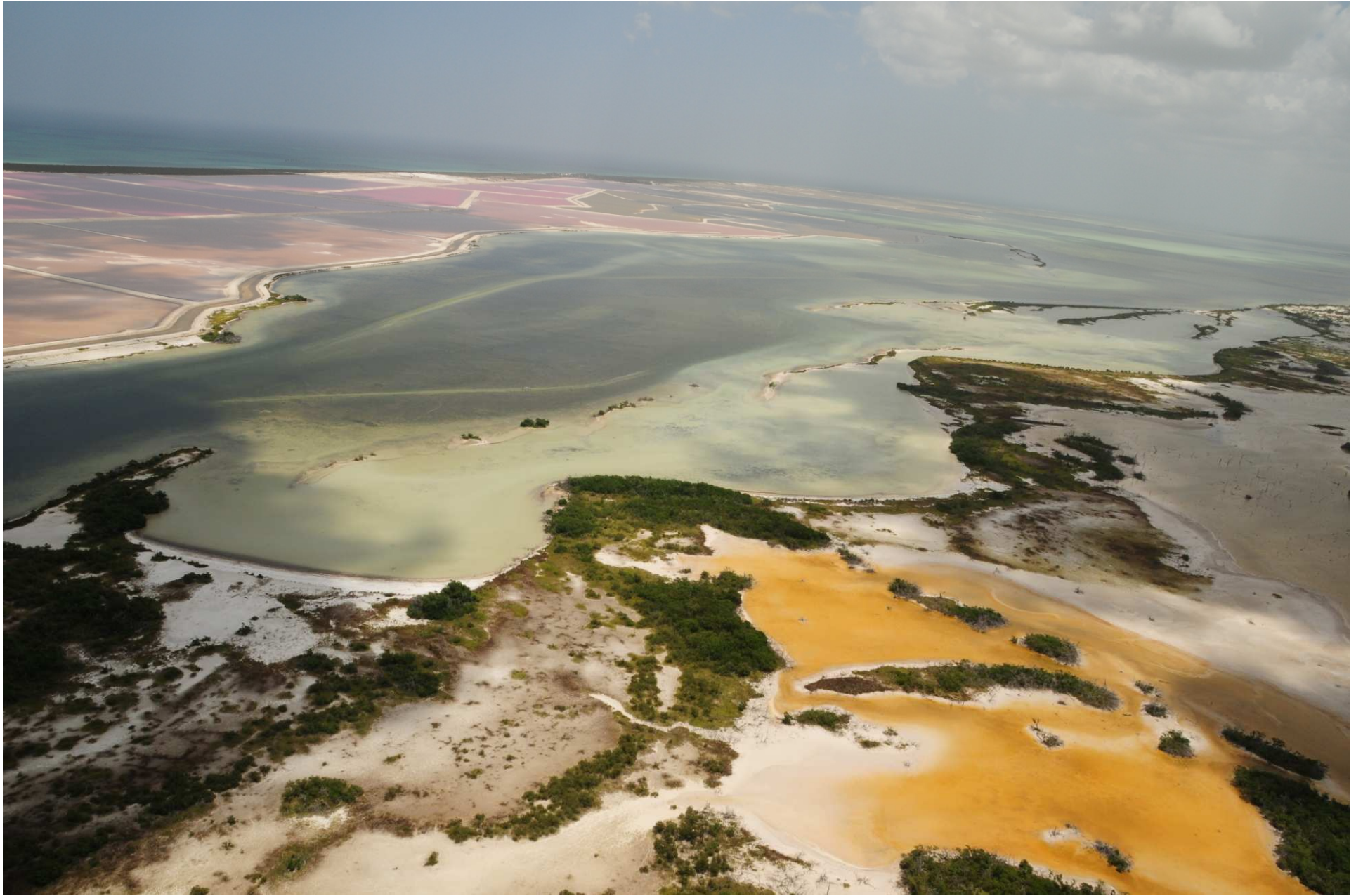
Fig. 3. Manglares de Ría Lagartos (Las Coloradas) y salineras de la Industria Salinera de Yucatán (ISYSA), Yucatán. Fotografía aérea panorámica.