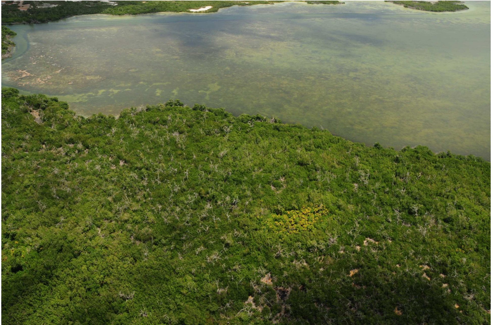
Fig. 4. Manglares de Ría Lagartos (Las Coloradas), Yucatán. Fotografía aérea panorámica.