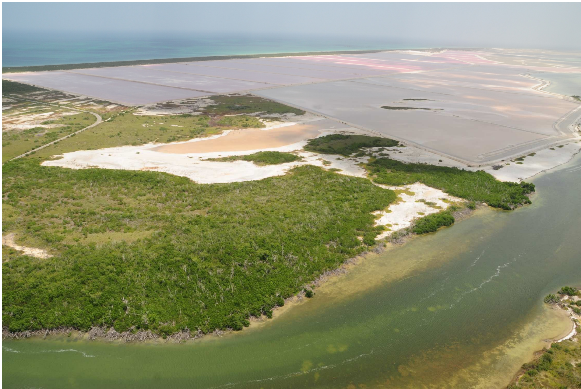
Fig. 2. Manglares de Ría Lagartos (Las Coloradas) y salineras de la Industria Salinera de Yucatán (ISYSA), Yucatán. Fotografía aérea panorámica.