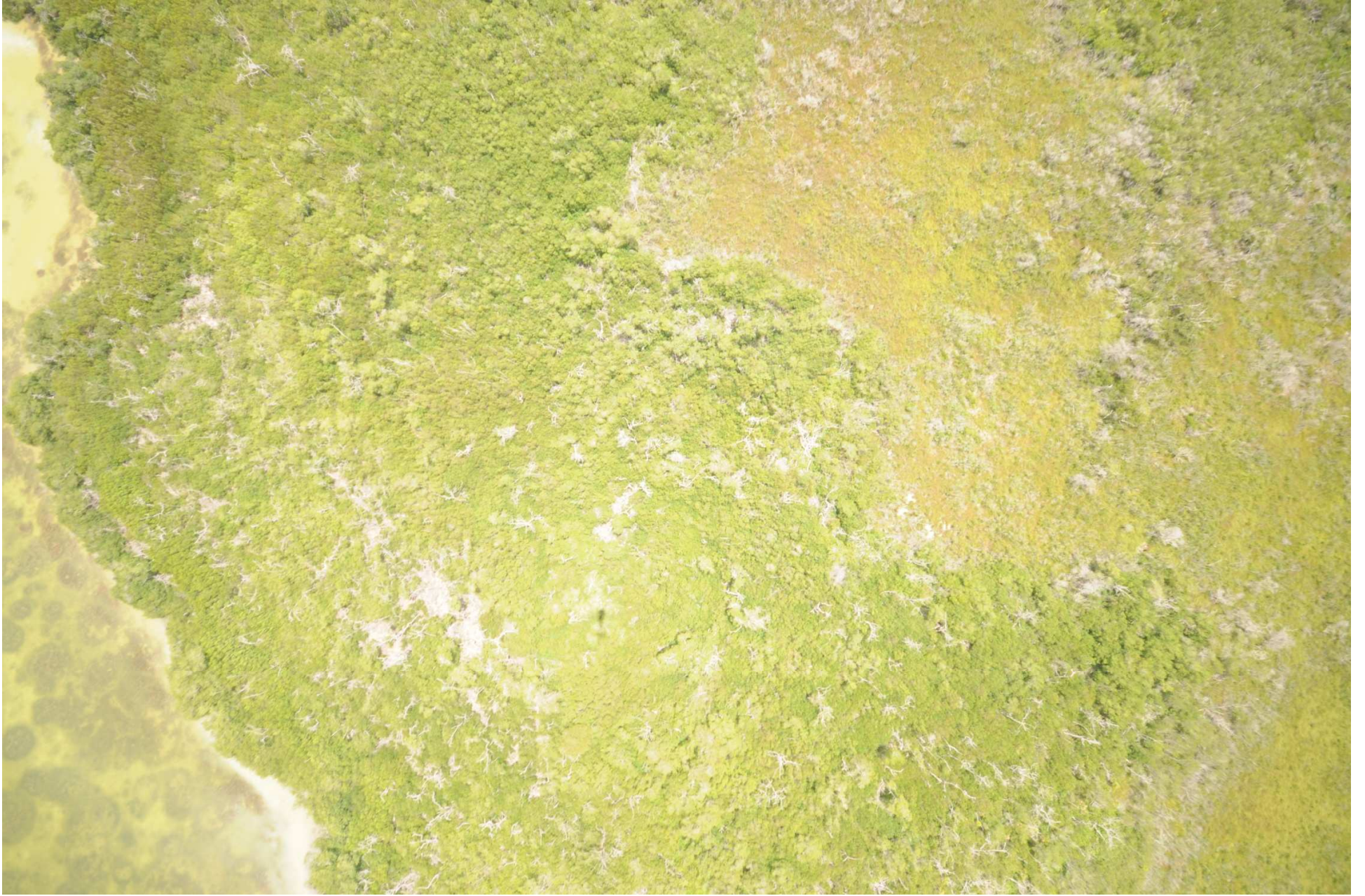
Fig. 5. Manglares de Ría Lagartos (Las Coloradas), Yucatán. Fotografía aérea vertical.