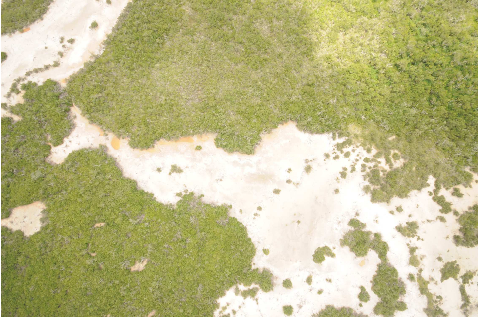
Fig. 7. Manglares de Ría Lagartos (Las Coloradas), Yucatán. Fotografía aérea vertical.