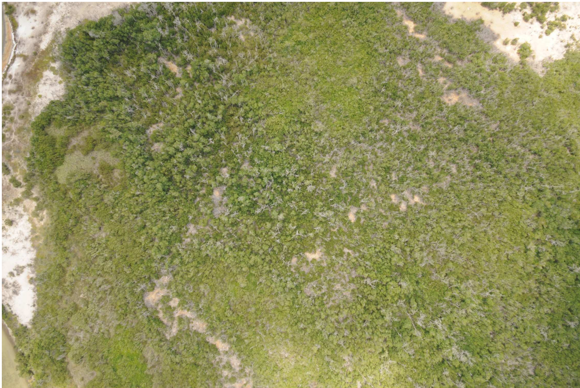
Fig. 6. Manglares de Ría Lagartos (Las Coloradas), Yucatán. Fotografía aérea vertical.