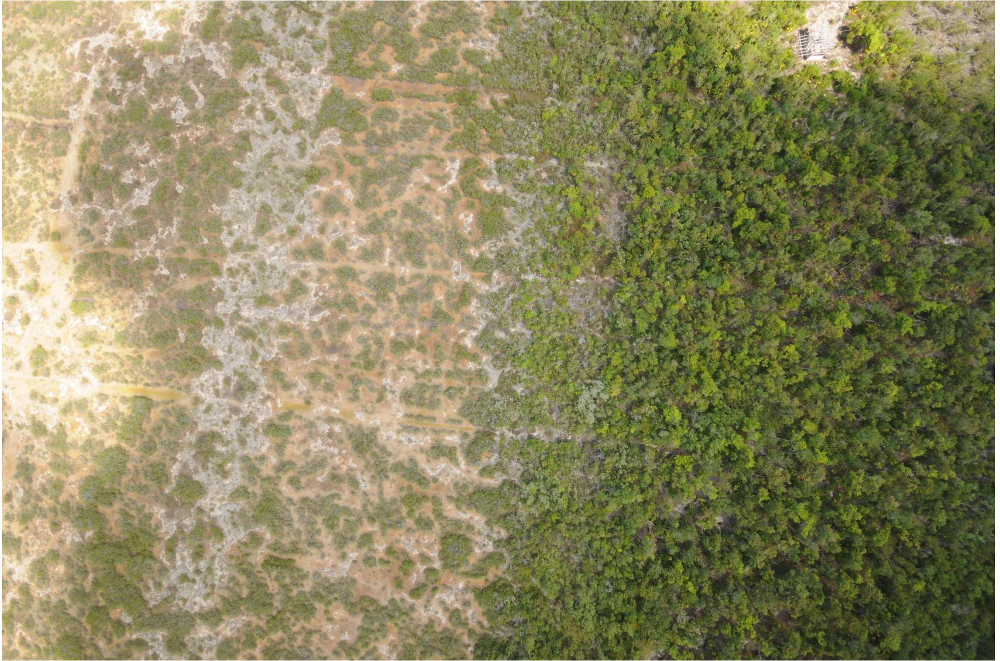
Fig. 5. Manglares de Chacmochuc, Quintana Roo. Fotografía aérea vertical.