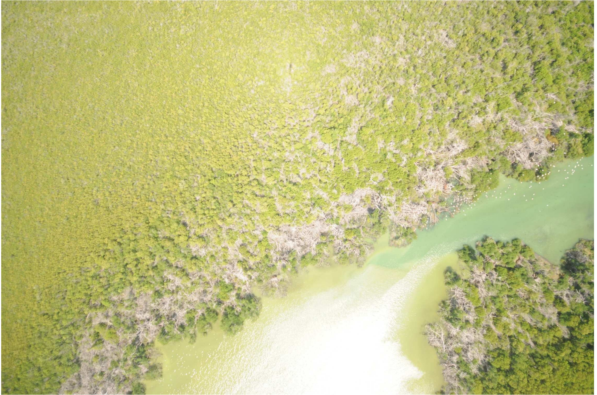
Fig. 6. Manglares de Chacmochuc, Quintana Roo. CONABIO – SEMAR / J. Díaz (2008). Fotografía aérea vertical.