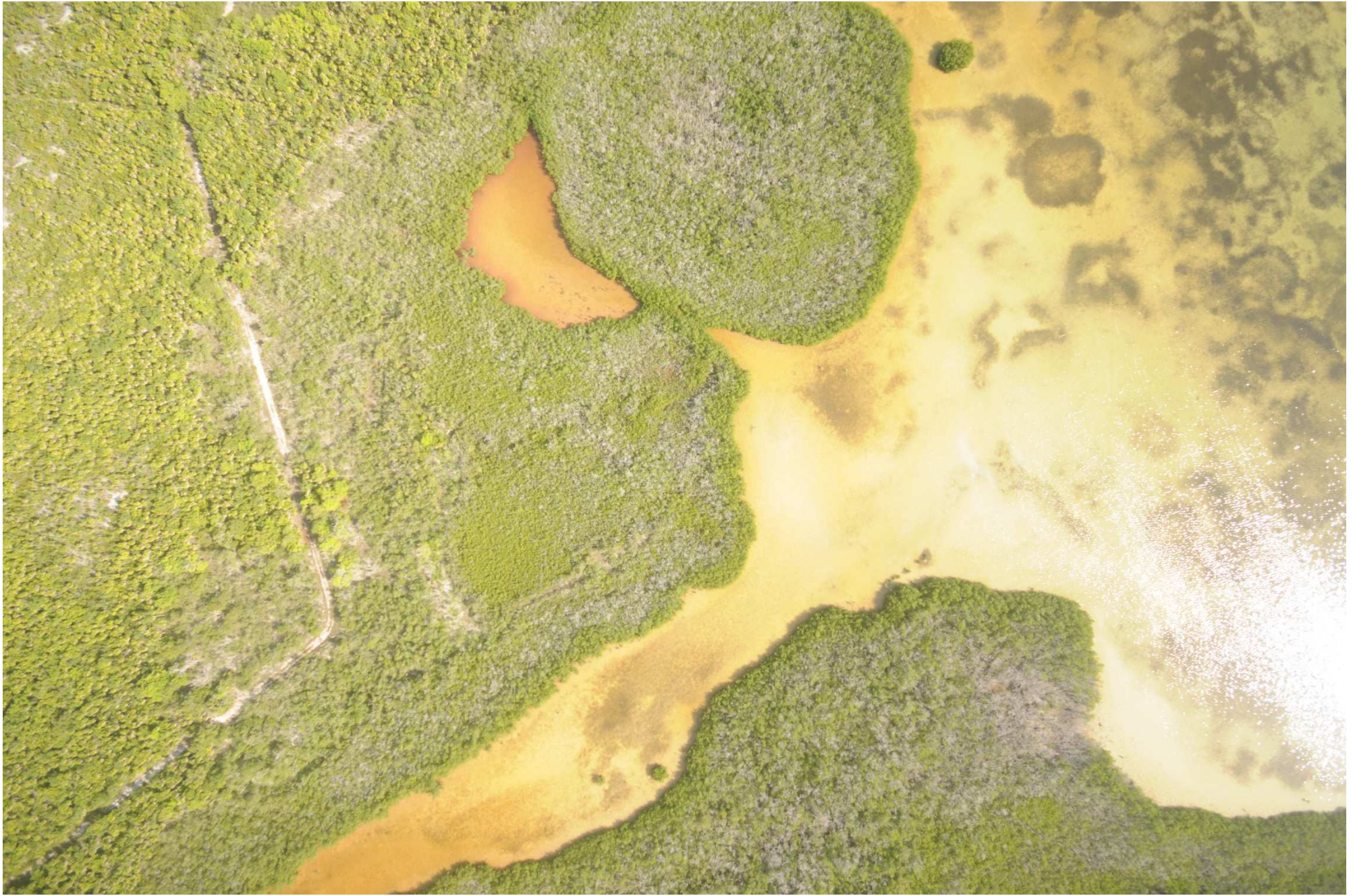
Fig. 8. Manglares de Chacmochuc, Quintana Roo. CONABIO – SEMAR / J. Díaz (2008). Fotografía aérea vertical.