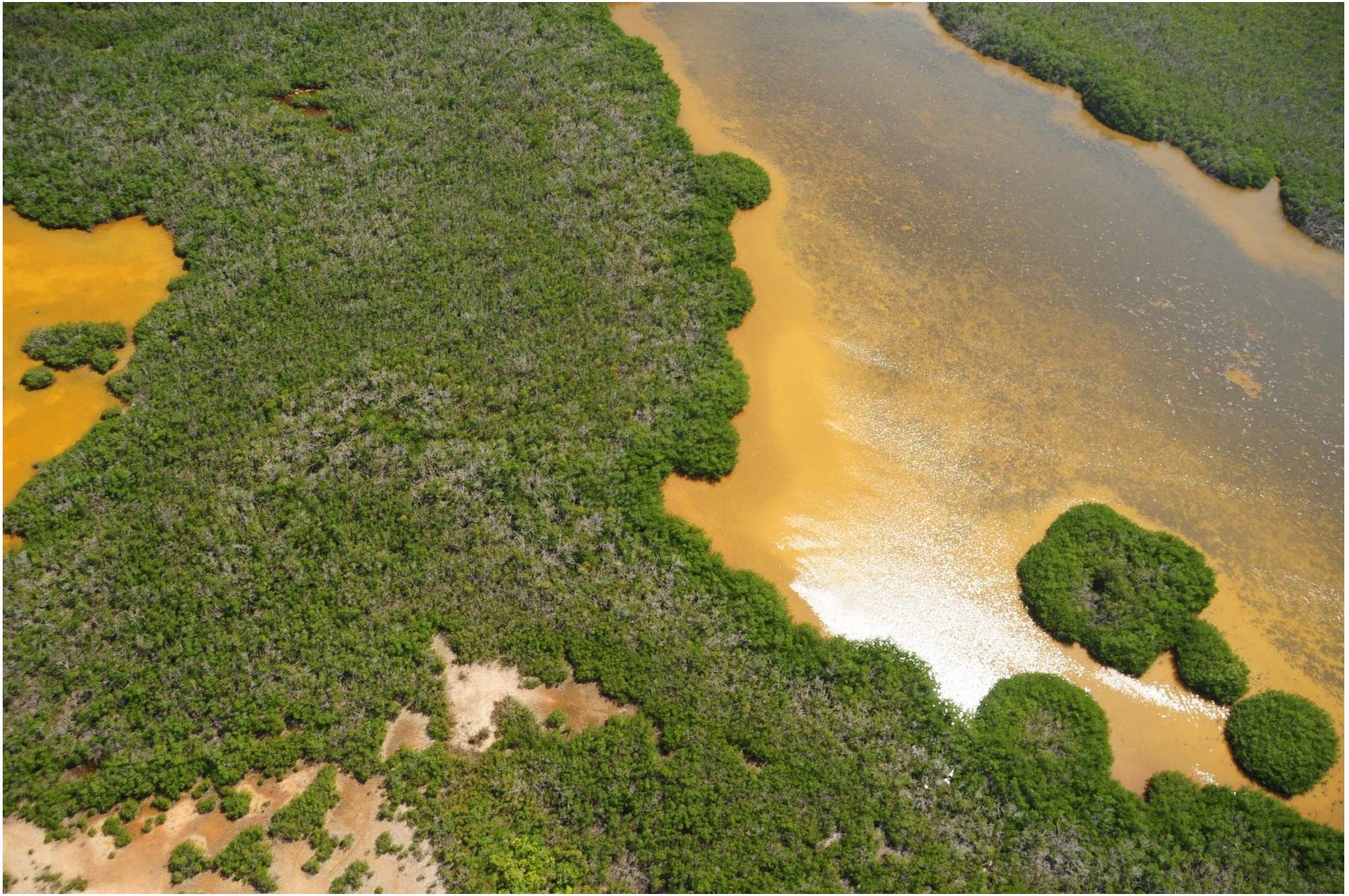
Fig. 3. Manglares de Chacmochuc, Quintana Roo. Fotografía aérea panorámica.