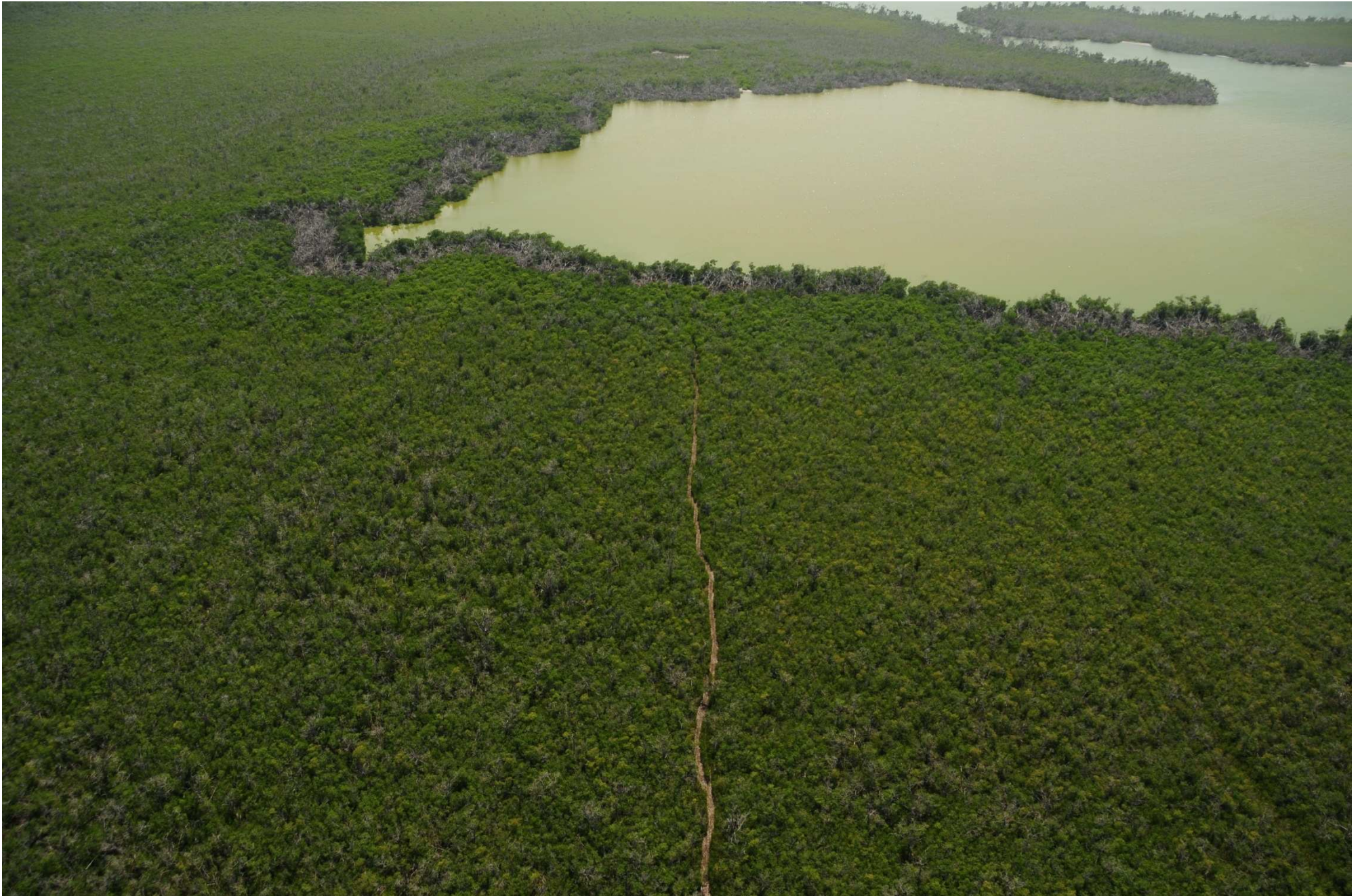
Fig. 1. Manglares de Chacmochuc, Quintana Roo. CONABIO – SEMAR / J. Acosta-Velázquez (2008). Fotografía aérea panorámica.