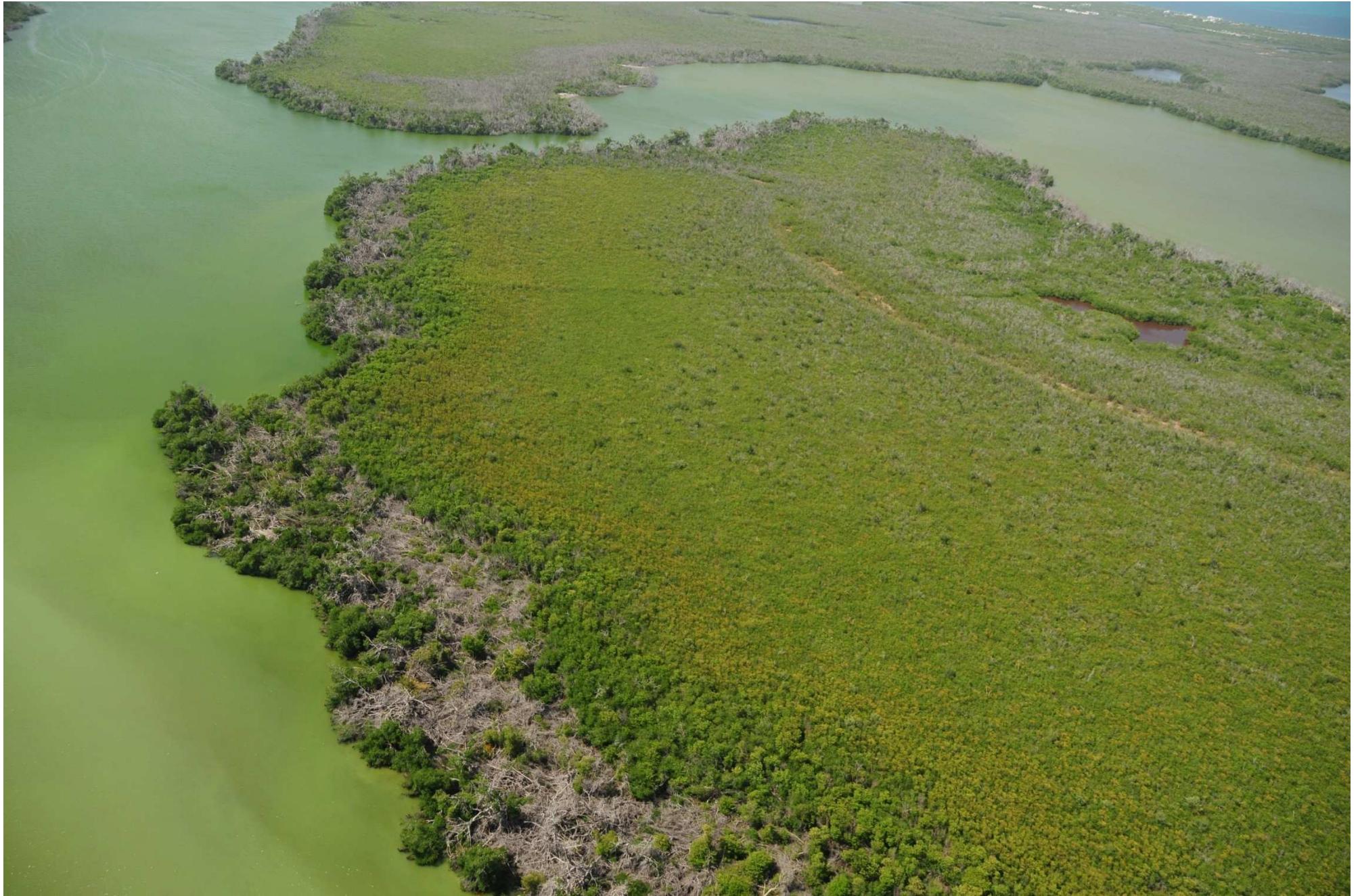
Fig. 2. Manglares de Chacmochuc, Quintana Roo. Fotografía aérea panorámica.