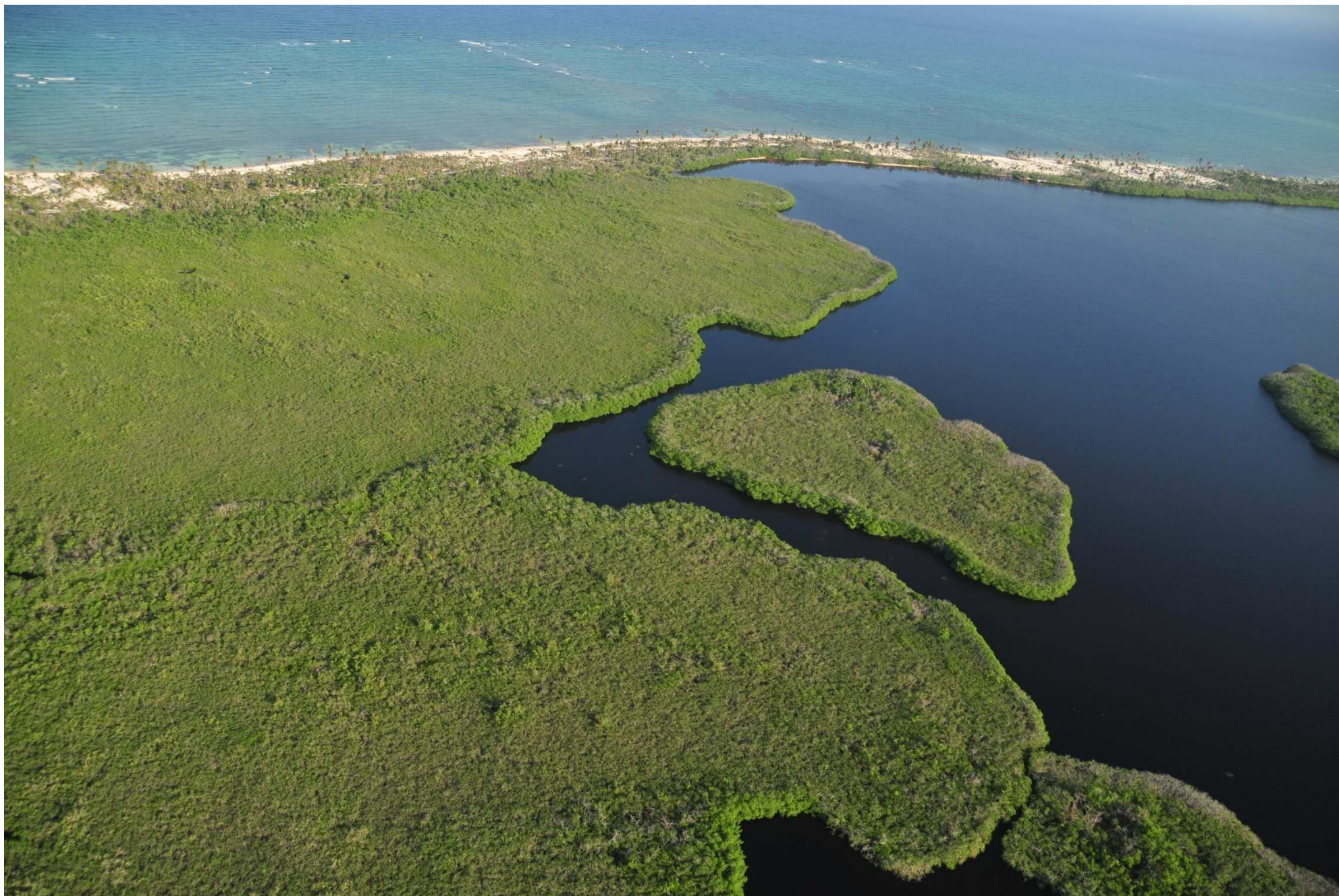
Fig. 1. Manglares de Costa Maya, Quintana Roo. Fotografía aérea panorámica.