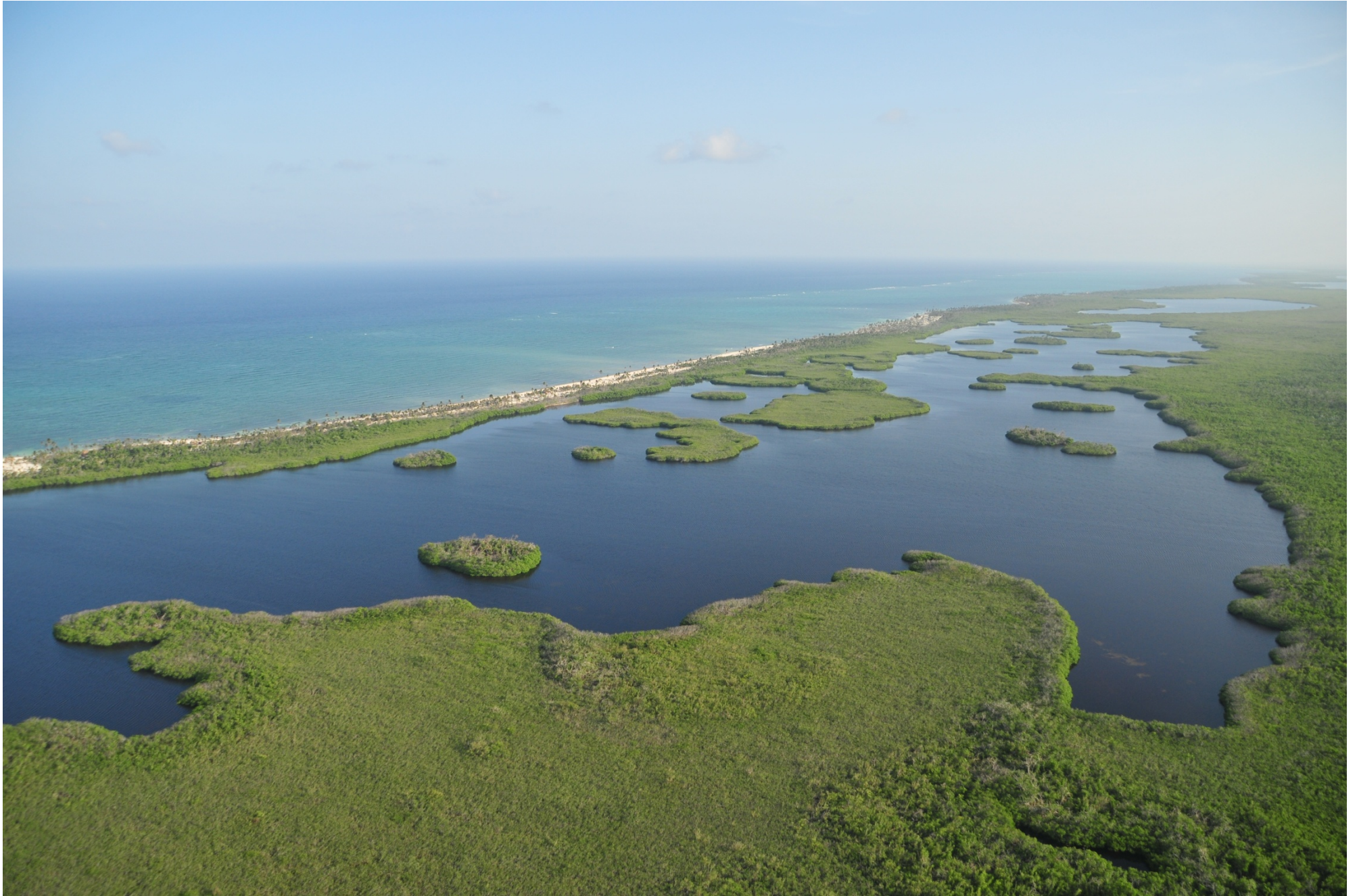
Fig. 2. Manglares de Costa Maya, Quintana Roo. Fotografía aérea panorámica.