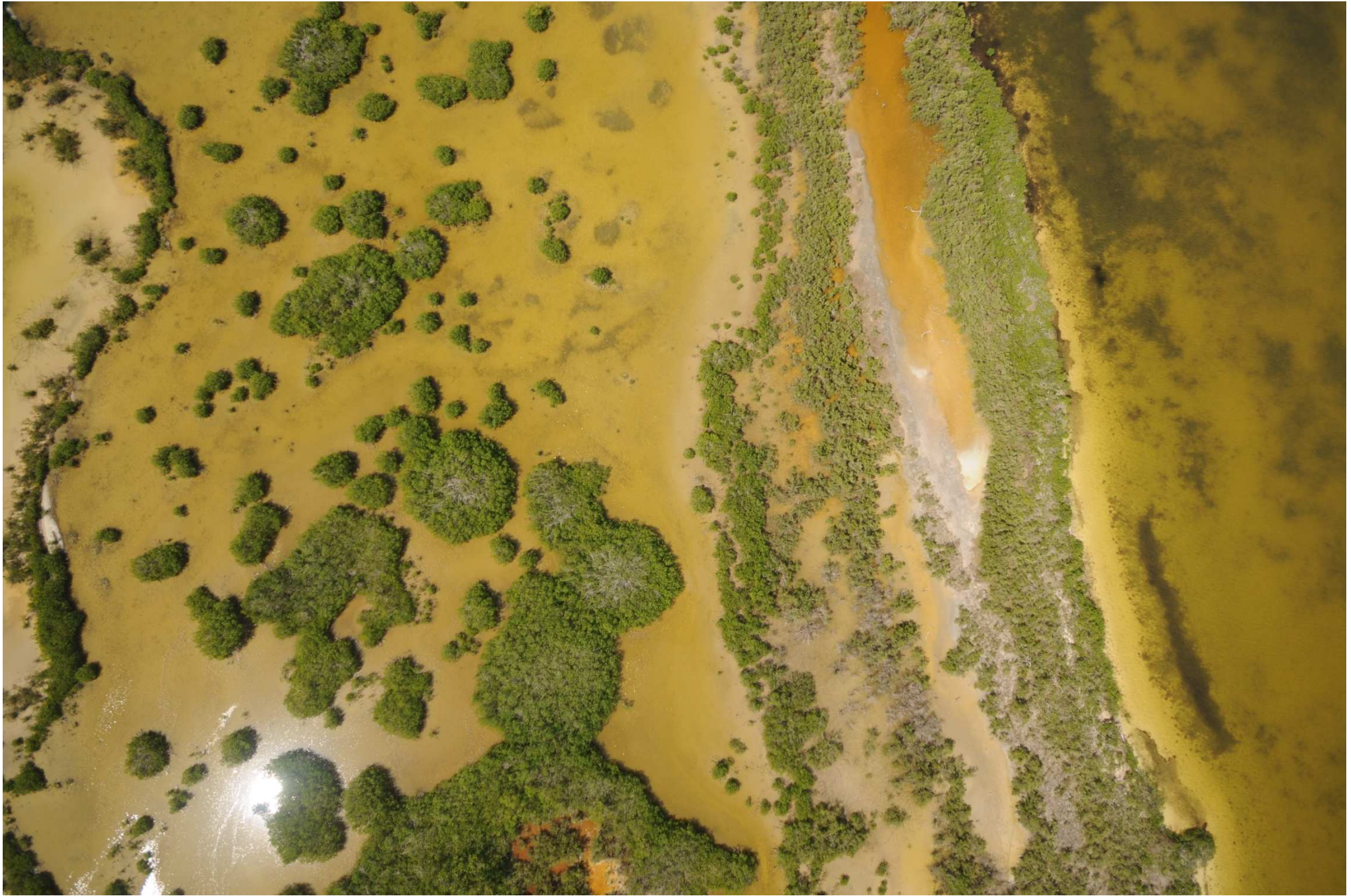
Fig. 7. Manglares de Costa Maya, Quintana Roo. Fotografía aérea vertical.