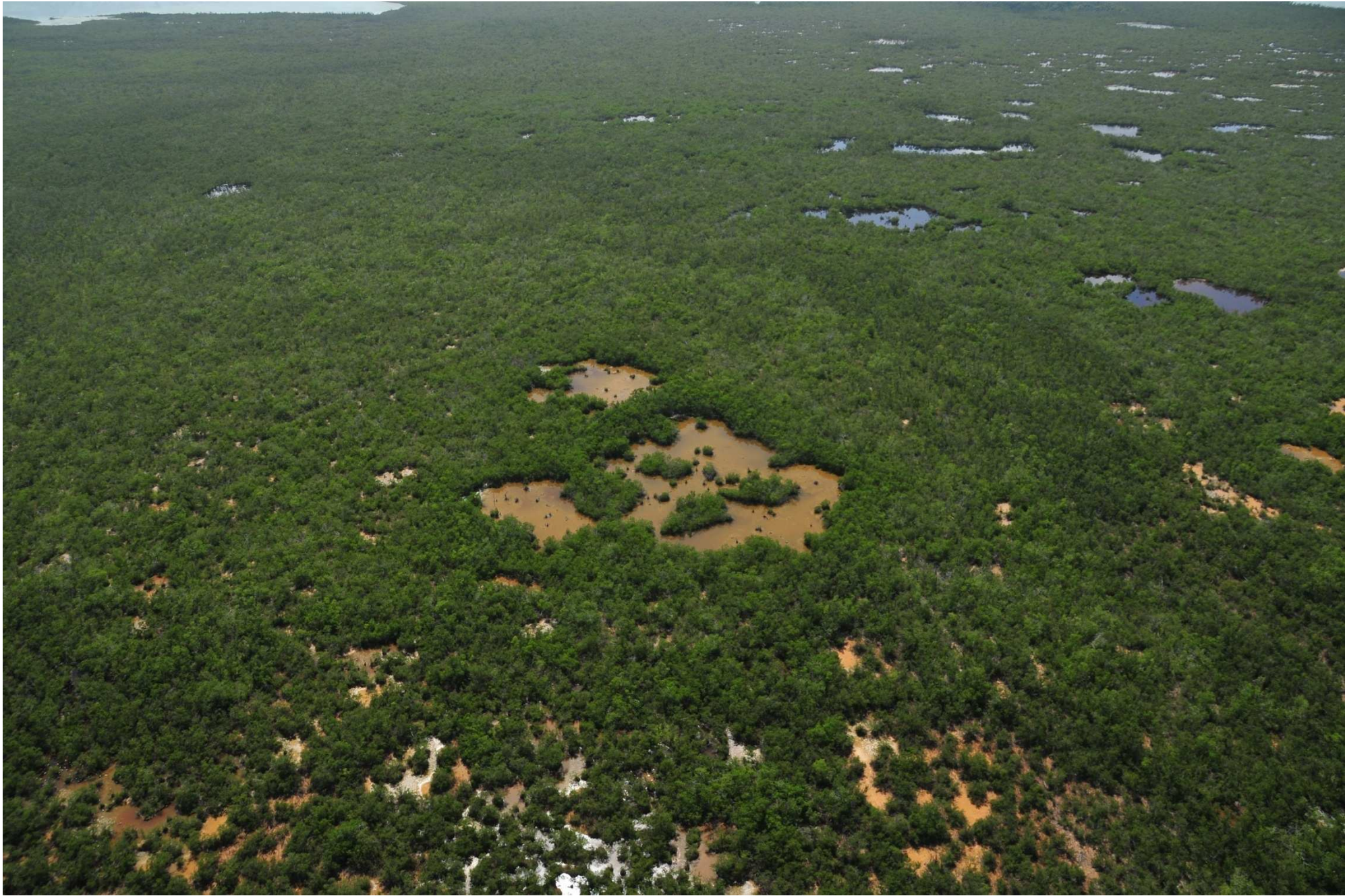
Fig. 4. Manglares de Costa Maya, Quintana Roo. CONABIO – SEMAR / J. Acosta-Velázquez (2008). Fotografía aérea panorámica.