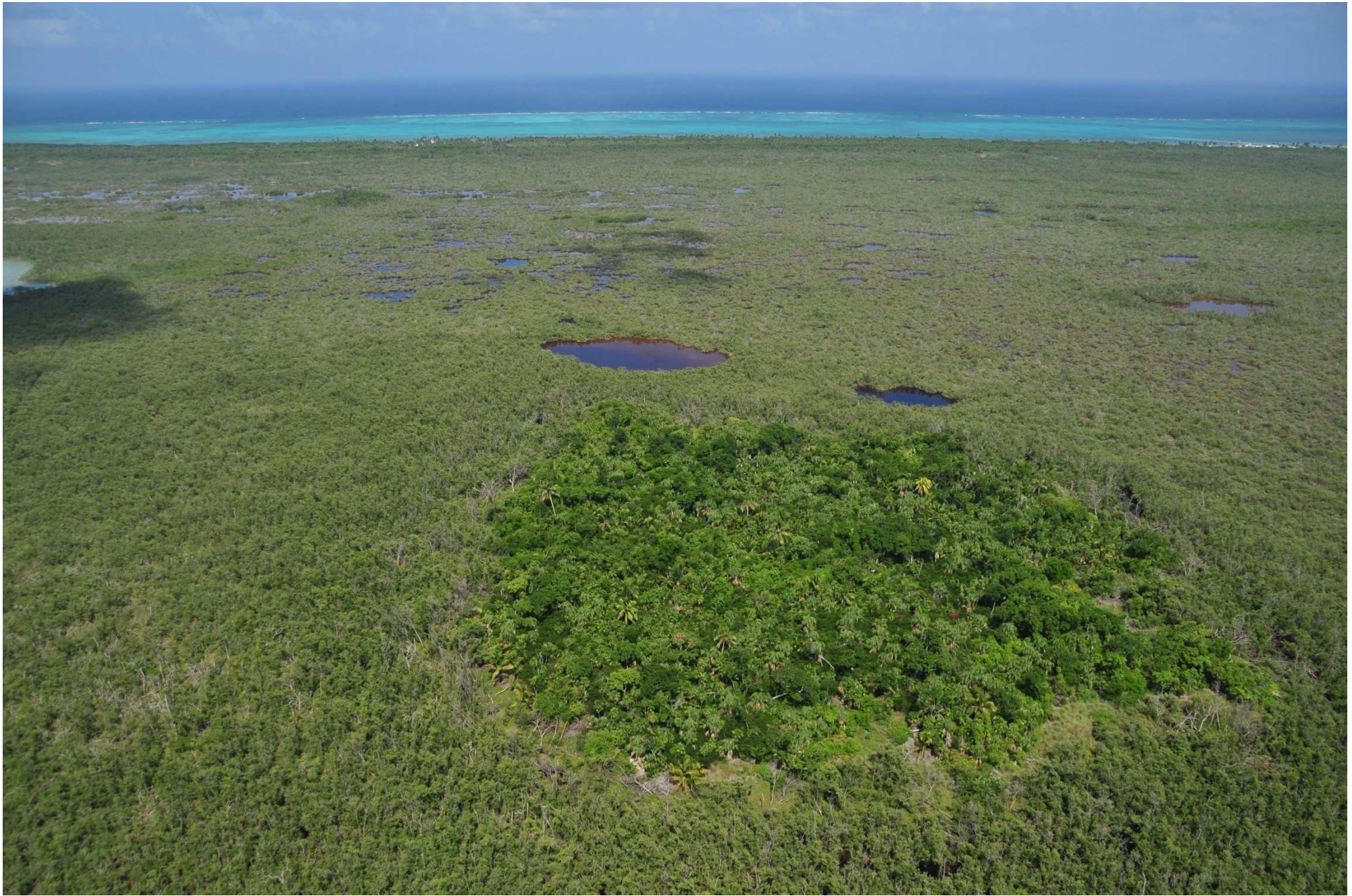
Fig. 3. Manglares y petenes de Costa Maya, Quintana Roo. Fotografía aérea panorámica.