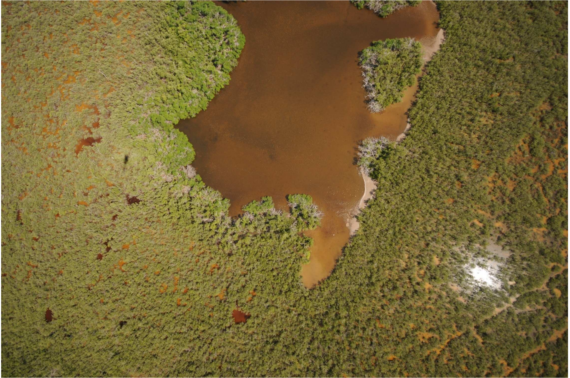
Fig. 5. Manglares de Costa Maya, Quintana Roo. CONABIO – SEMAR / J. Díaz (2008). Fotografía aérea vertical.