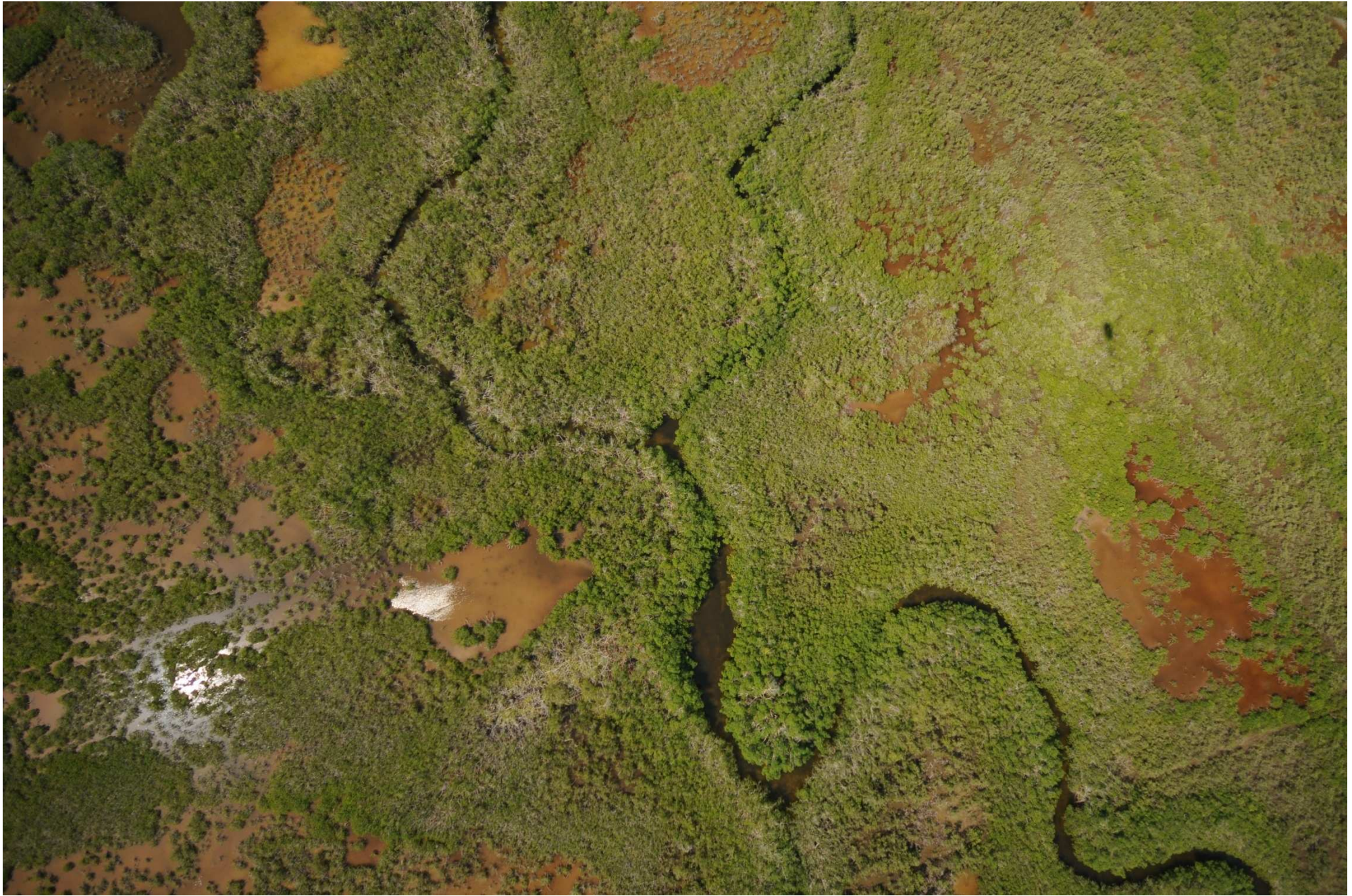
Fig. 8. Manglares de Costa Maya, Quintana Roo. Fotografía aérea vertical.