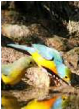
Con mucha luz (Sobreexpuesta)