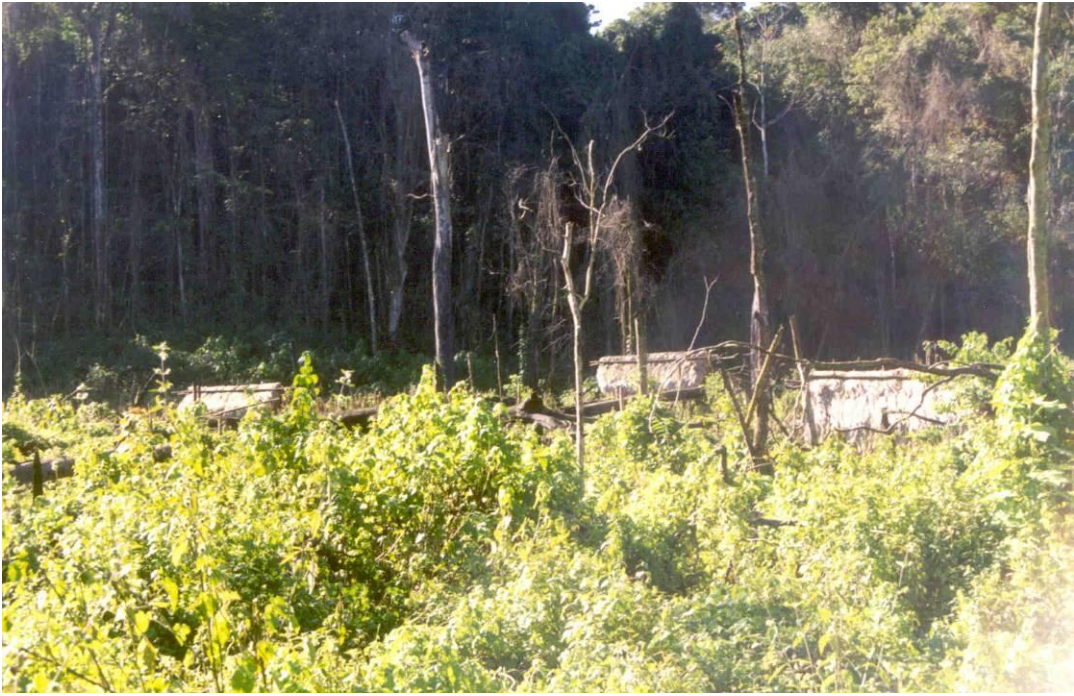
Nuevo Guadalupe Tepeyac