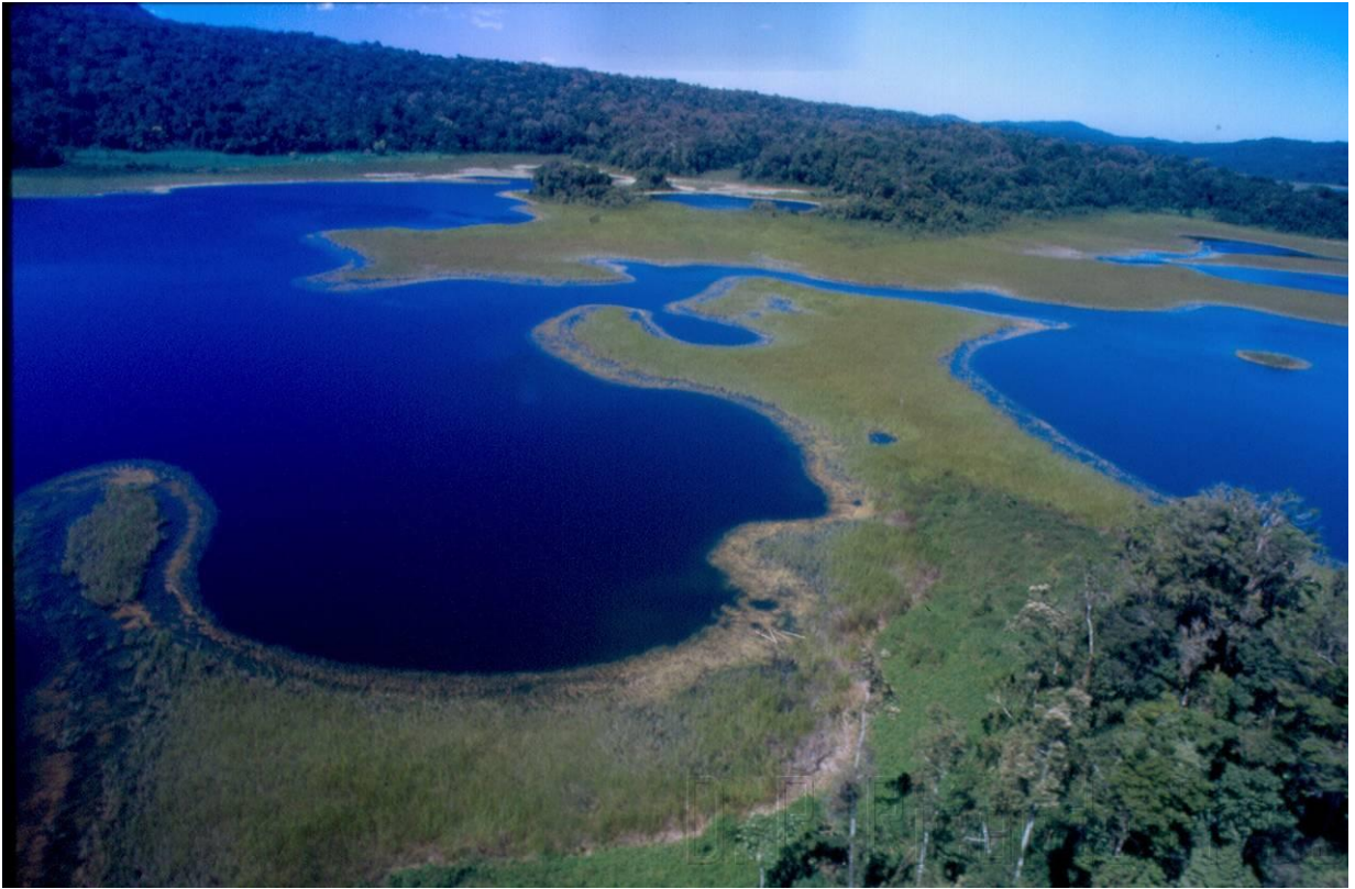
Laguna El Suspiro