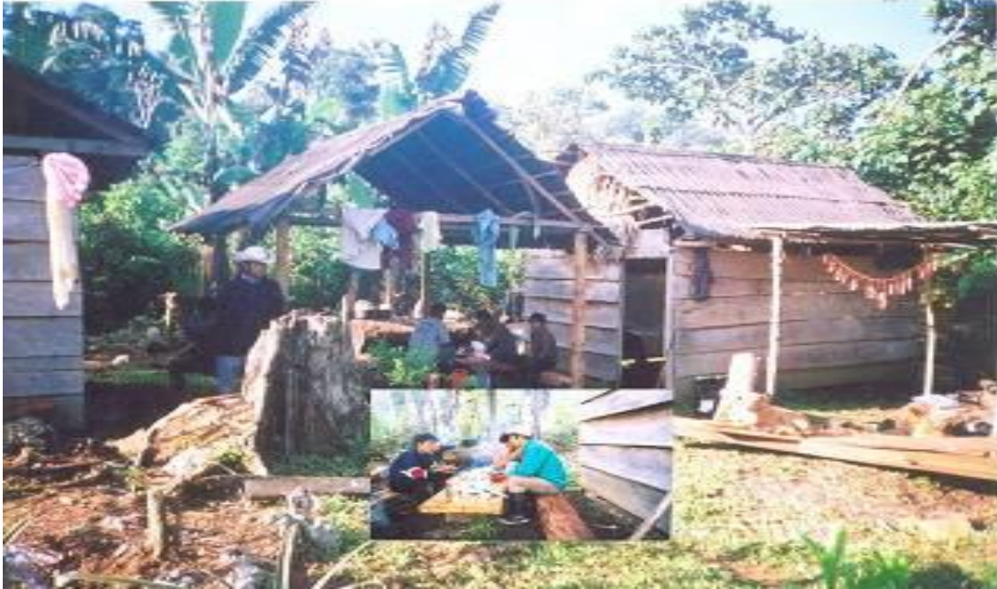
El Campamento en sus Inicios

(En baja resolución. En el envío del informe se incluyen en formato TIFF a 300 dpi junto con la base de datos)