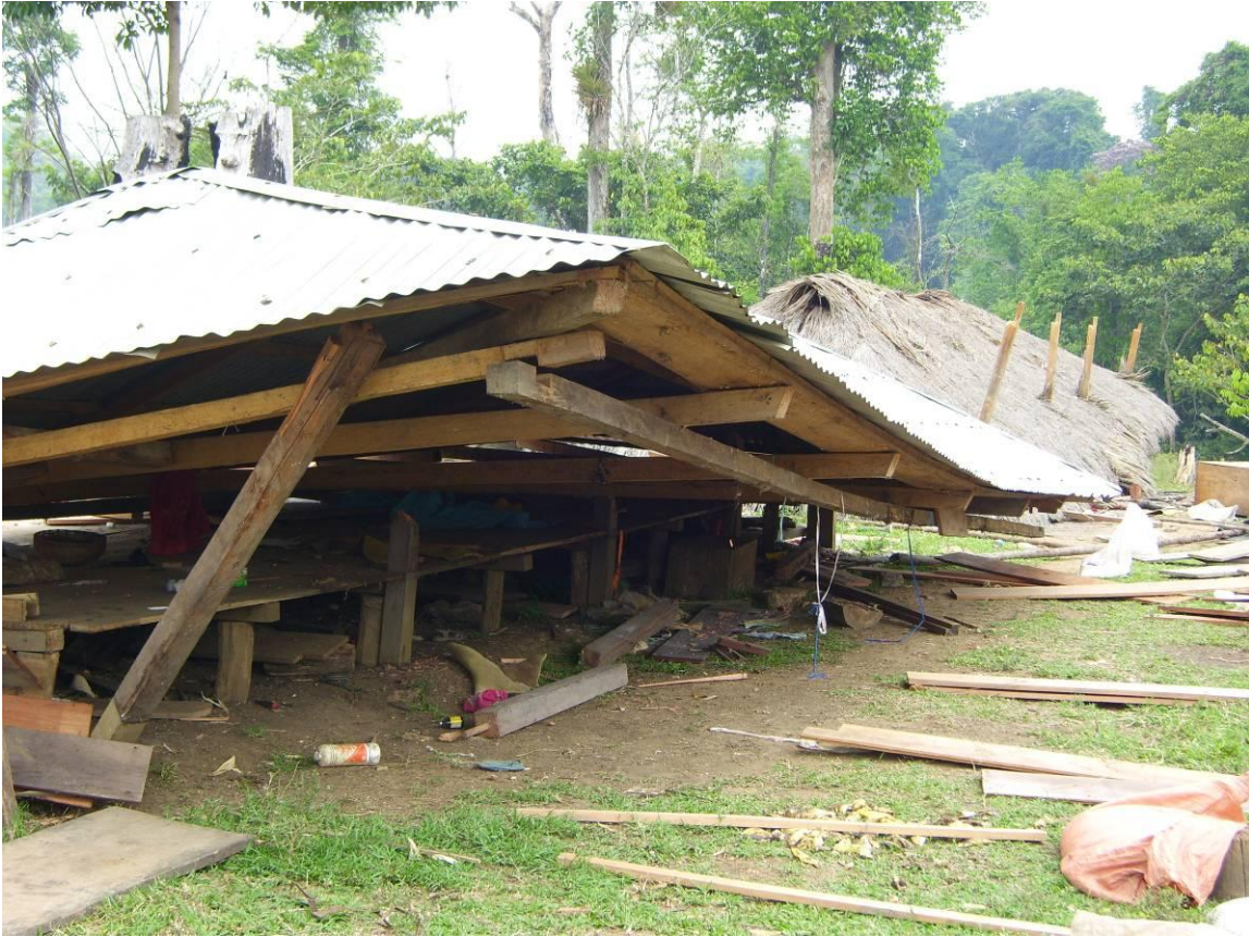
Derribe de Chozas