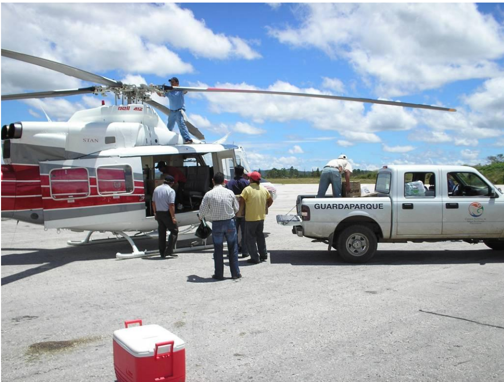
Abastecimiento del Campamento