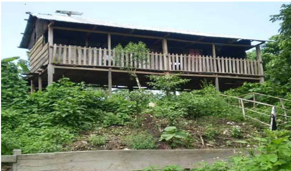
Condiciones en la Actualidad