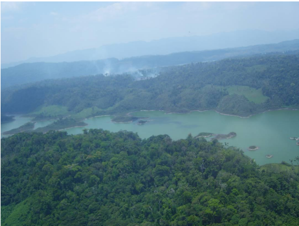
Trabajaderos y Quemas