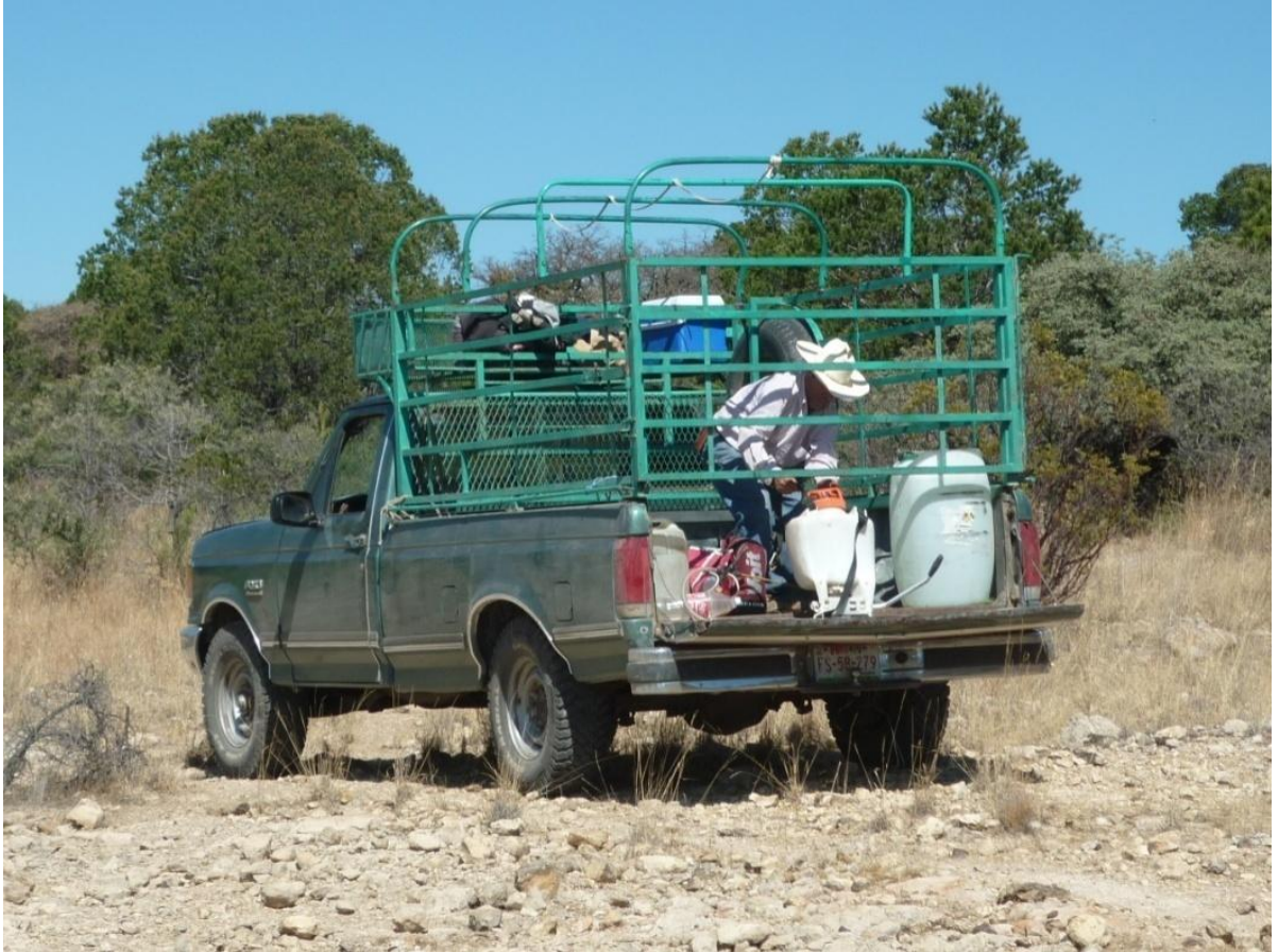
Foto1. Personas del NCPE, llenando mochilas aspersores.