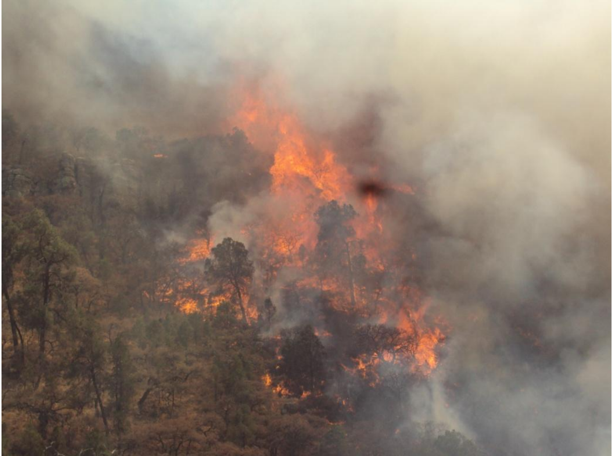
Foto5. Coronamiento del incendio en el Arroyo el Hondo, NCPE San Francisco Javier, Municipio de Vicente Guerrero, Dgo.