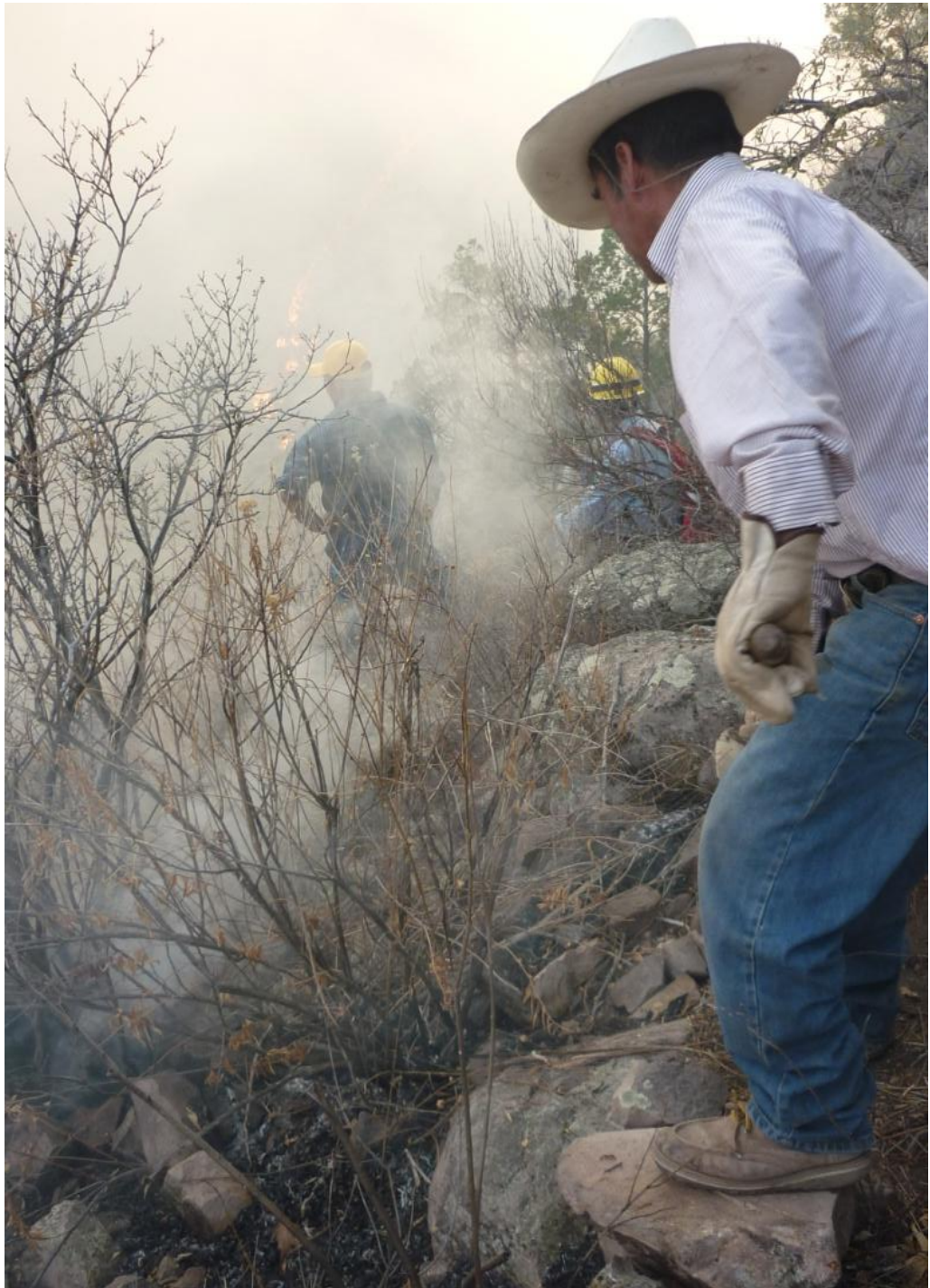
Foto 2. Personas del NCPE en combate directo.