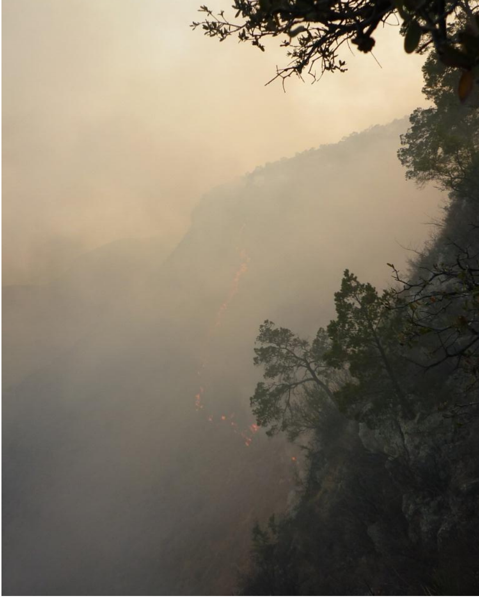
Foto 4. Frente sureste del incendio.