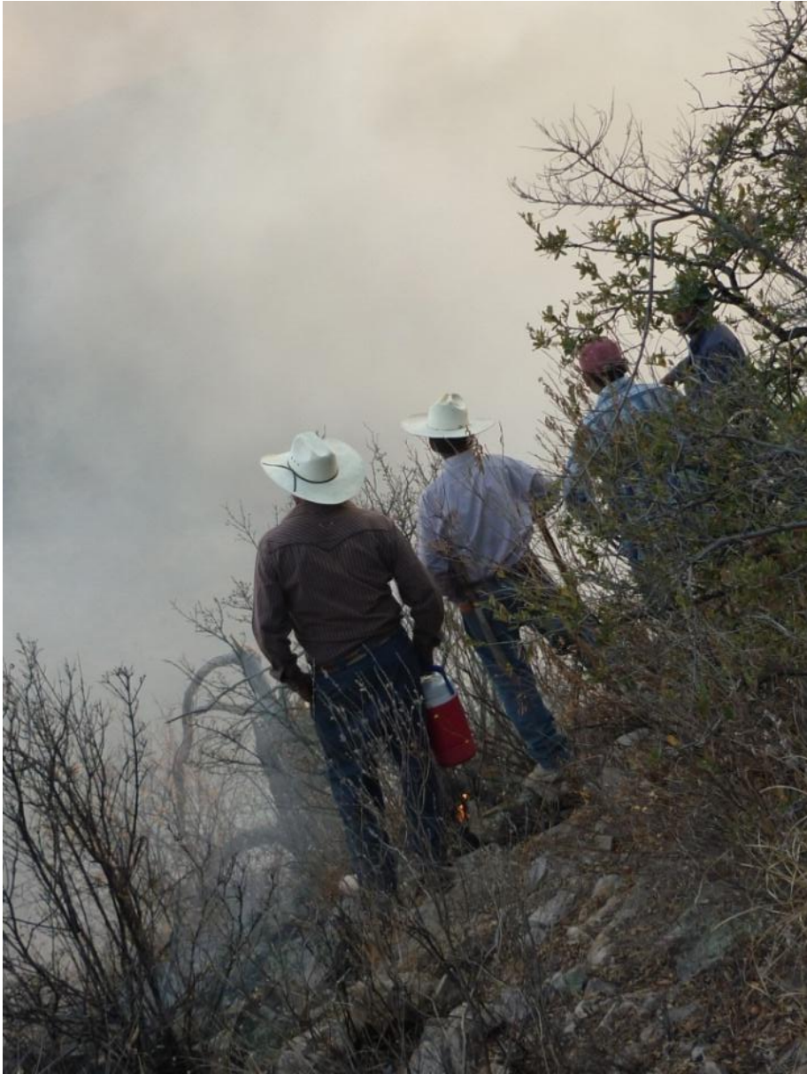
Foto 3. Personal supervisando el área controlada.