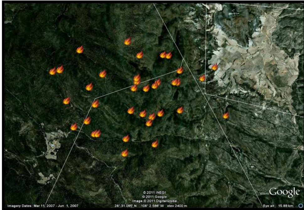
Monitoreo del Incendio, puntos de calor.