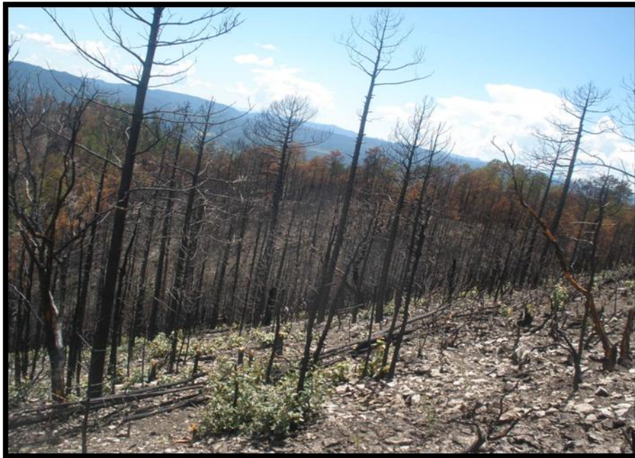
Áreas afectadas de arbolado adulto