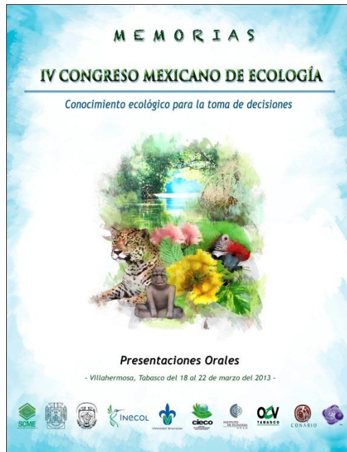
Portada de las Memorias de las Presentaciones Orales