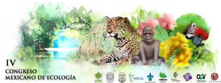
Cintillo / Membrete