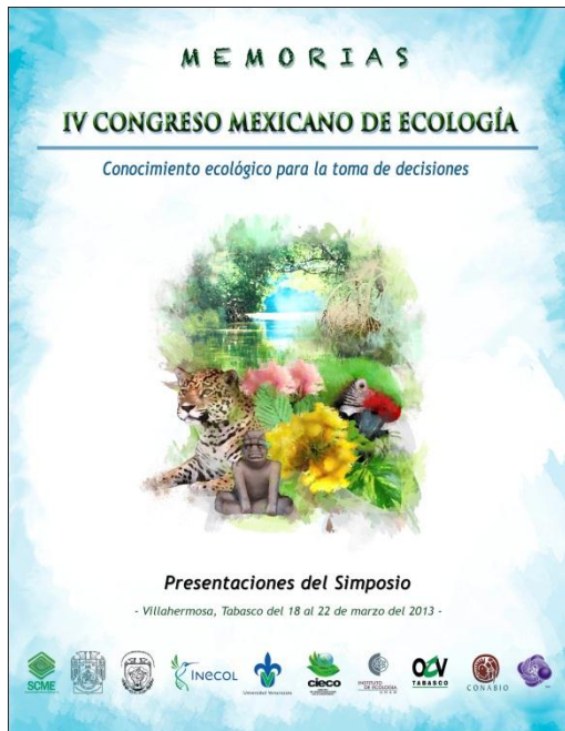
Portada de las Memorias de las Presentaciones del Simposio