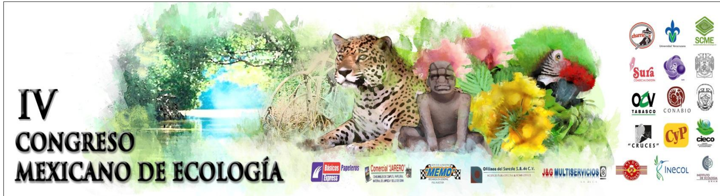
Banner o Display