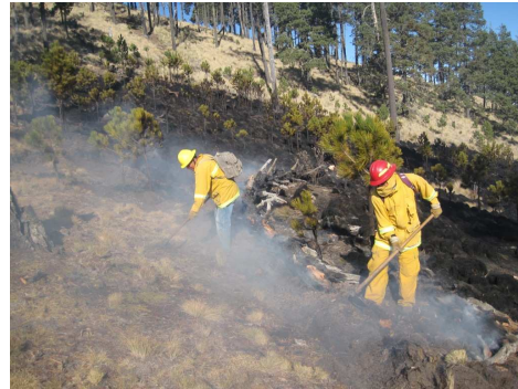
Brigadistas finiquitando el incendio con herramienta especializada