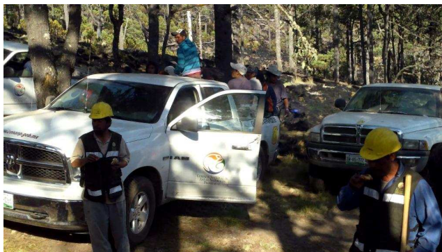
Brigadistas después de haber sofocado el fuego en el Cerro Gordo y Río Valiente