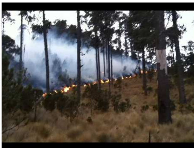
Frente oeste del incendio de Río Valiente