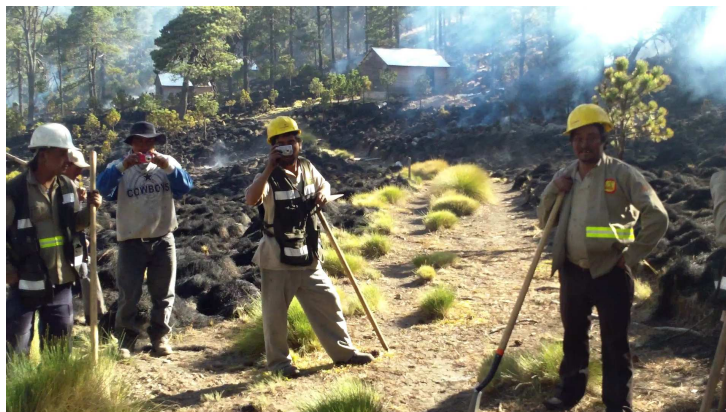
Brigadistas después de haber sofocado el fuego en el Cerro Gordo y Río Valiente