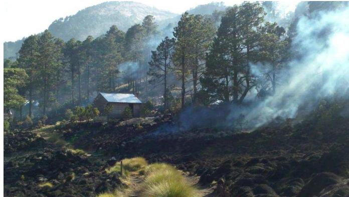
Pastizales y bosque de Pinus hartwegii afectado por el incendio.