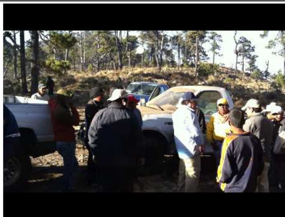
Reunión final con personal de CONAFOR, instituciones, voluntarios y brigadas. Declaratoria de fuego controlado.