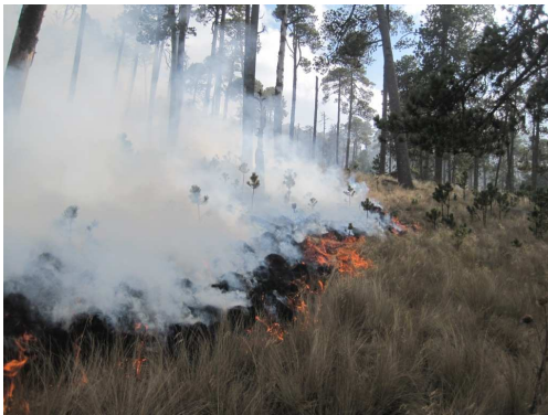
Área de regeneración natural afectada por el incendio.