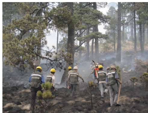
Integrantes de la brigada PROVICOM de CONANP.