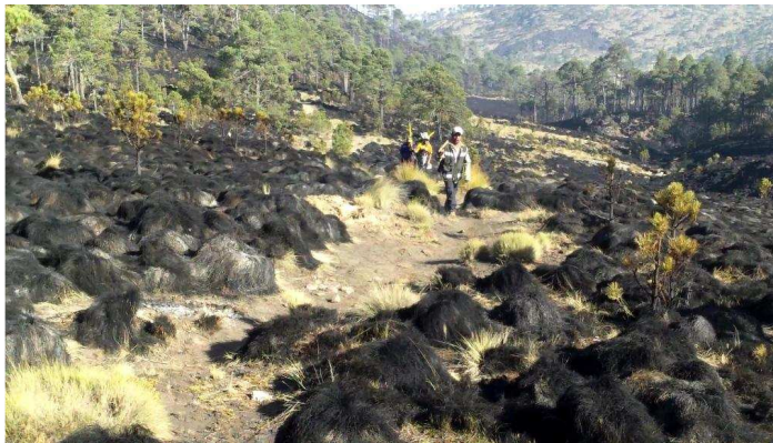
Brigadistas después de haber sofocado el fuego en el Cerro Gordo.