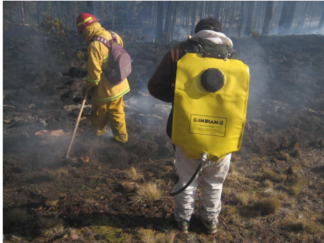
Brigadistas finiquitando el incendio con equipo especializado