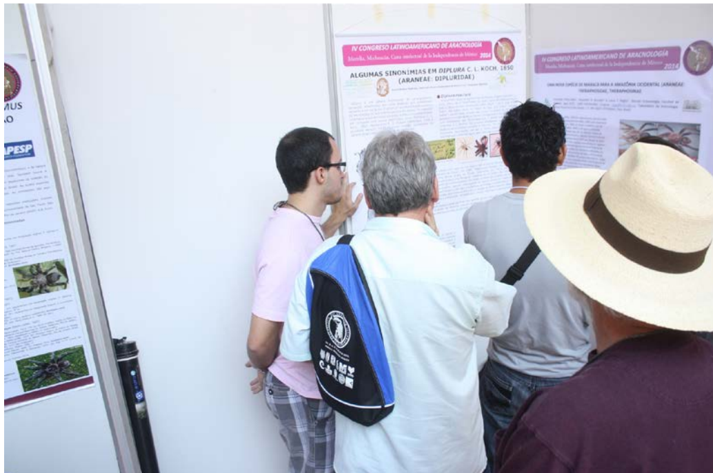
Sesión de carteles donde un asistente porta la mochila del Congreso.