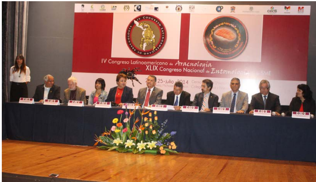
Presidium del acto inaugural