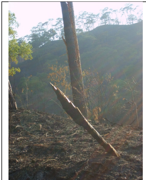
Astillas provocadas por la descarga eléctrica.

Cabe señalar que las autoridades del ejido manifiestan que la causa del incendio fue la descarga eléctrica ocasionada por un rayo, situación que fue corroborada por el jefe de la brigada.