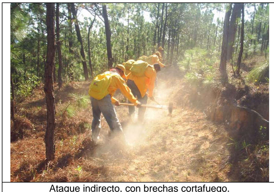
Ataque indirecto, con brechas cortafuego.

Se afectaron 350 hectáreas de las cuales 290 son de bosques de pino, 30 de bosques de encino y 30 de selva baja caducifolia, siendo el siniestro de tipo superficial, afectando pastizales, arbustos y matorrales, bajo bosque de pino, bosques de encino y selva baja Caducifolia.