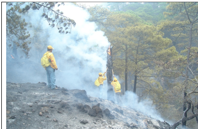
Brigada realiza labores de liquidación