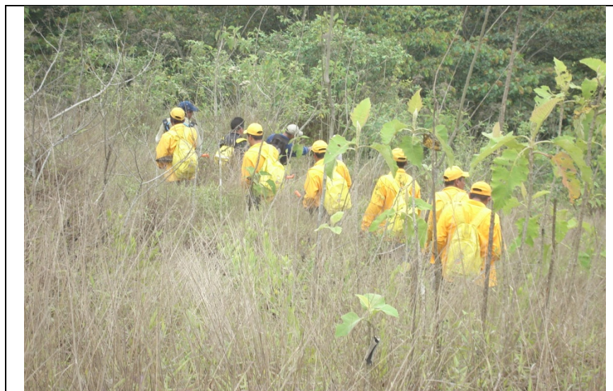
Debido a que para llegar a este incendio no hay brechas, el acceso se realizó a pie.

Por las condiciones de clima, los vientos ocasionaron que alrededor de las 14:00 horas nuevamente el incendio se saliera de control, quedando activo por la tarde con dos frentes, por lo que por seguridad del personal combatiente alas 16:30 horas se tomo la determinación de iniciar actividades de combate para el siguiente día.