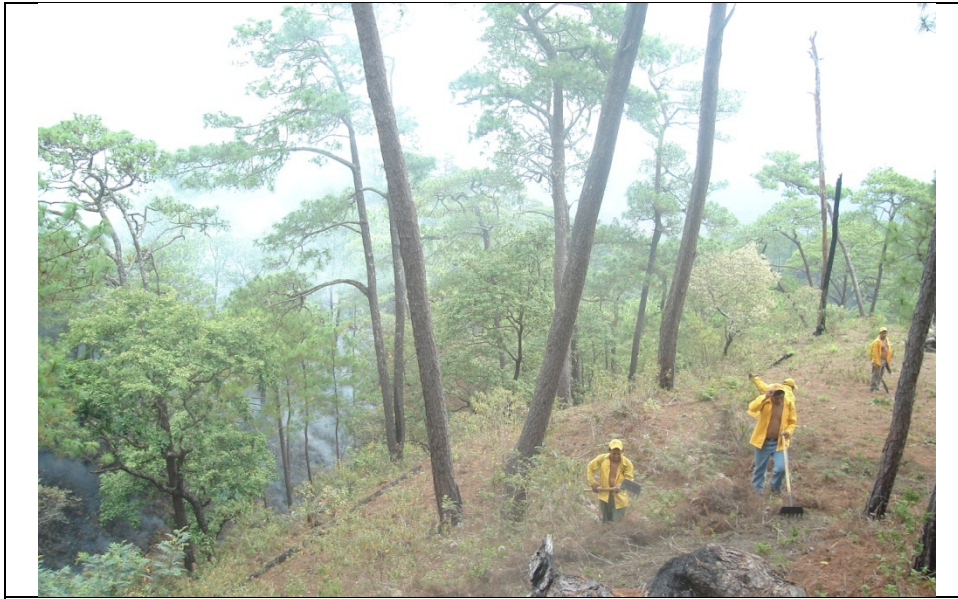
El terreno tiene pendientes fuertes que combinado con el viento complicaron la situación

Por tanto, las acciones continuaron al siguiente día 16 de abril. Para este día se contó con el apoyo de la brigada del Ayuntamiento de Jiquipilas, en este día a pesar de lo difícil se logro el control de incendio, únicamente se quedo un sitio de difícil acceso con el combustible ardiendo dado que las brigadas no pudieron acceder al lugar. Por lo que dicho incendio quedó en observación, para su posterior liquidación. Durante este día el equipo aéreo apoyo el traslado hacia la zona del incendio y la desmovilización de los combatientes; esto sin duda ayudo mucho al trabajo realizado por nuestros brigadistas.