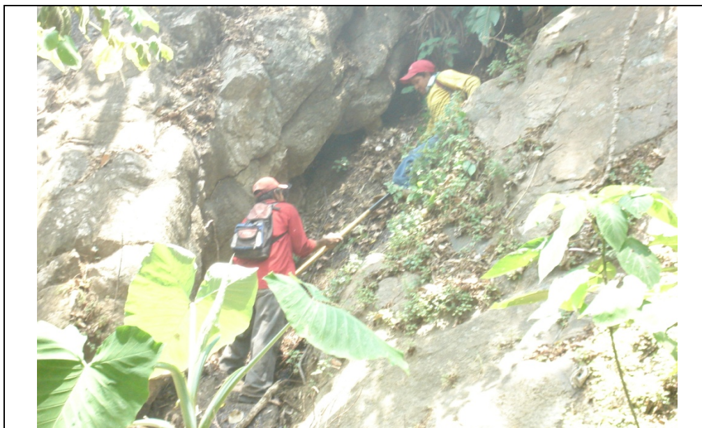
El acceso al lugar fue difícil, en terrenos muy peligrosos

Por tanto, las acciones continuaron al siguiente día 16 de abril. Para este día se contó con el apoyo de la brigada del Ayuntamiento de Jiquipilas, en este día a pesar de lo difícil se logro el control de incendio, únicamente se quedo un sitio de difícil acceso con el combustible ardiendo dado que las brigadas no pudieron acceder al lugar. Por lo que dicho incendio quedó en observación, para su posterior liquidación. Durante este día el equipo aéreo apoyo el traslado hacia la zona del incendio y la desmovilización de los combatientes; esto sin duda ayudo mucho al trabajo realizado por nuestros brigadistas.