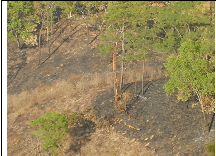
Árbol dañado por rayo.

Para el 23 de abril del mismo año, al constituirnos en el lugar del incendio la brigada fue informada que por la noche había llovido muy fuerte y que ayudo a sofocar el incendio, por lo que este día se hicieron labores de liquidación, quedando el incendio controlado siendo aproximadamente 7:15, con un saldo de oficial de 162-00-00 hectáreas afectadas de pastos y hierbas bajo arbolado de pino.