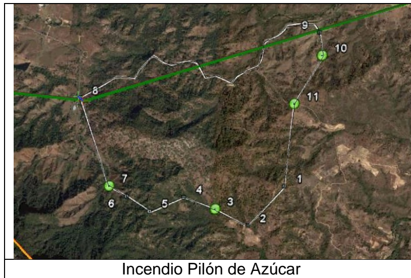
Incendio Pílon de Azúcar

Para el control del incendio se realizó combate directo e indirecto con el establecimiento de brechas y utilización de contrafuego en algunos donde quedaban zonas en donde el fuego avanzaría hasta el sitio donde existen condiciones para el establecimiento de una brecha cortafuego o una barrera natural. El incendio finalmente quedó liquidado siendo las 17:00 horas del día 17 del presente año, con 33 horas a de combate aproximadamente.