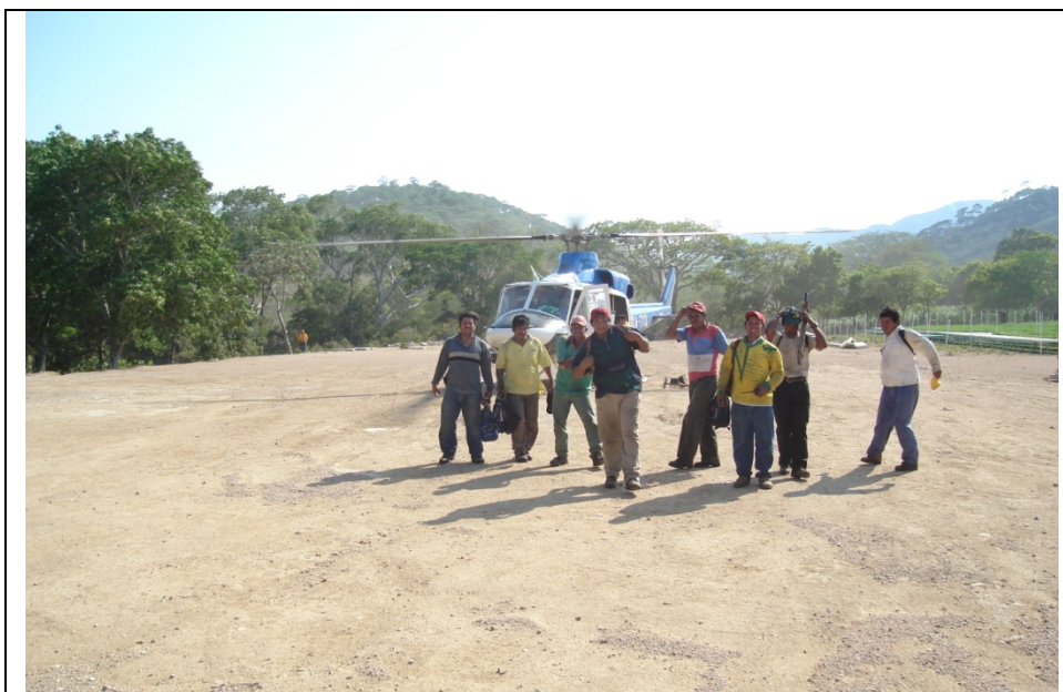
Por lo inaccesible del incendio se necesitó apoyo aéreo.

Este incendio fue combatido inicialmente por personal de la COFOSECH y CONAFOR de la Región 09 Istmo Costa, quienes reportaban un 90% de control en el primer día de combate; consideraron quedarse en la zona del incendio pero debido a las condiciones del tiempo a las 24:00 horas decidieron bajar del incendio y trasladarse a Tonalá. Al día siguiente el incendio continuo sin control debido a que las ráfagas de viento oscilaban entre 20 y 60 Km/h; fue en este día que se integro la CONANP (debido a que inicialmente se atendiendo un incendio en la zona de La Bondad en Arriaga) y los compañeros de CONAFOR y COFOSECH de Cintalapa con quienes se continuaron las actividades de combate; Durante este día el incendio continuo sin control, a pesar del arduo trabajo de las brigadas, por las condiciones de viento mencionadas.