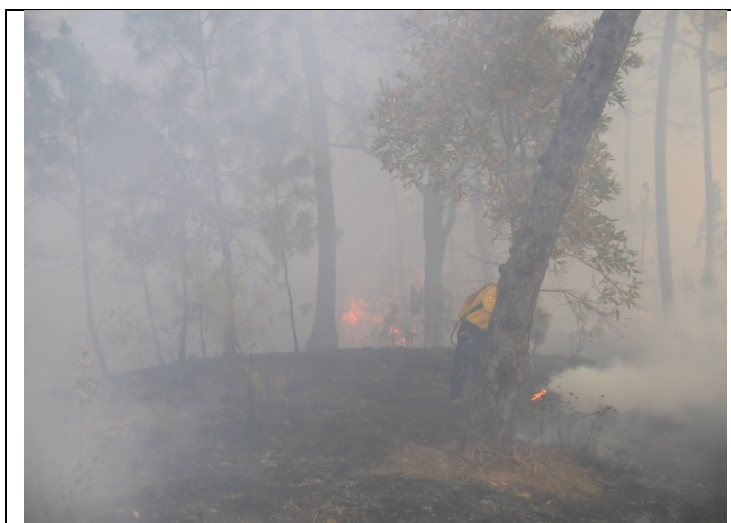
Se realizaron actividades de liquidación del incendio.

Este incendio por las coordenadas tomadas, se ubica en la Zona de Amortiguamiento de la REBISE, en total el siniestro afecto 25-00-00 hectáreas de bosques de pino-encino, siendo de tipo superficial lo que ocasionó afectación en pastos y hierbas, bajo la vegetación señalada.