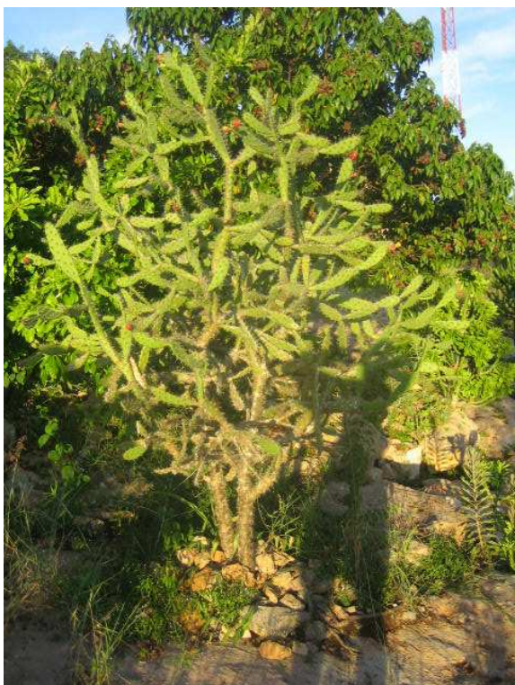
Opuntia (Nopalea) auberi es una de las tres Opuntiae nativas en la península de Yucatán.