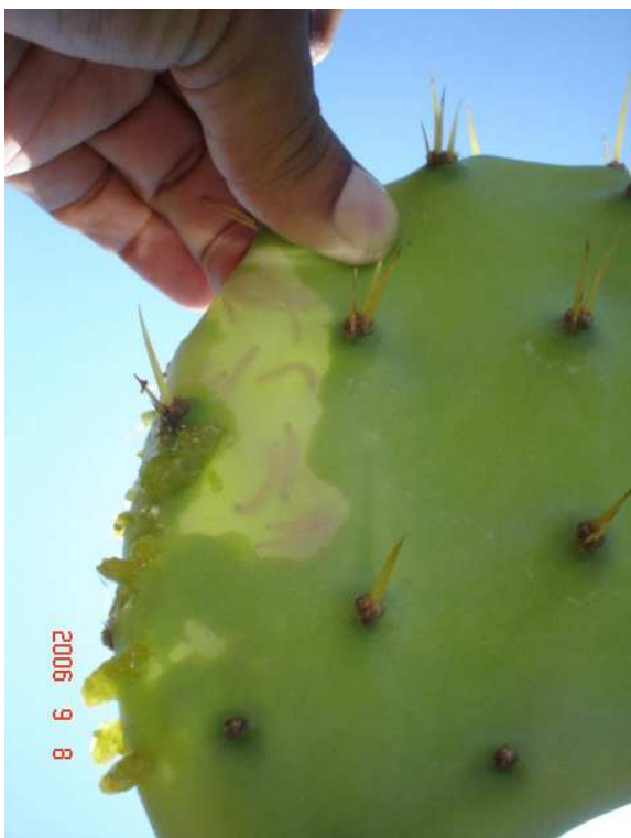
Daño típico causado por la alimentación de Cactoblastis cactorum en una Opuntia dillenii en Isla Mujeres.