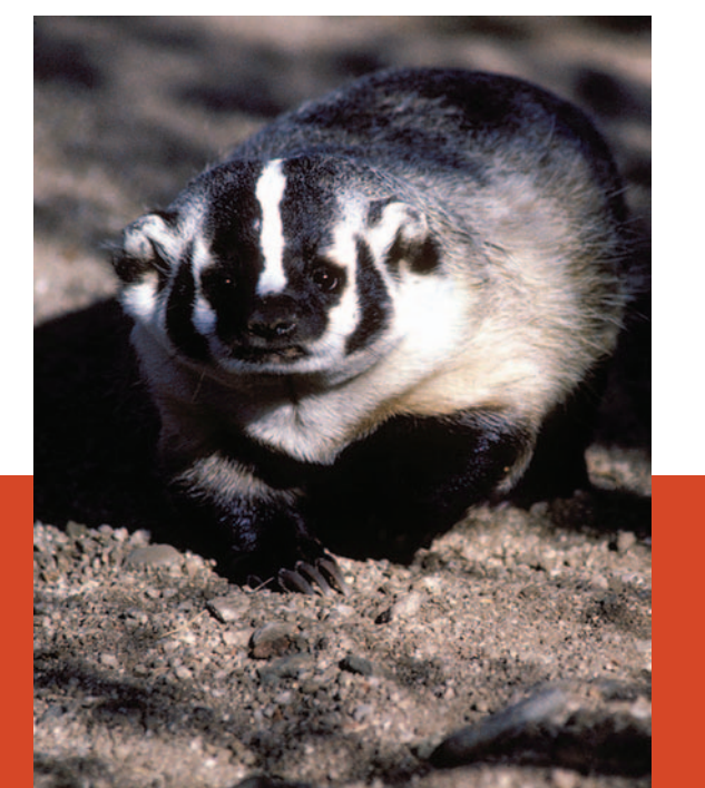
Tejón. Vive en zonas desérticas y usa sus garras para cavar complicadas madrigueras.