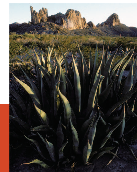
Bolsón de Mapimí. Poca lluvia e intenso calor convirtieron en desierto antiguos lagos.