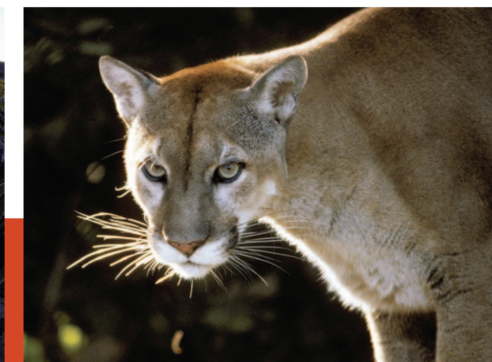
Puma. Es el segundo felino más grande de América; este gran cazador nocturno se alimenta principalmente de venados, tejones, jabalíes y aves.