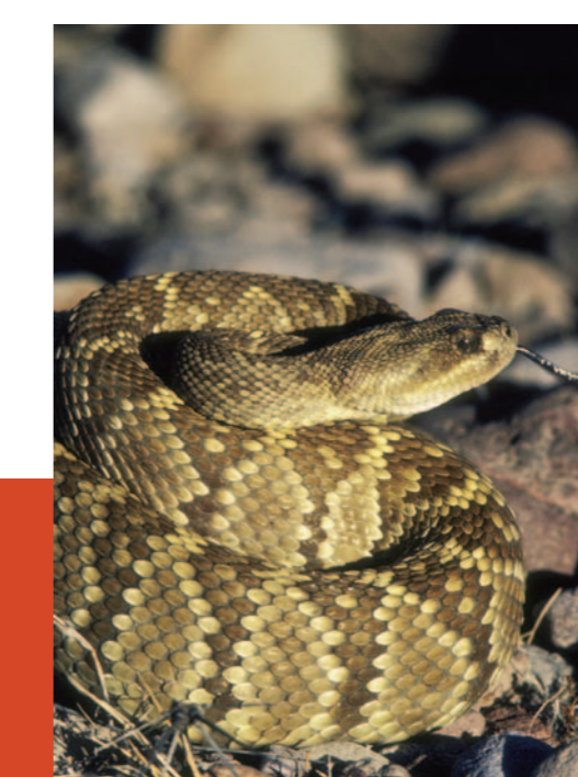
Víbora de cascabel. Serpiente venenosa que tiene en la cola una sonaja de zumbido inconfundible.