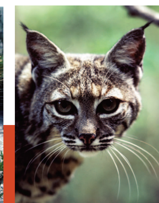
Gato montés. Timido y nocturno, caza y vive solo. Se alimenta de ratones, conejos y liebres.