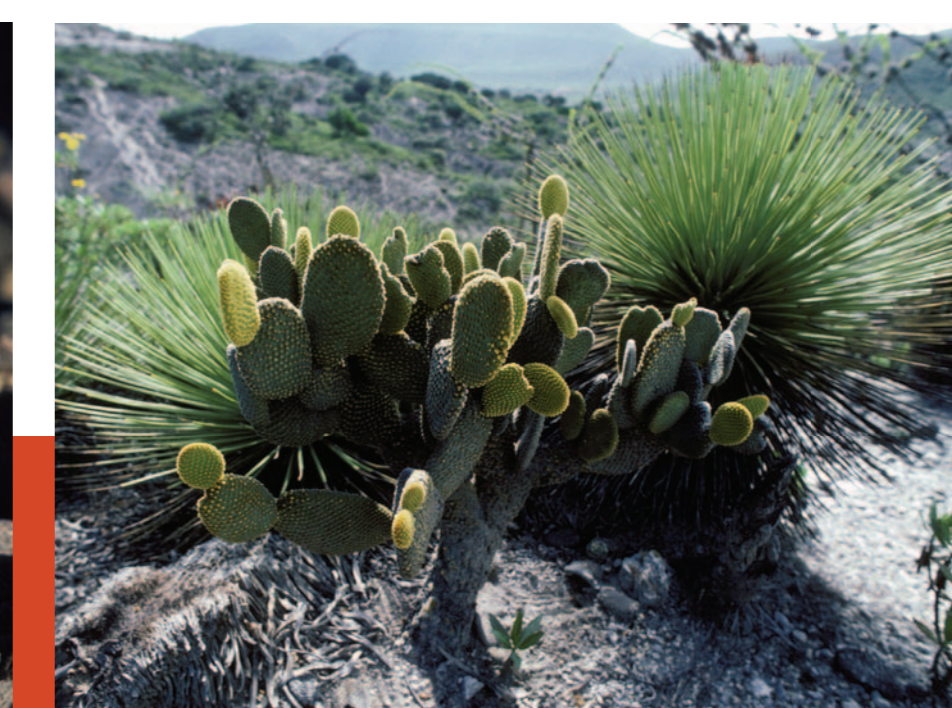
Valle del Mezquital. Nopales, magueyes, biznagas, nogales, cardones y garambullos conforman la vegetación de esta árida región que sólo recibe 300 mm de lluvia al año.