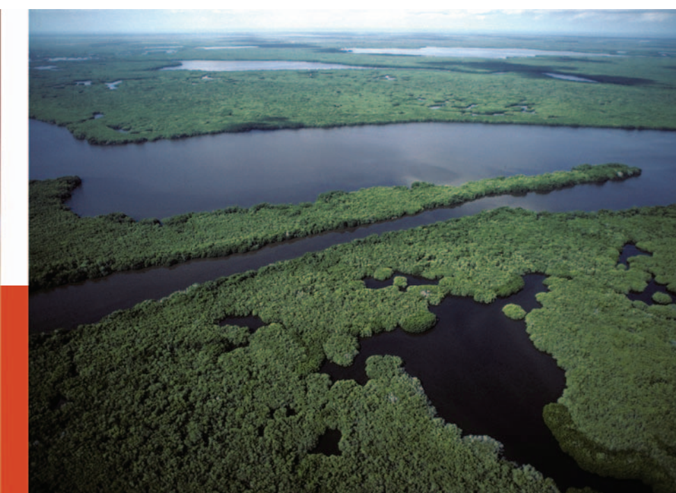
Marismas Nacionales. Son los manglares más extensos del Pacífico, muy ricos en biodiversidad y sitio de refugio de aves migratorias.