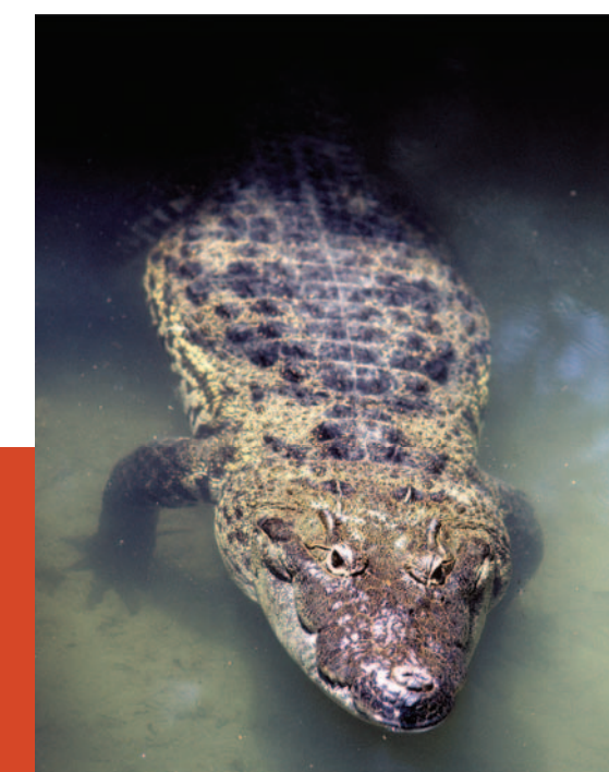
Cocodrilo de pantano. Tiene hábitos anfíbios y terrestres. Se asolea para mantener su temperatura corporal.

Áreas agrícolas Áreas sin vegetación Bosques Cuerpos de agua Zonas urbanas Matorrales Otros tipos de vegetación Pastizales Selvas Áreas naturales protegidas