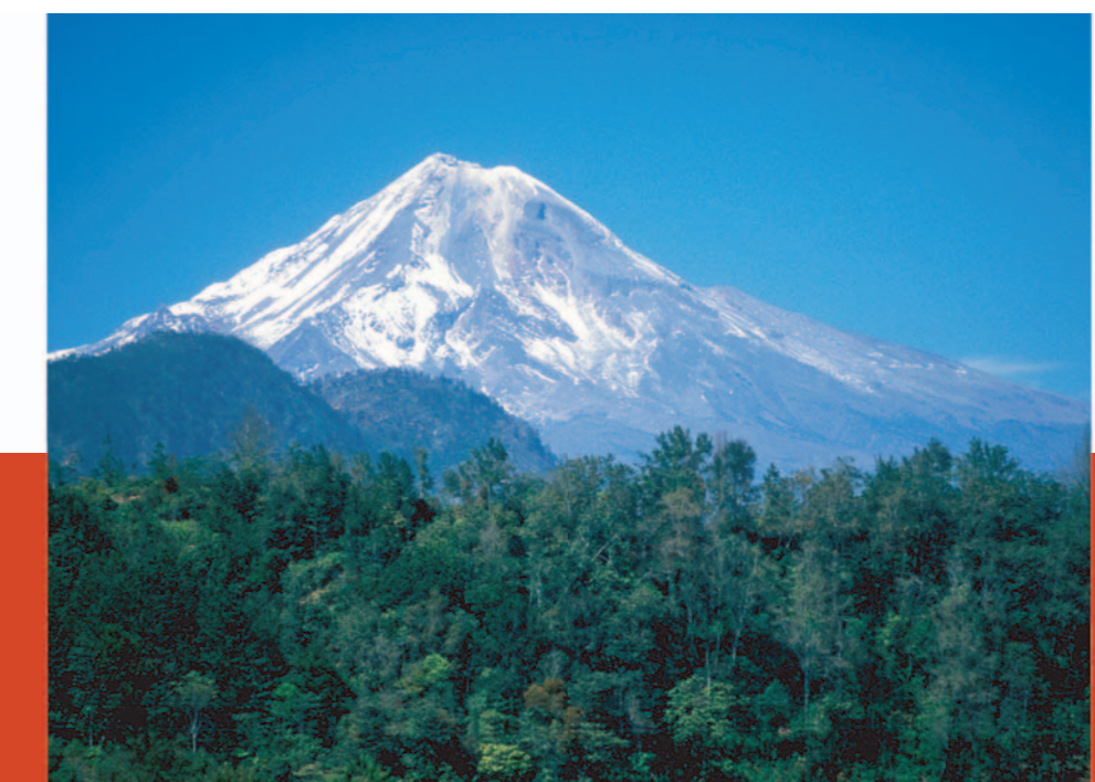
Pico de Orizaba. También llamado volcán Citlaltépetl, alcanza los 5 610 m de altura, es la cumbre más alta del país y la tercera en América del norte.