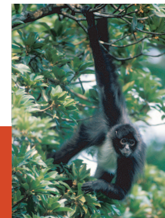
Mono araña. Vive en las copas de los árboles de la selva húmeda y está en peligro de extinción.